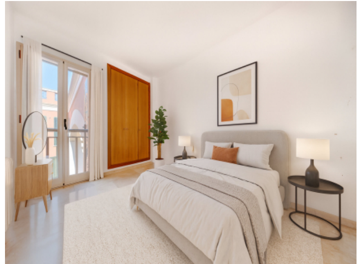
Eines von 3 Schlazimmern