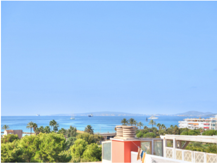
Private Dachterrasse mit Meerblick