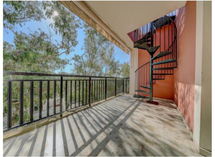
Balkon mit Zugang zur Dachterrasse