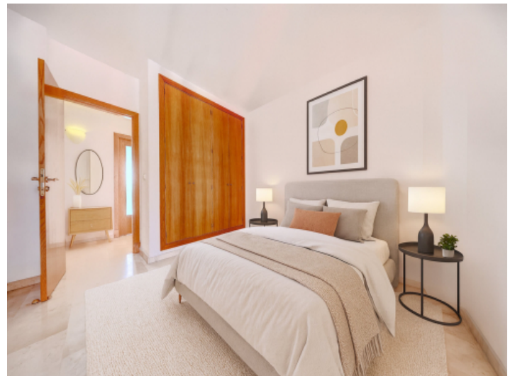
Eines von 3 Schlazimmern