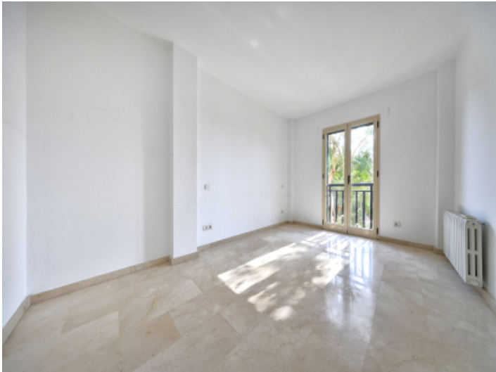
Eines von 3 Schlazimmern