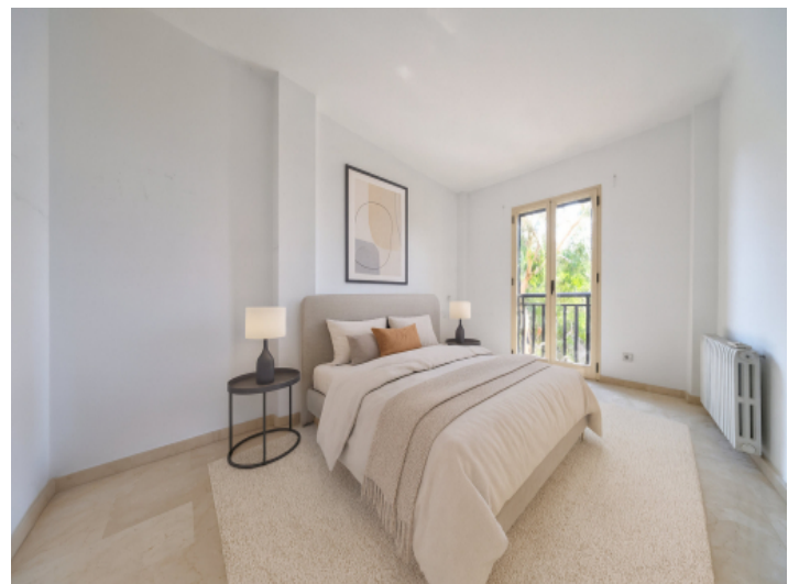
Eines von 3 Schlazimmern