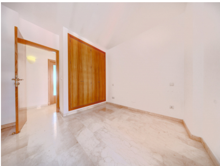
Eines von 3 Schlazimmern