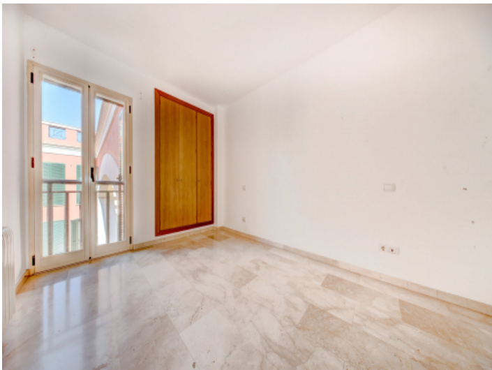
Eines von 3 Schlazimmern