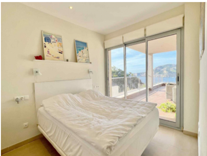
Schlafzimmer mit Terrassenzugang