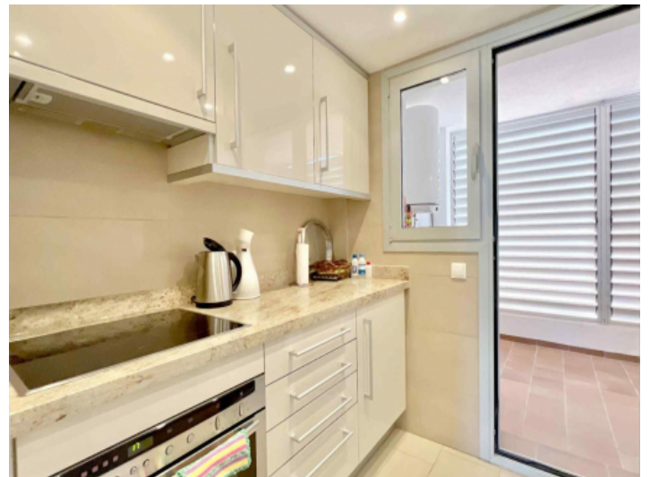
Voll ausgestattete Küche