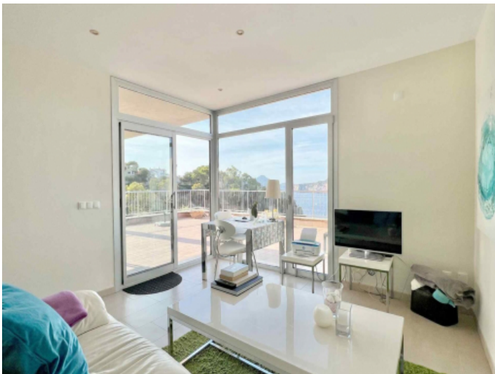
Offener Wohn- und Essbereich