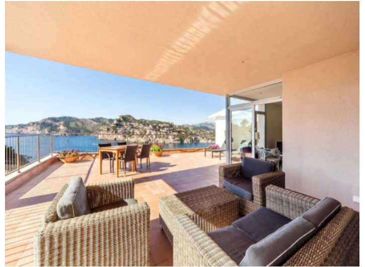
Loungebereich auf der Terrasse