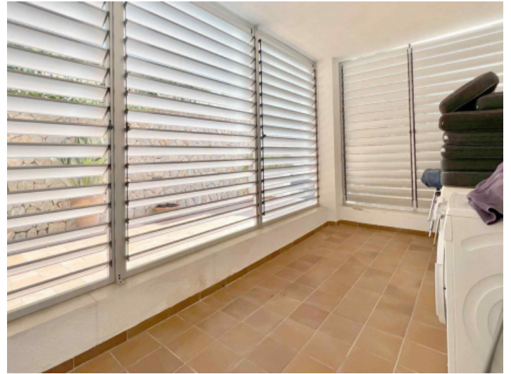
Hauswirtschaftsraum mit Waschmaschine