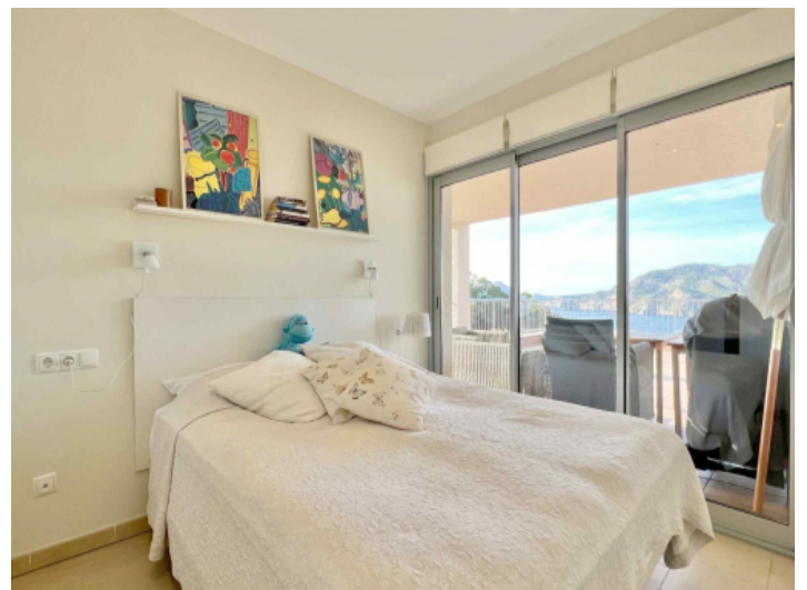
Schlafzimmer mit Doppelbett