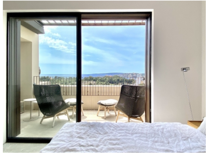
Blick auf den Balkon