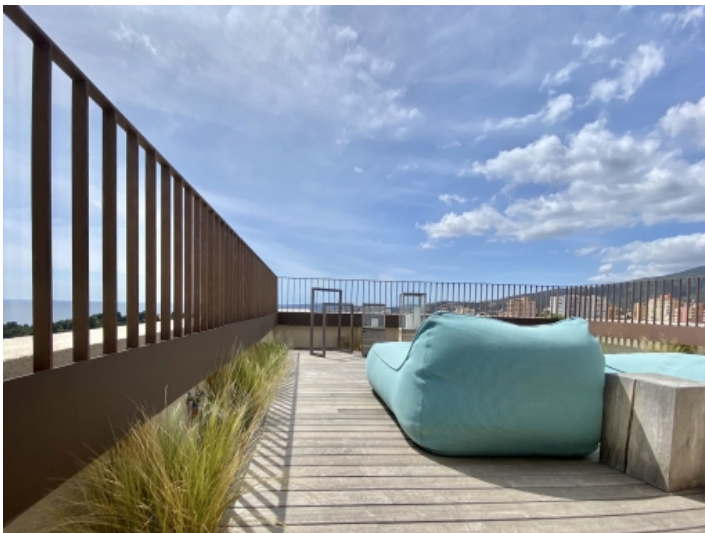
Ansicht der Dachterrasse