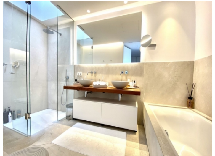
Elegantes Badezimmer mit Dusche