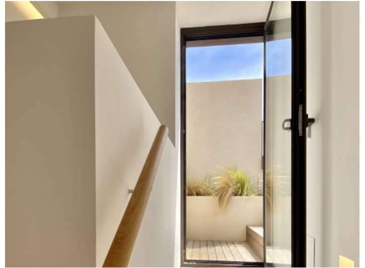
Zugang zur Dachterrasse