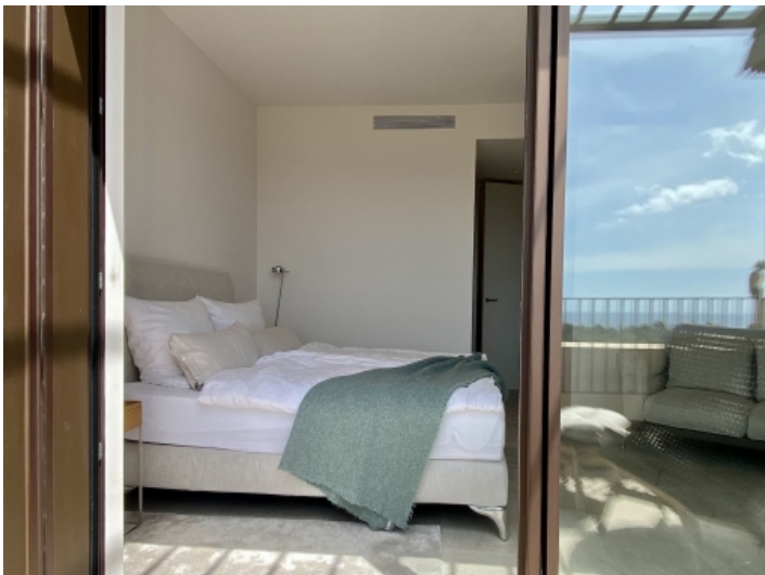
Blick in das Schlafzimmer