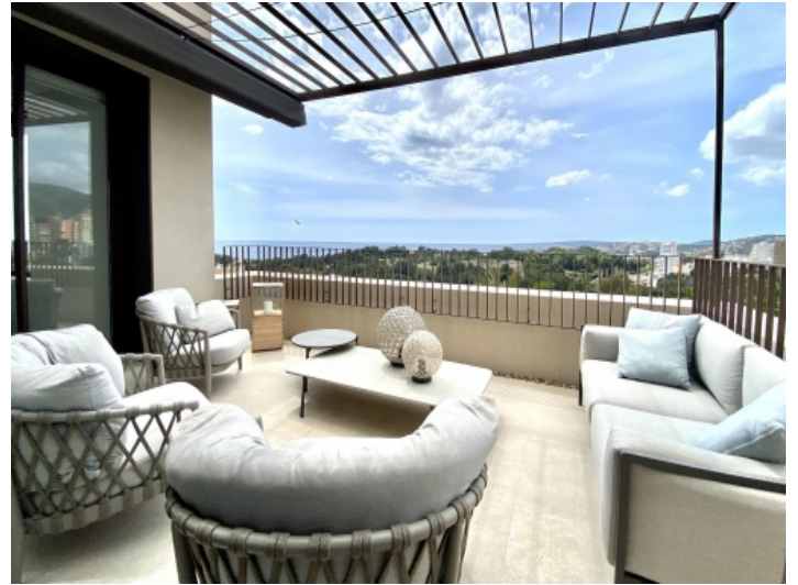
Terrasse mit Chill-Out Lounge