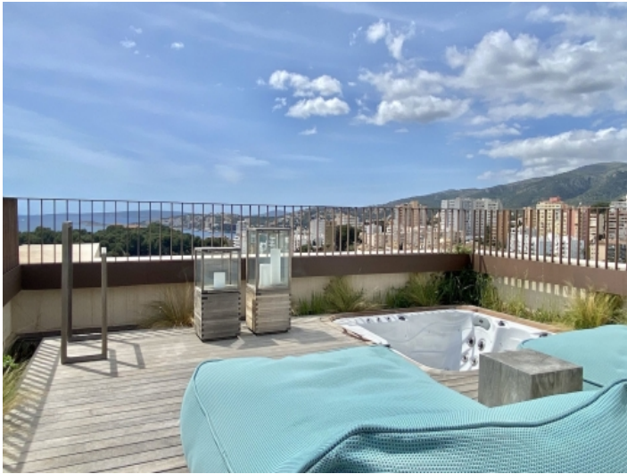
Dachterrasse mit Jacuzzi