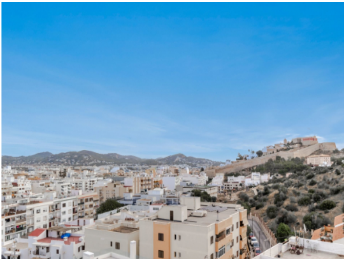
Aussicht über die Stadt