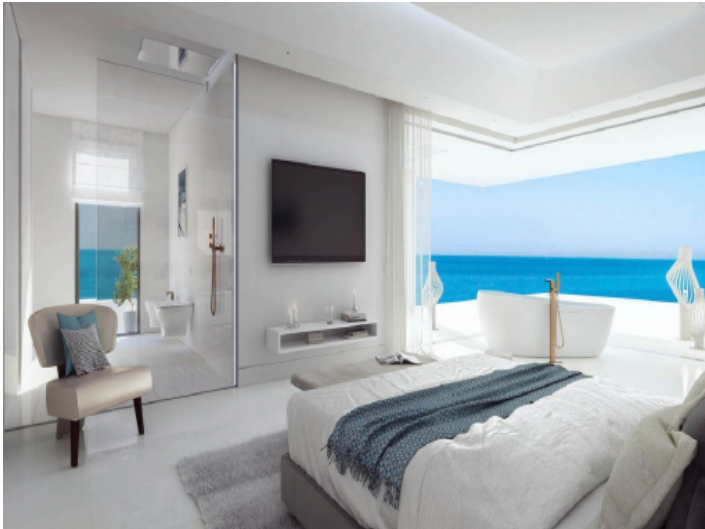
Luxuriöses Schlafzimmer mit Badezimmer