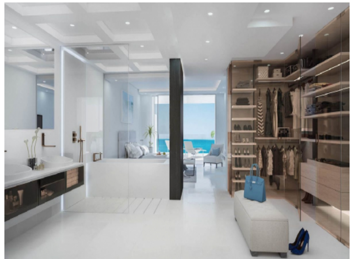
Hochwärtiges Schlafzimmer mit Badezimmer und