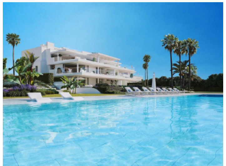
Der Gemeinschaftspool lädt ein den Sommer zu genießen