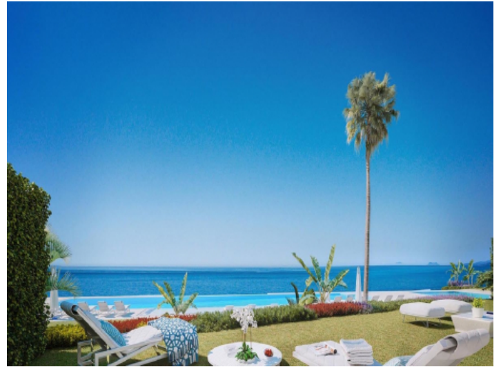
Pool in hervorragender Lage in erster Meereslinie