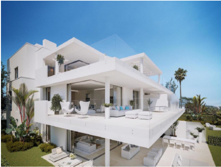
Seitenansicht des Wohngebäudes