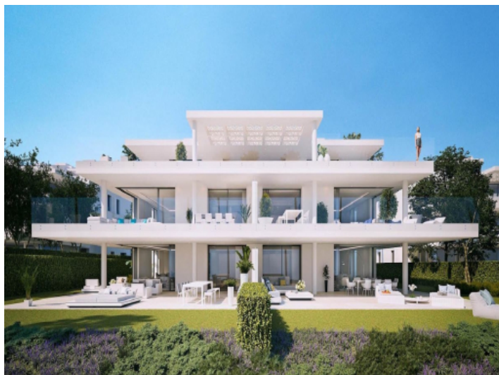
Frontansicht des Komplexes