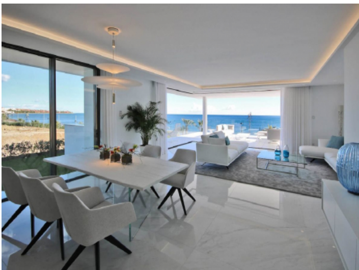
Großzügiger Wohn-und Essbereich