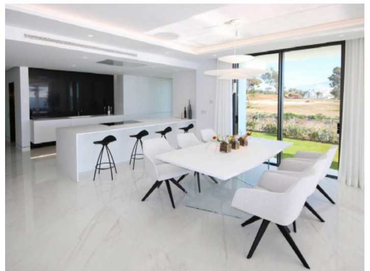
Heller Essbereich mit offener Küche