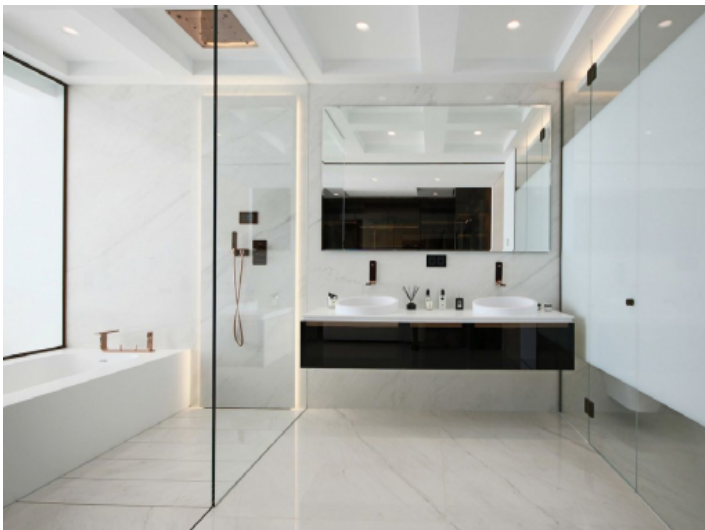
Elegantes Badezimmer en Suite