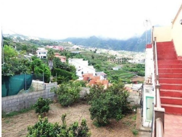
The rear garden