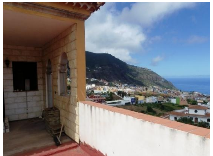
Beautiful views of the valley and the Atlantic