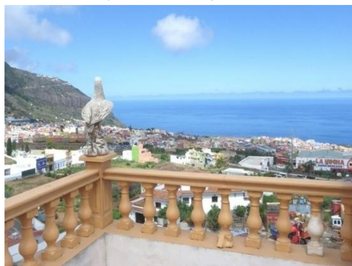
Panoramic sea views from the roof terrace