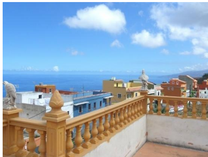
View along the north coast of Tenerife