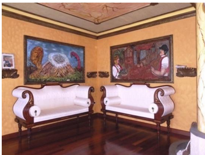
Living room with decorative ceiling design