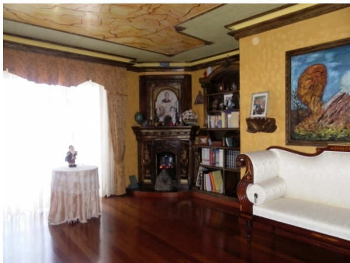
The salon with parquet and warm colors