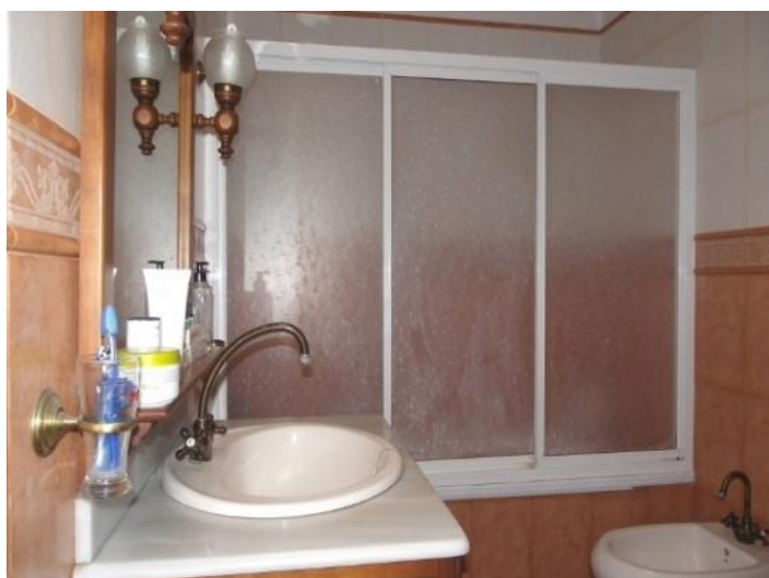
Full equipped bathroom on main bedroom