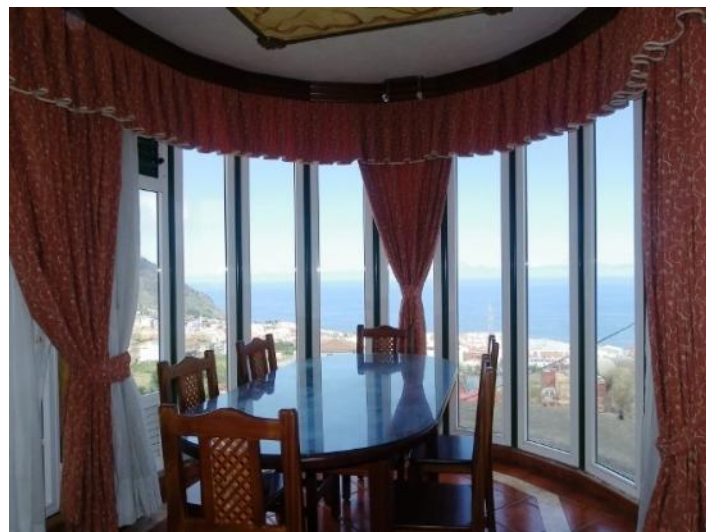
Exquisite views for any occasion