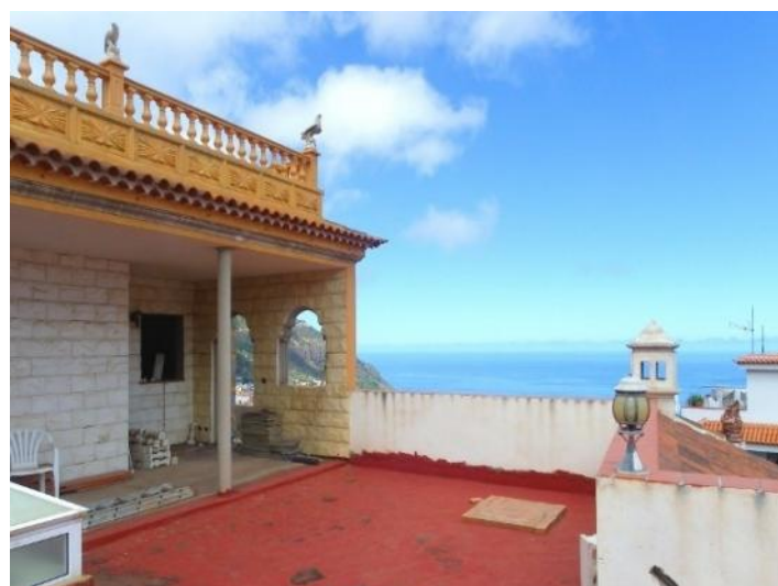
Large terrace with barbecue facilities and on both sides