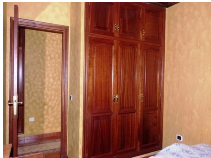
Built-in wardrobe in second bedroom