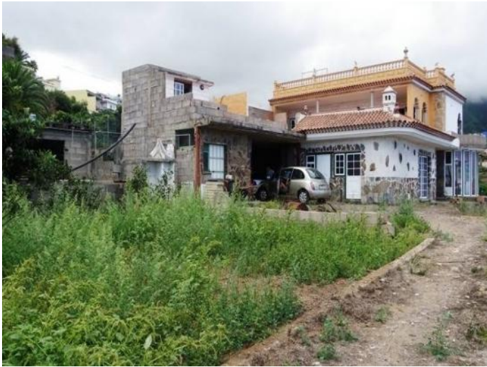
Overall view of the property on a large plot