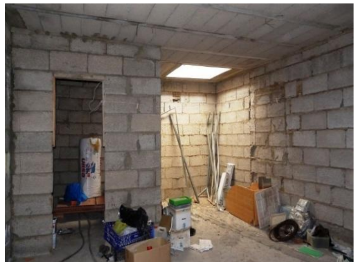
Probable bedroom and bathroom