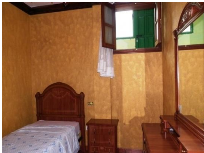
The second bedroom