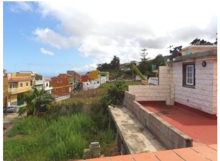
Cultivation over the garage and front garden