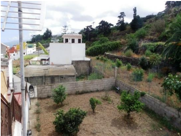
Free landscape view behind the villa