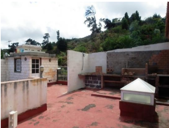
The large terrace for individual design