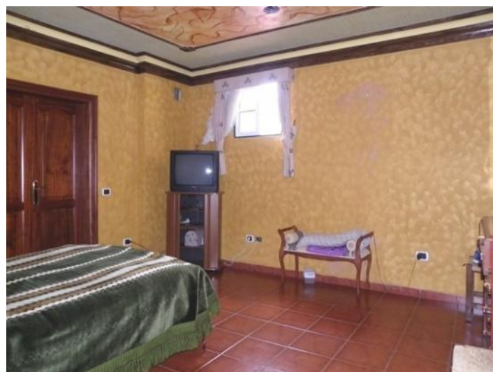
The master bedroom