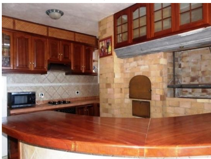
Open kitchen with BBQ