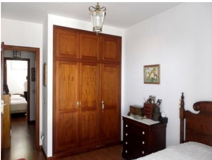
Beautiful built-in wardrobes in the bedrooms