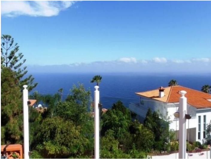
Exquisite sea views