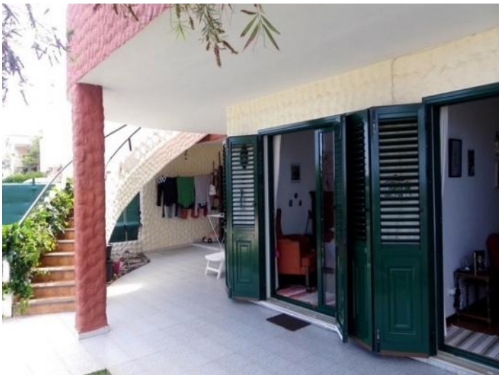
Covered garden terrace on the bedrooms