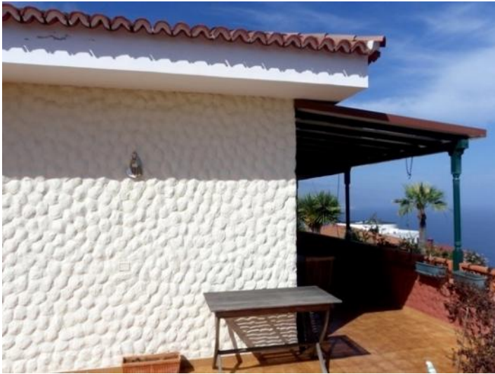
Terraces for morning and evening sun