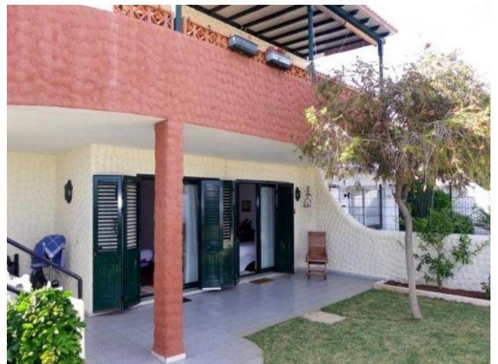
Tranquil oasis with garden and sea views on two levels