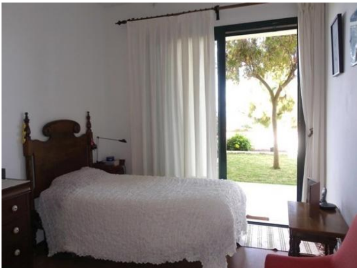
Bedroom to the terrace and garden