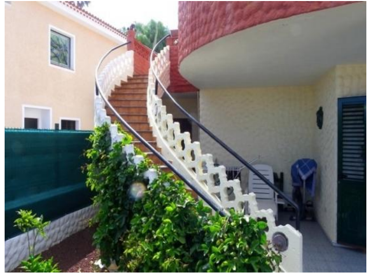
Curved exterior staircase