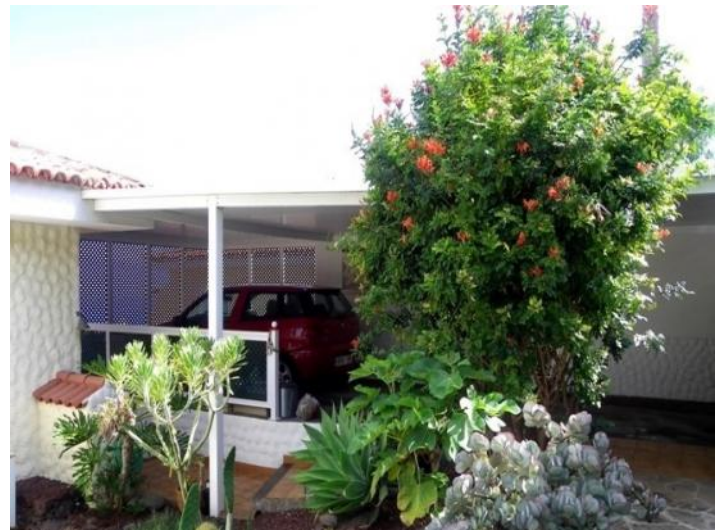
Space for 2 cars in carport