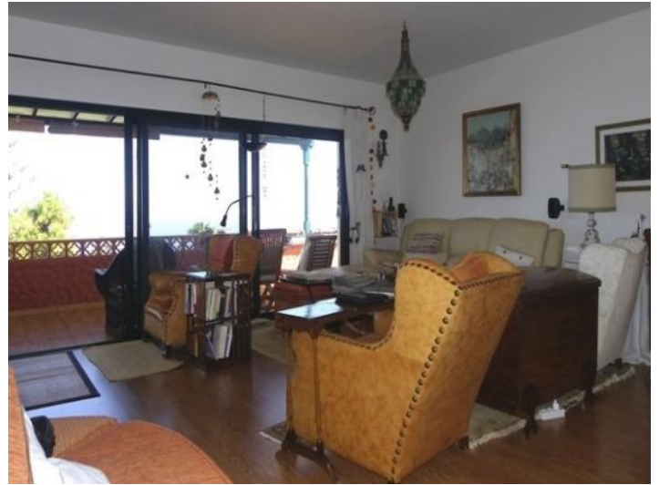
Spacious living room with panoramic terrace