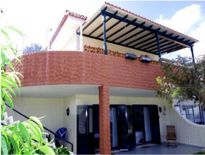
Front view with protected terraces on two levels