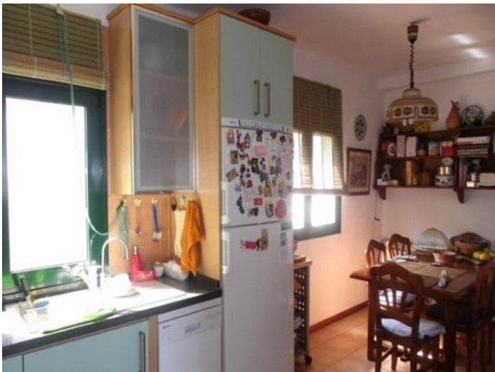
Large kitchen with dining area