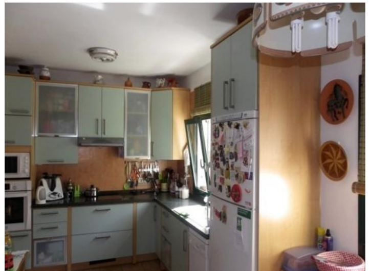
The fully equipped kitchen from a different perspective