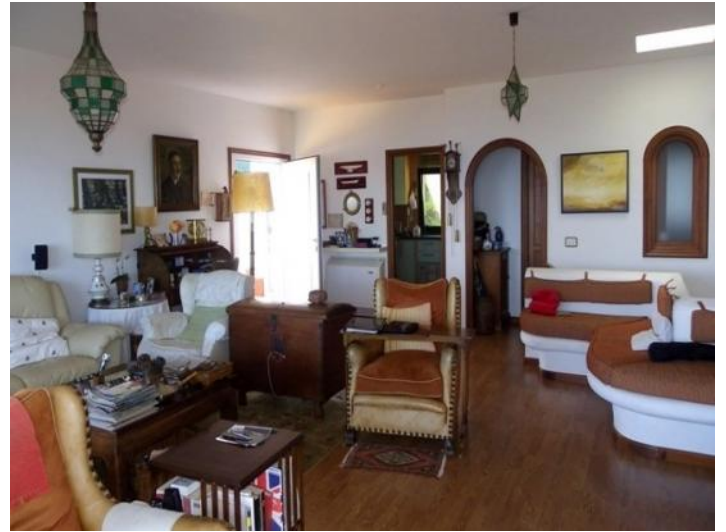
Salon with entrance and the passage to the kitchen in the