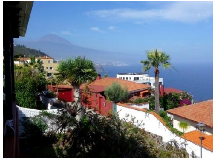
Views of Mount Teide, Puerto de la Cruz and the Atlantic