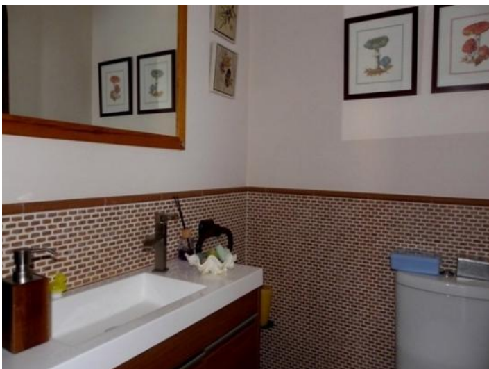
New guest toilet