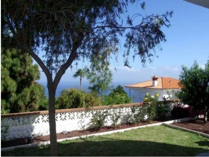
Lawn with sunny and shady spots