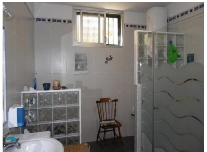
Spacious bathroom with shower, bidet, toilet and 2 sinks