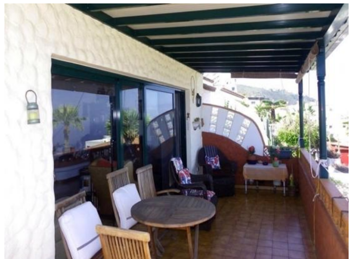
The upper terrace with stylish roof