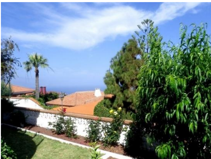
Garden in very quiet location with sun and sea