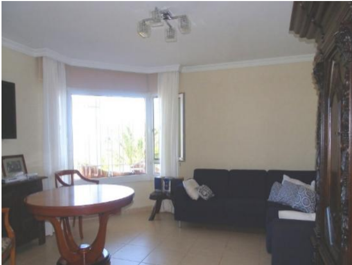
Cozy living room of the house