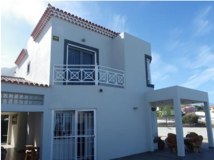
Exterior view of the modern villa