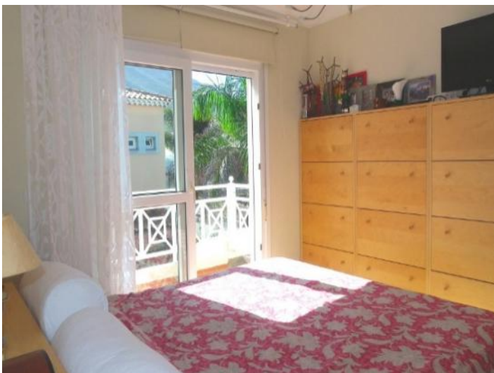
Another large bedroom with balcony