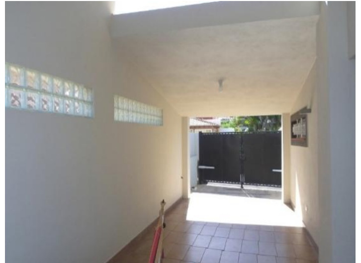
Large carport beside the garage