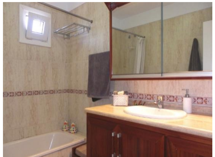
Nice bathroom with bath tub