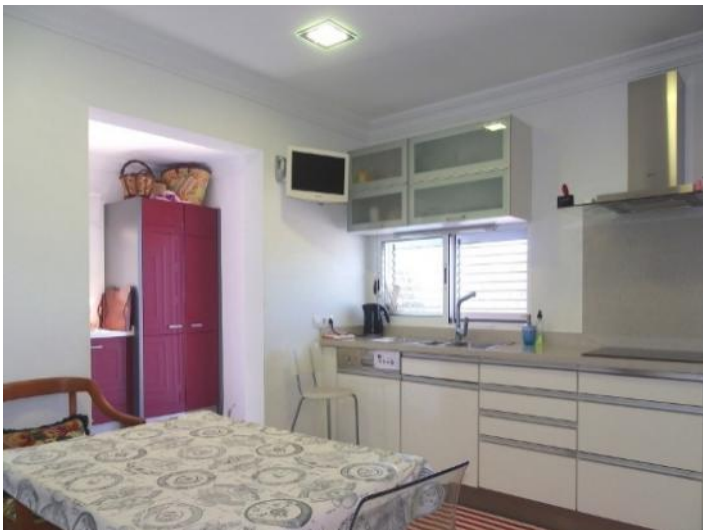
Spacious fully equipped kitchen with laundry