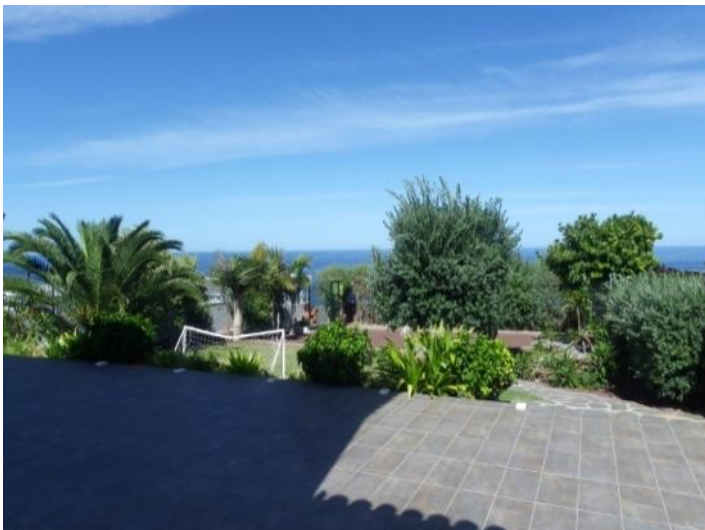
Oasis with large terrace, garden and the sea