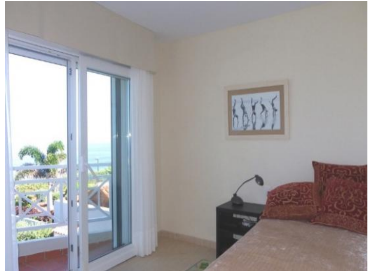
Bright bedroom with modern glass doors and ocean view