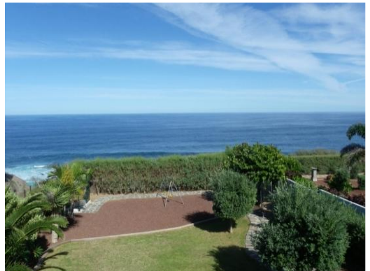
Amazing view of the garden and the sea