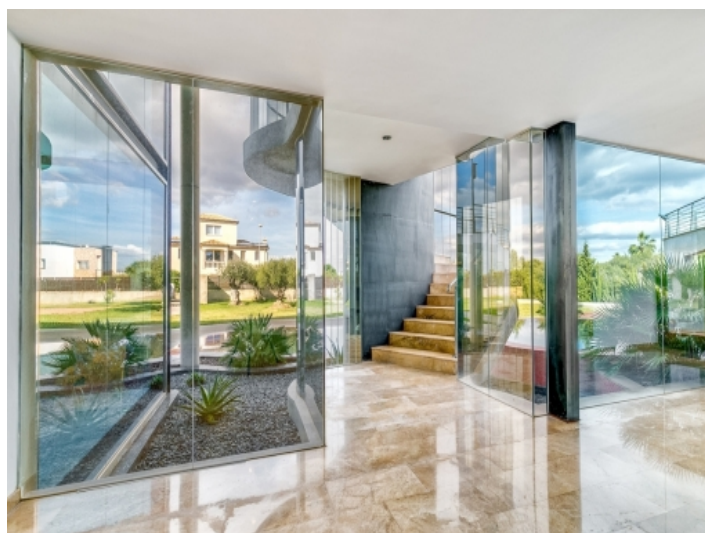
Blick in den Garten und auf dem Pool vom Untergeschoss aus