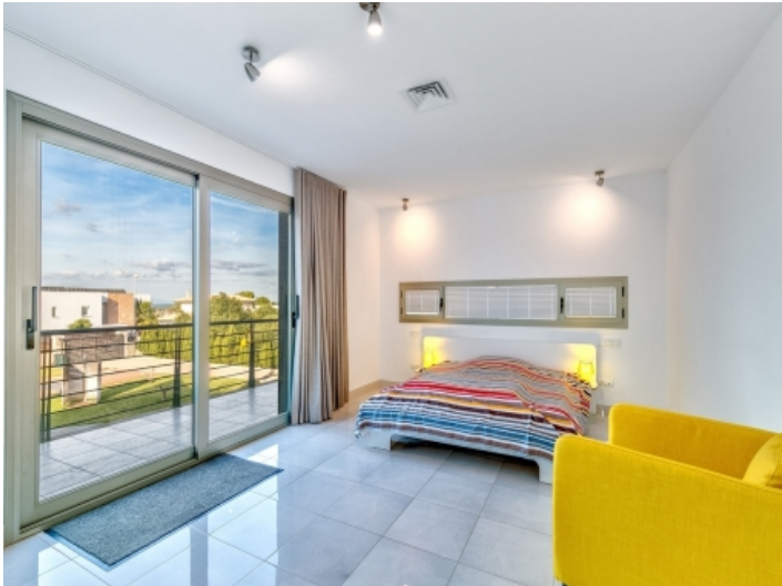
Doppelschlafzimmer mit Balkonzugang