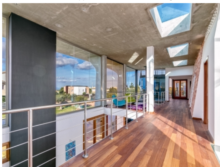
Weitläufige Galerie mit Loungebereich