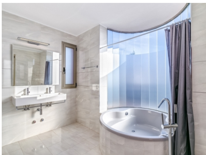
Eines von 5 Badezimmern mit komfortabler Badewanne