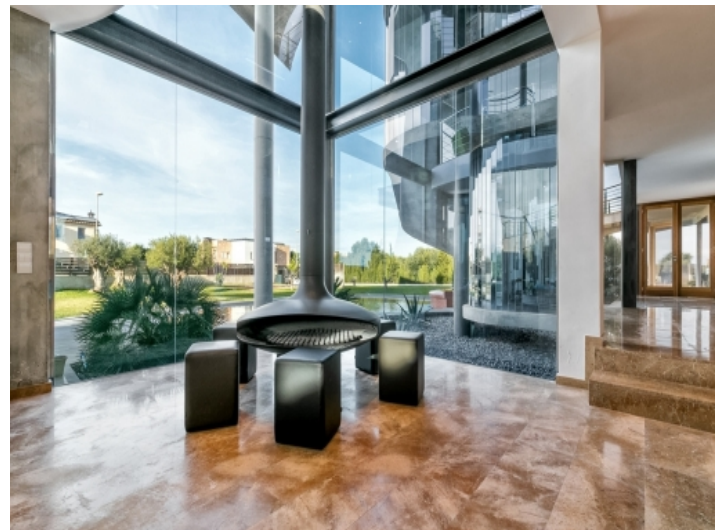
Stilvoller Entspannungsbereich mit Blick in den Garten und