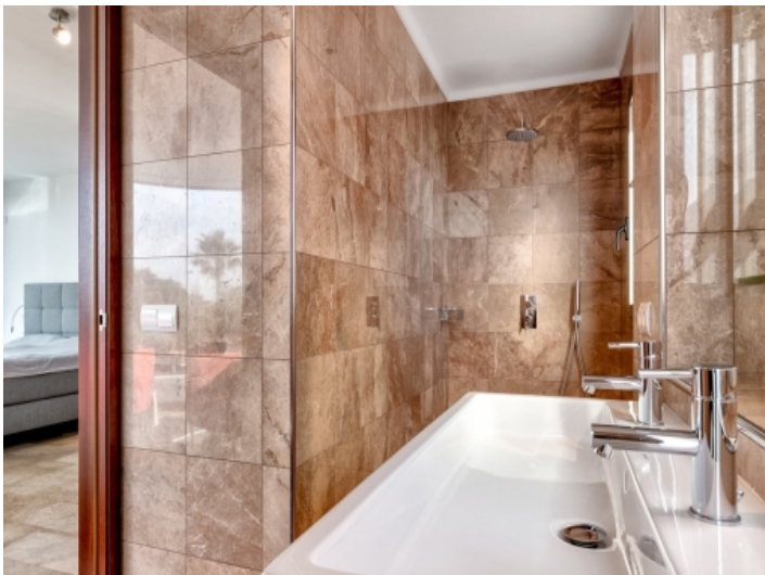
Hauptbadezimmer en Suite mit Dusche