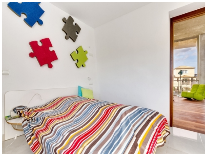
Ein weiteres Doppelschlafzimmer im Obergeschoss