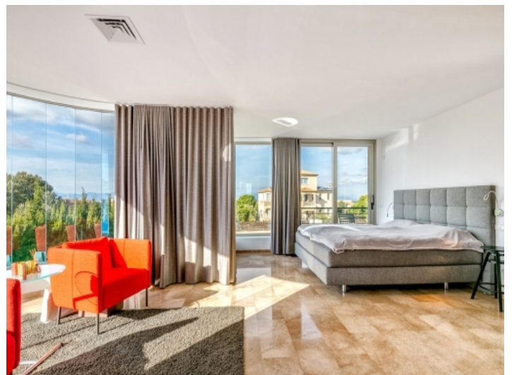
Großzügiges Hauptschlafzimmer mit fantastischer Glasfront