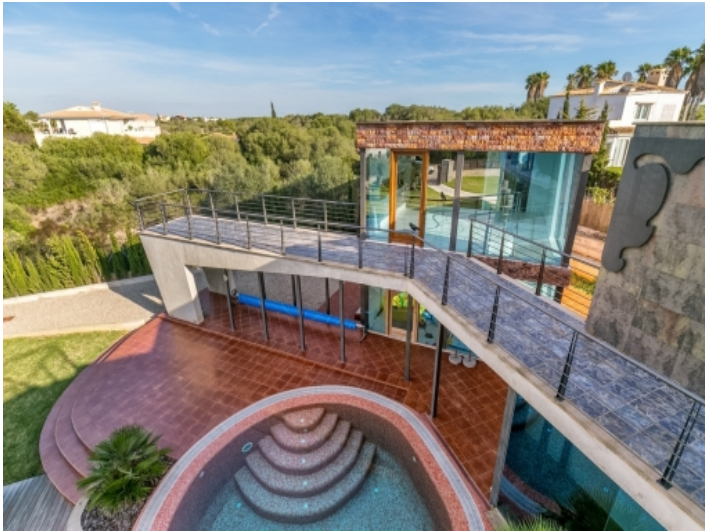
Toller Garten und Poolbereich