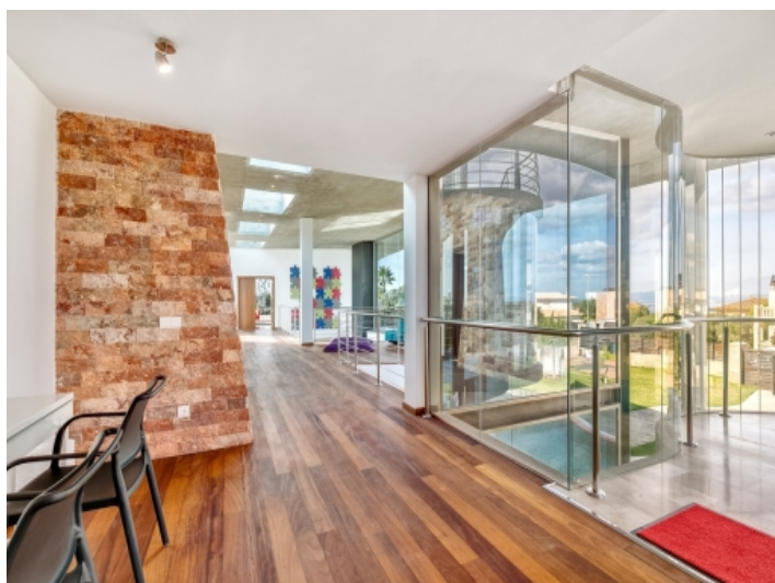
Die komplett verglasten Wohnbereiche sind ein Highlight