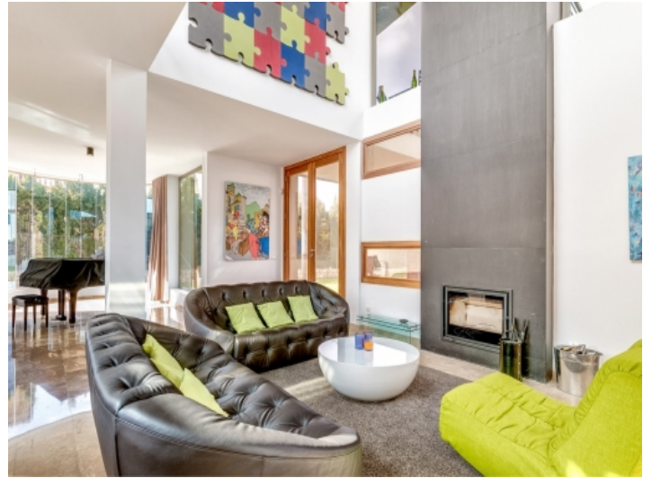
Lichtdurchfluteter Wohnbereich mit Kamin