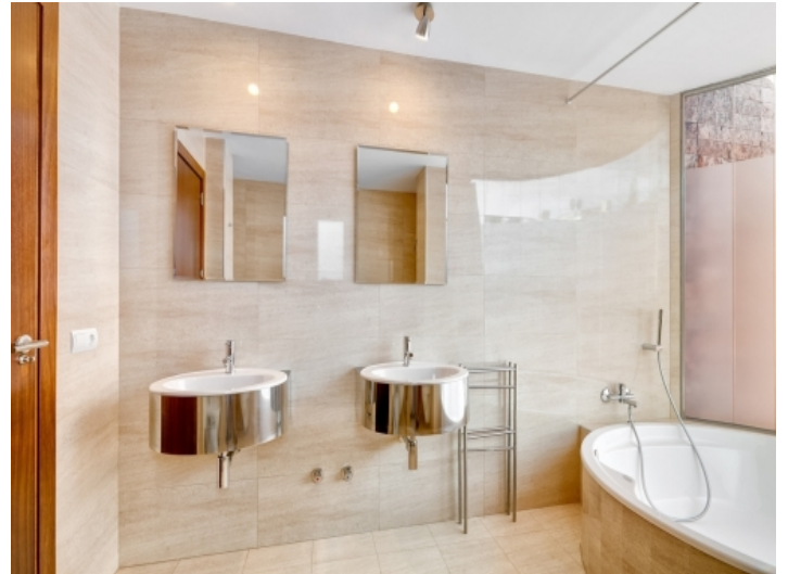
Nobles Badezimmer mit Badewanne und Tageslicht