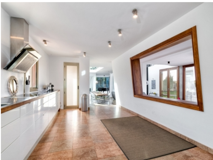
Moderne, geräumige Küche