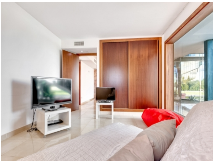
Gästezimmer mit Einbauschränk