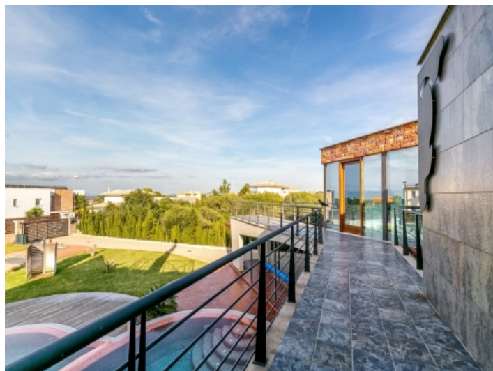
Die Villa hat ein separates Gästehaus