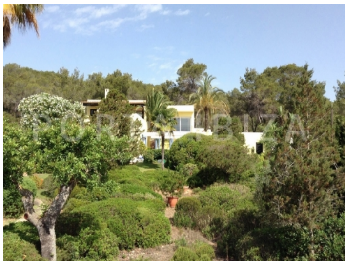
san carlos-villa- garden