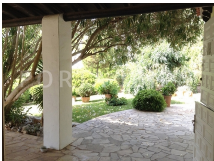
view garden-san carlos-villa