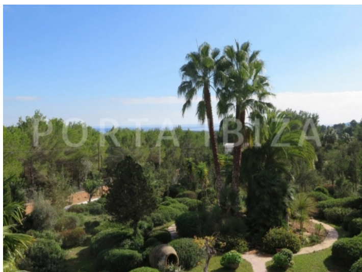
sea view-villa-san carlos