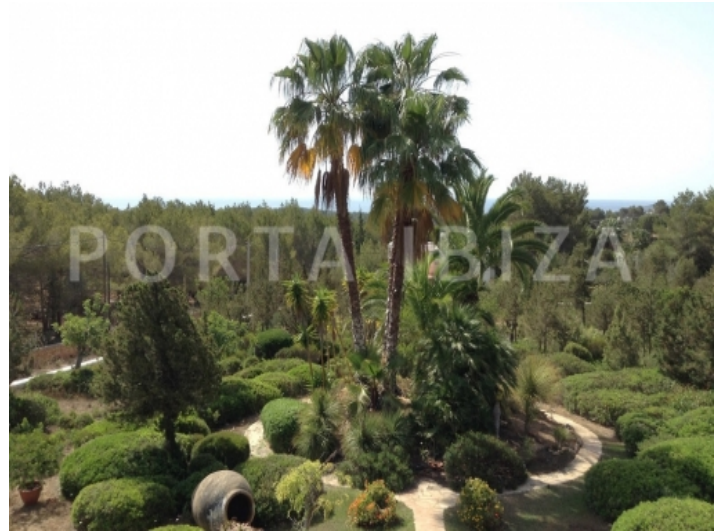
view garden-villa-san carlos