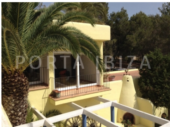
san carlos-villa- outside fireplace