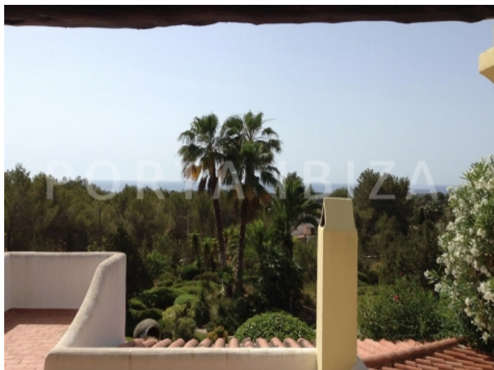
sea view-san carlos-villa