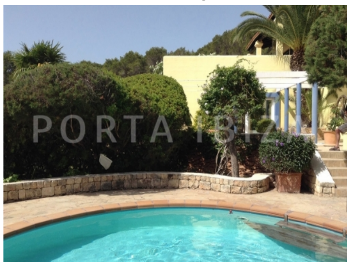
san carlos-villa-pool area