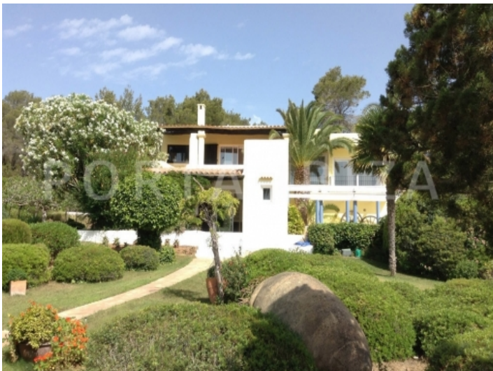
san carlos-villa- front view