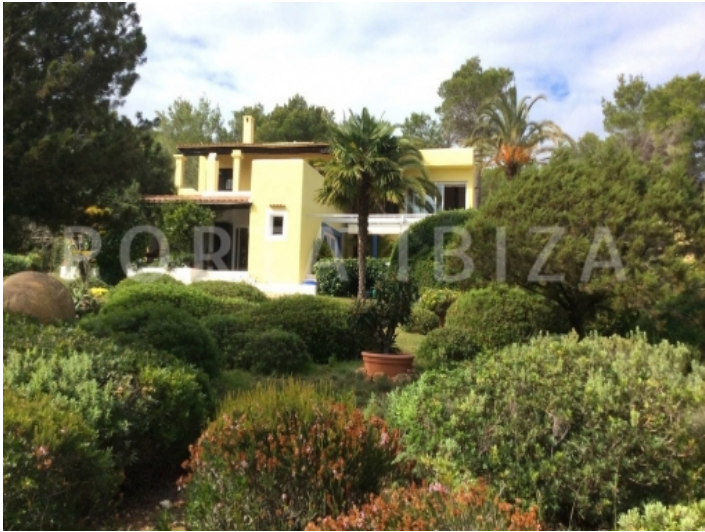
san carlo-villa-outdoor area