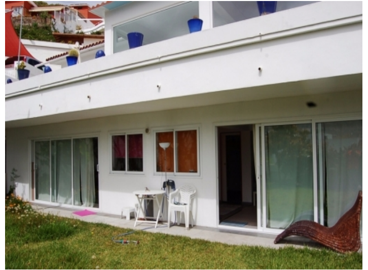
Außenansicht des Apartments