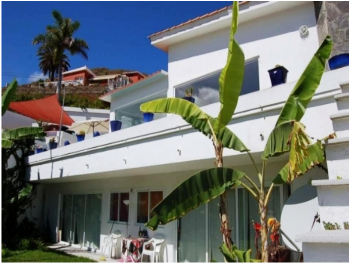
Haus, Puerto de la Cruz