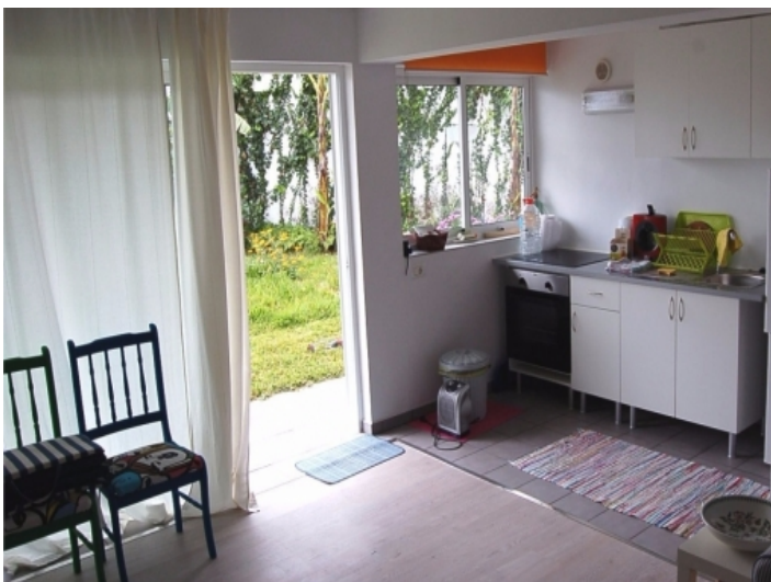
Küche und Terrassentür in den Garten