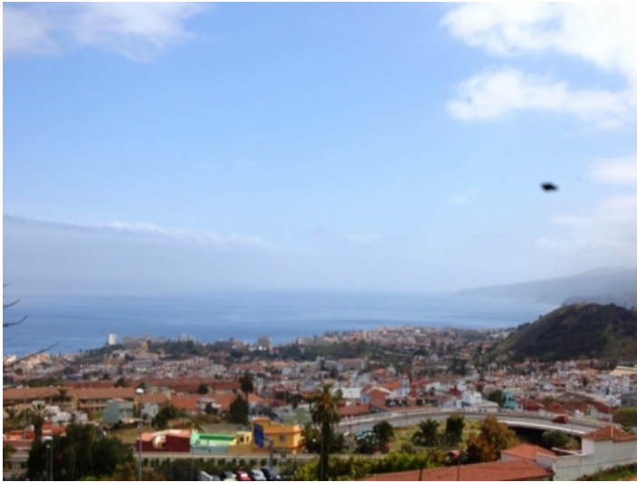
Blick auf Puerto de la Cruz und zur Küste