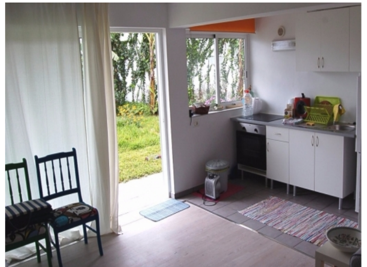
Küche und Terrassentür in den Garten