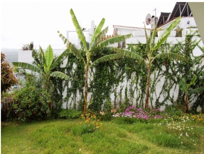
Bananenbäume im Garten