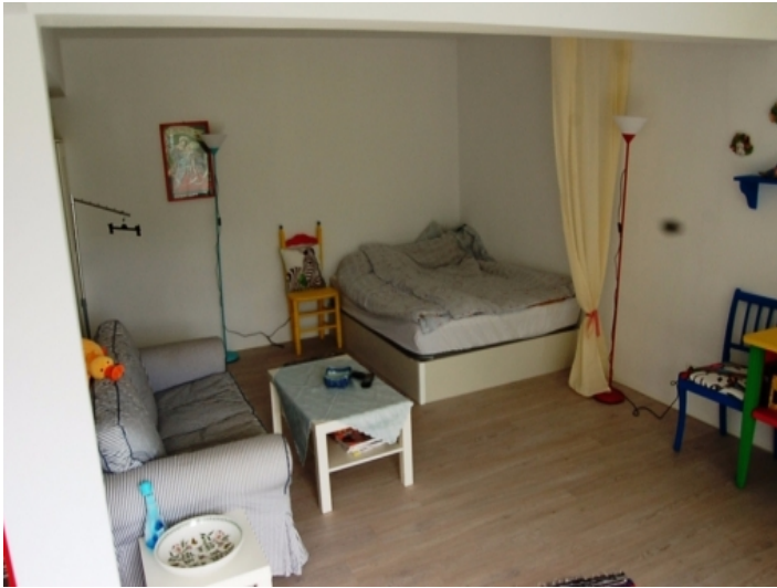
Sofa und Doppelbett