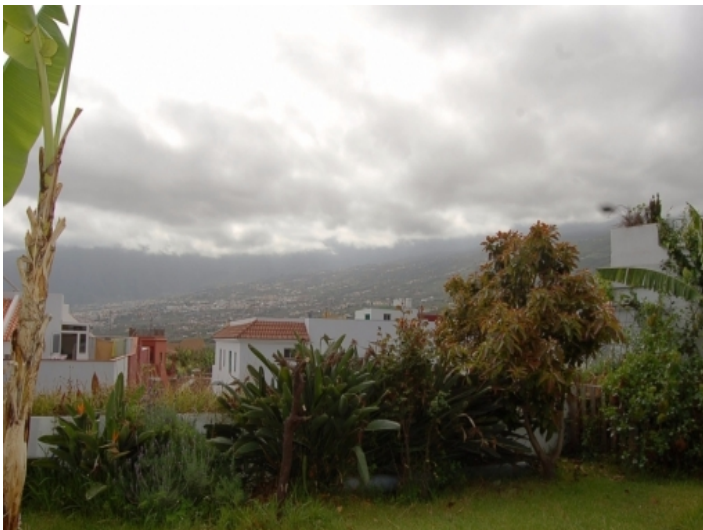
Blick ins Orotava-Tal