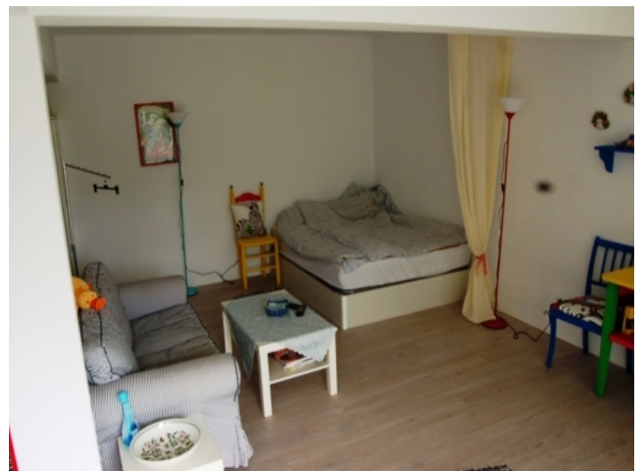
Sofa und Doppelbett