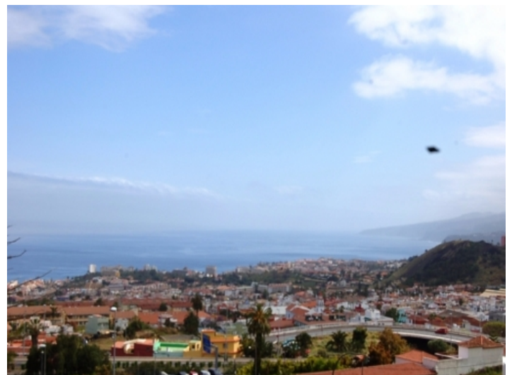
Blick auf Puerto de la Cruz und zur Küste