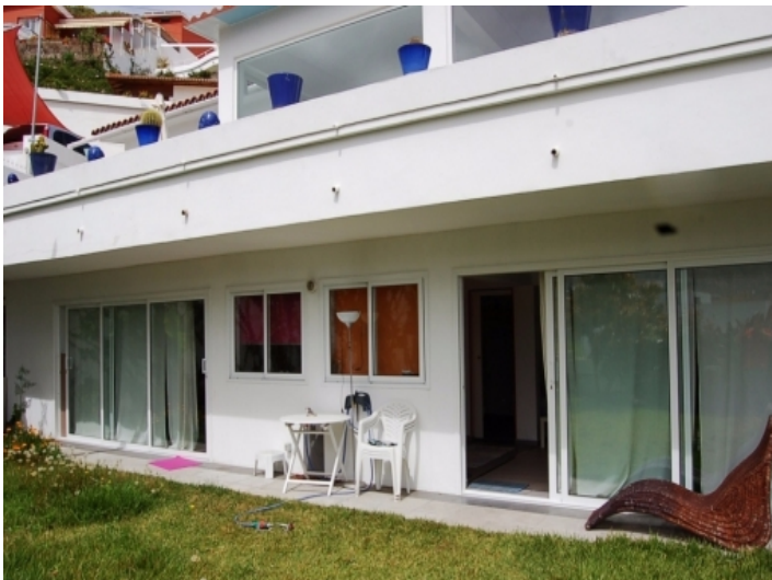
Außenansicht des Apartments