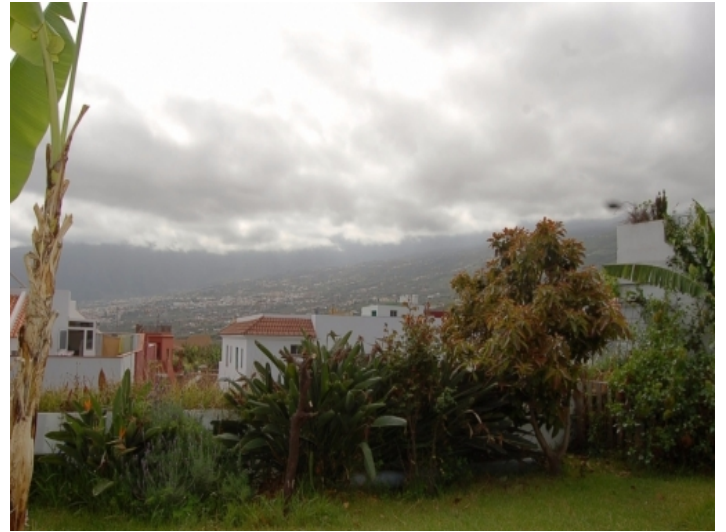
Blick ins Orotava-Tal