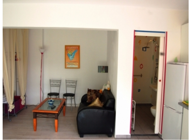
Blick auf die gemütliche Sitzecke