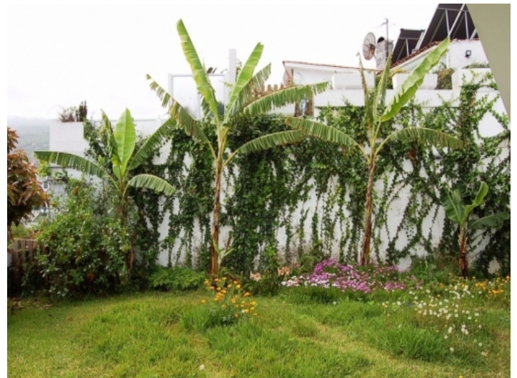
Bananenbäume im Garten