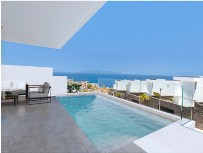
Sybaris-Premium-Villas-villa 32 vistas