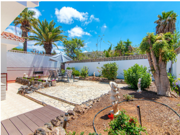
Gepflegter Garten mit Terrasse