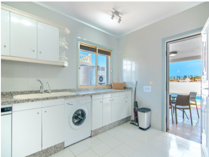
Küche mit Terrassenzugang