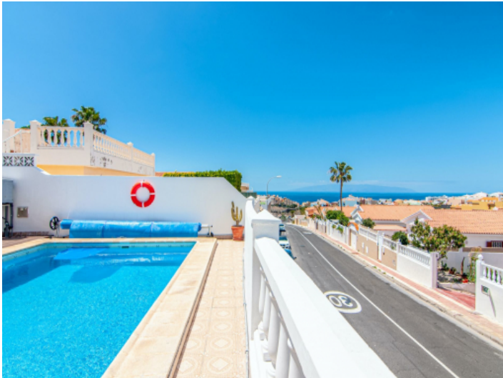
Pool mit Meerblick