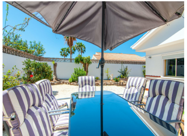
Essbereich im Freien