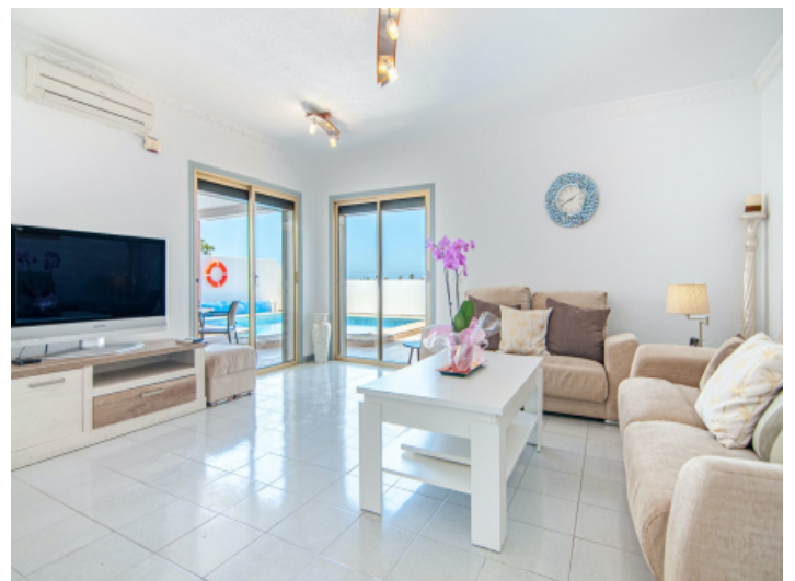
Wohnbereich mit Terrassenzugang