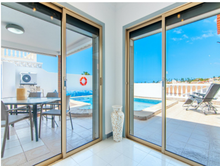
Blick auf die Poolterrasse