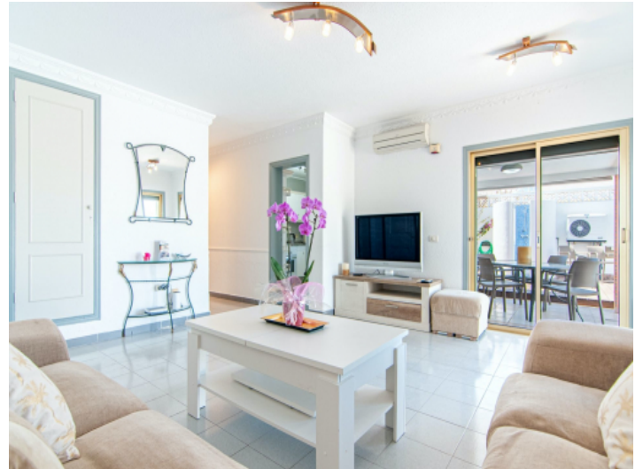
Wohnbereich mit Terrassenzugang