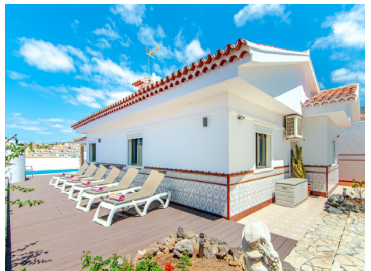
Sonnenterrasse mit Liegen