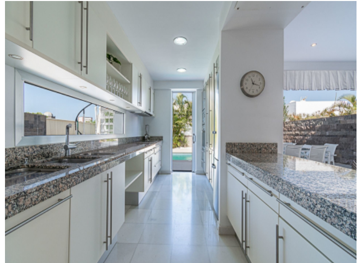
Große und praktische Küche