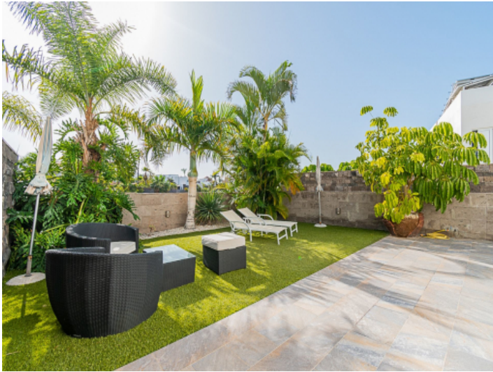
Schön begrünter Patio