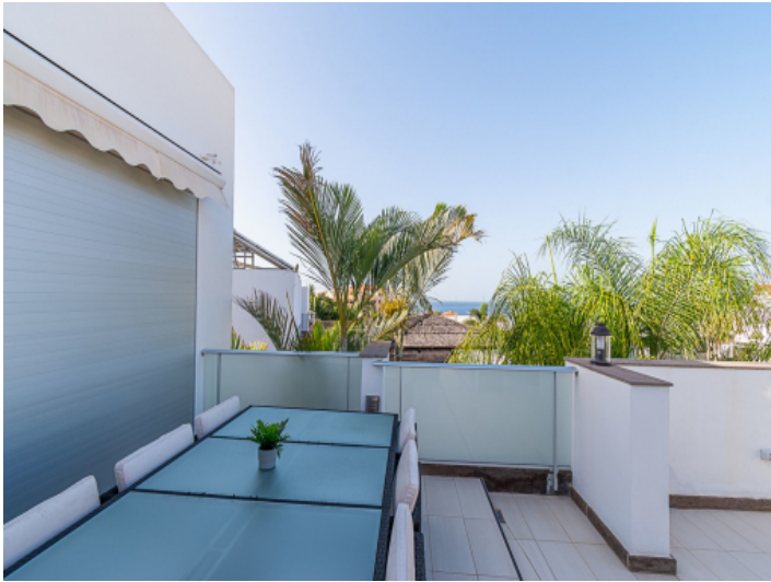
Große Dachterrasse mit Meerblick