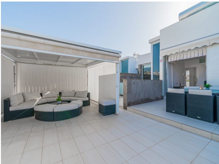
Große Dachterrasse mit vielen Annehmlichkeiten