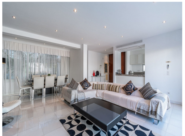
Heller Wohnbereich mit halb offener Küche