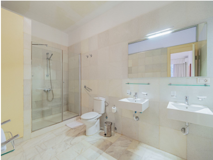
Eins von 5 Badezimmern