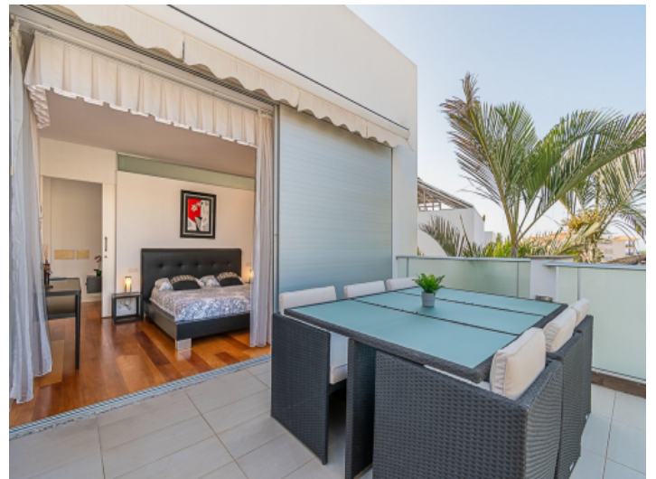
Schlafzimmer mit Zugang zur Dachterrasse