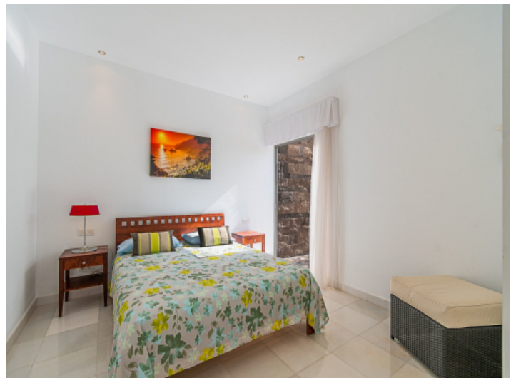
Eins von 5 Schlafzimmern