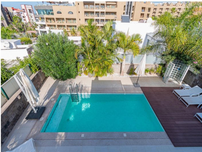
Blick von der Dachterrasse auf den Poolbereich und