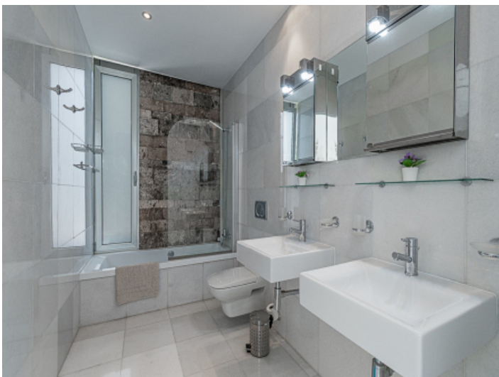
Duschbadezimmer en Suite