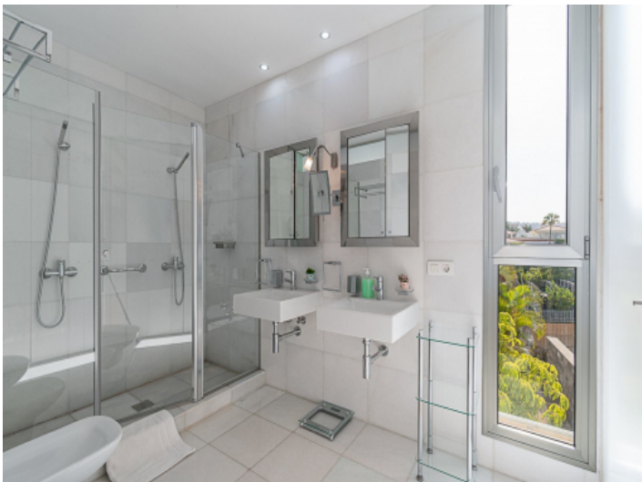
Badezimmer mit bodentiefe Dusche