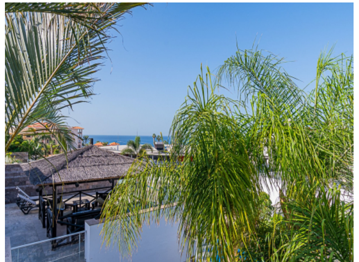
Dachterrasse mit Meerblick