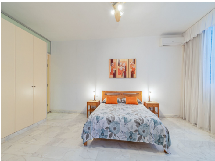
Alles Schlafzimmer sind mit Einbaukleiderschränken ausgestattet