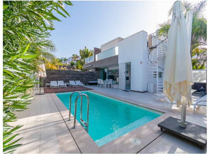
Ansicht der Fassade