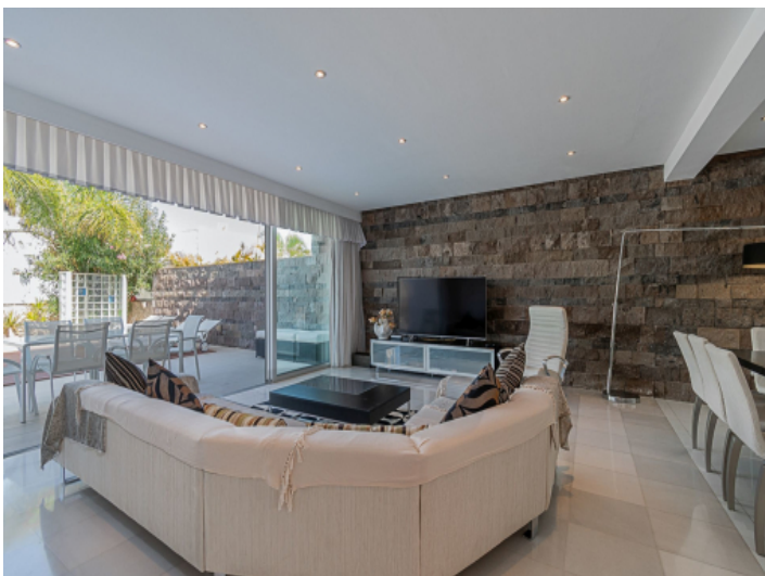
Der Wohn- und Essbereich grenzen direkt an den Poolbereich