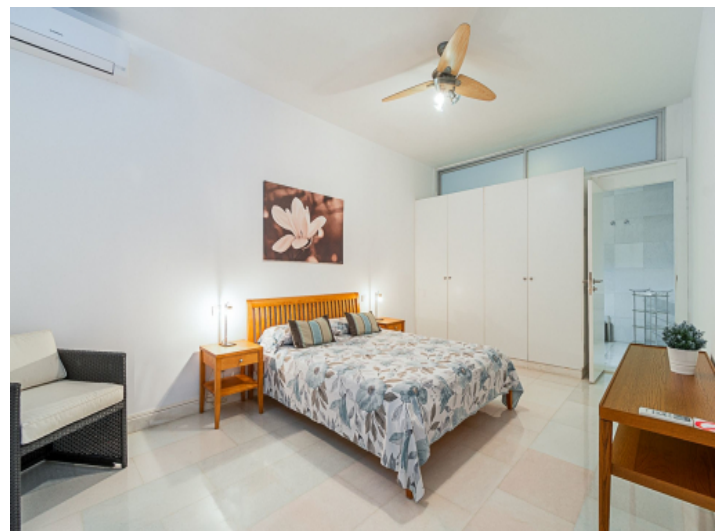
Ein weiteres Schlafzimmer