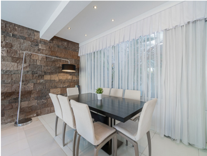
Essbereich mit Natursteinwand