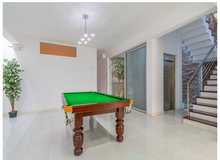
Hobbyraum im Keller einfach über den Aufzug oder Treppenhaus zu erreichen