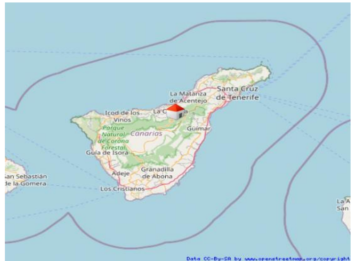
La Victoria de Acentejo