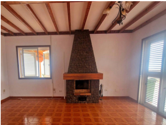
Geräumiges Wohnzimmer mit Kamin