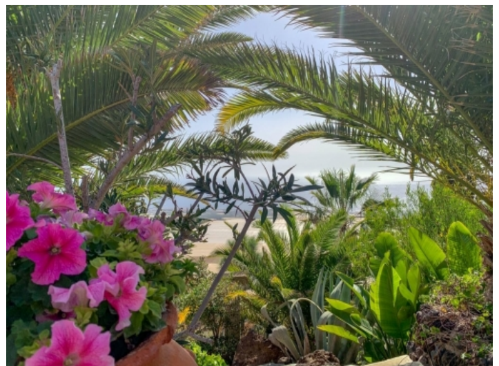
Garten und Meerblick