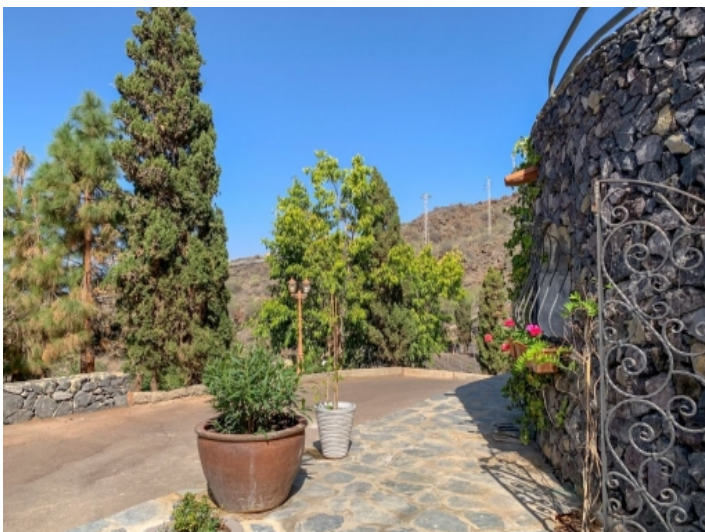
Garten der Villa