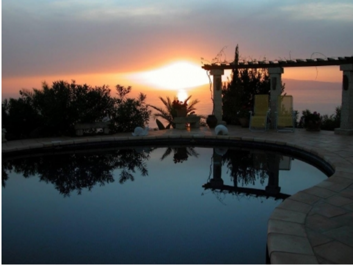
Der Pool bei Nacht