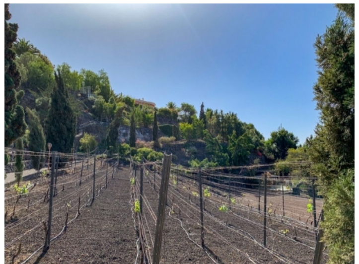
Blick zur Villa