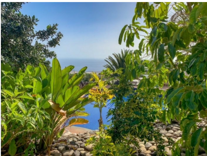
Garten und Pool