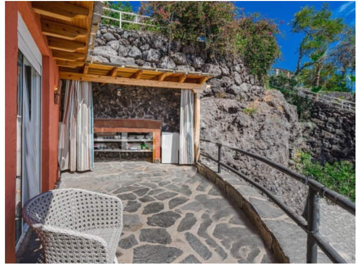
Blick auf die Terrasse