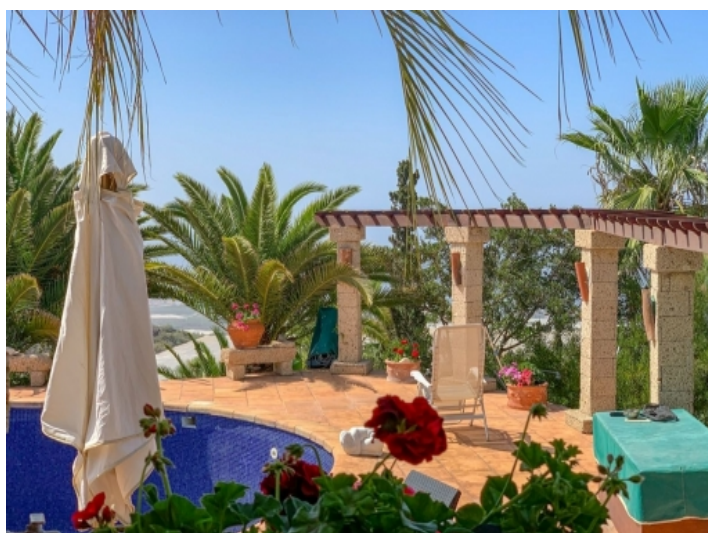
Sonnige Terrasse am Pool