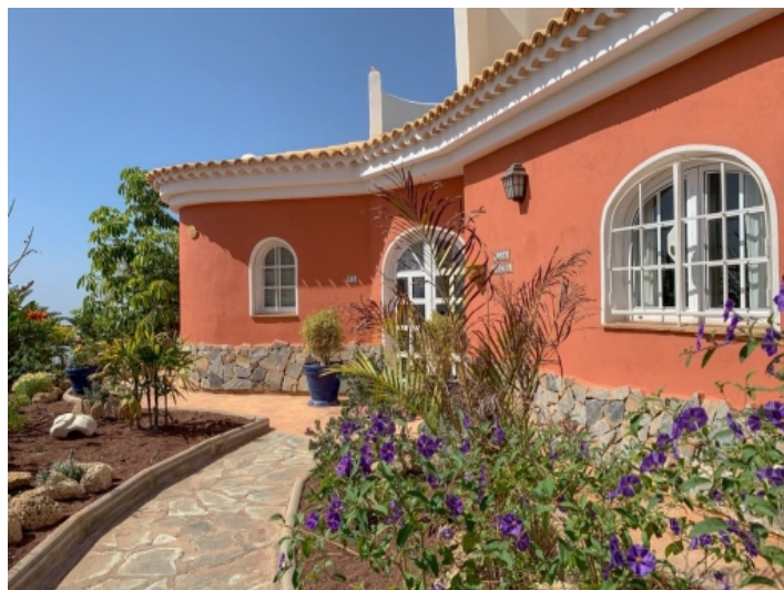
Eingang der Finca