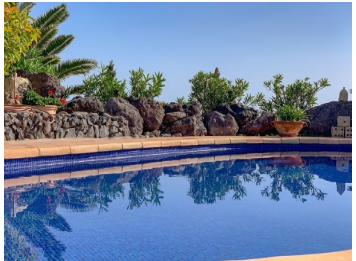
Alternative Ansicht des Pool