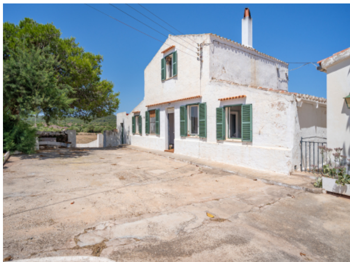
Sehr schönes ländliches Anwesen von 42 ha mit