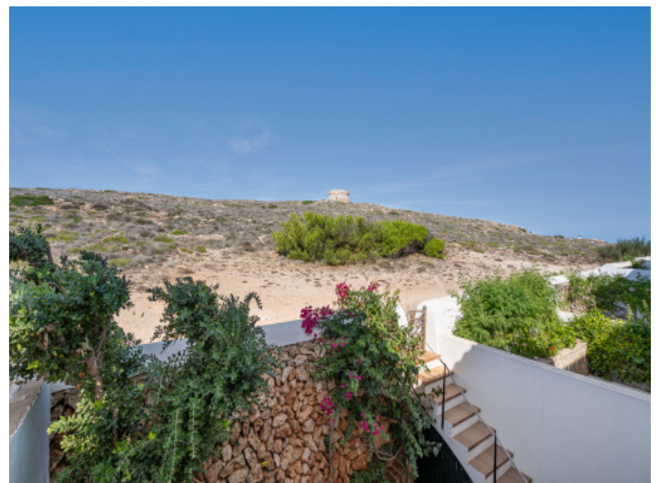
Blick auf die Rückseite des Hauses