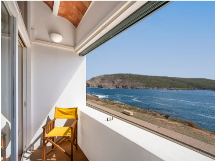
Traumhafter Meerblick vom Balkon