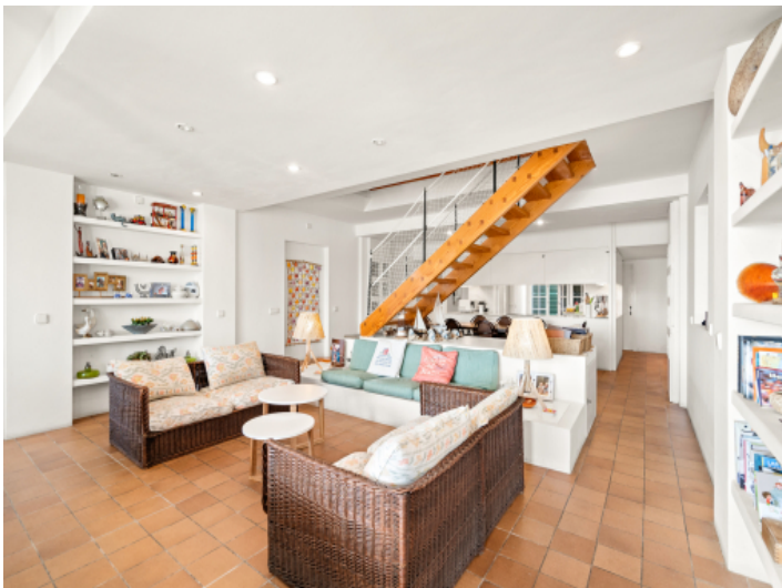
Großer, offener Wohnbereich