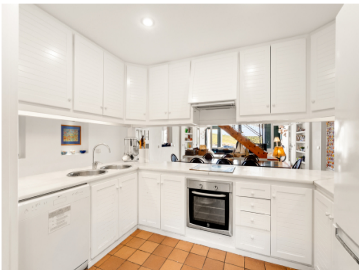
Tolle Küche mit viel Platz