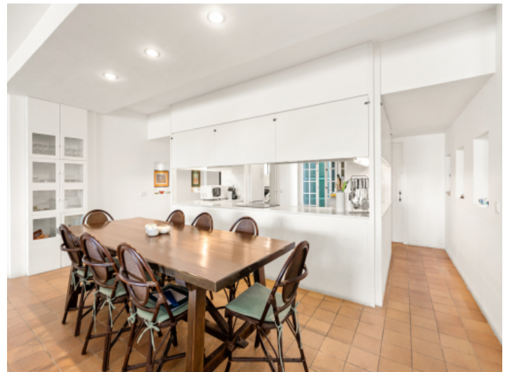
Essbereich und halb-offene Küche