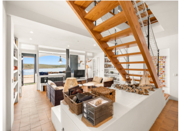
Herrlicher Meerblick vom Wohnbereich aus