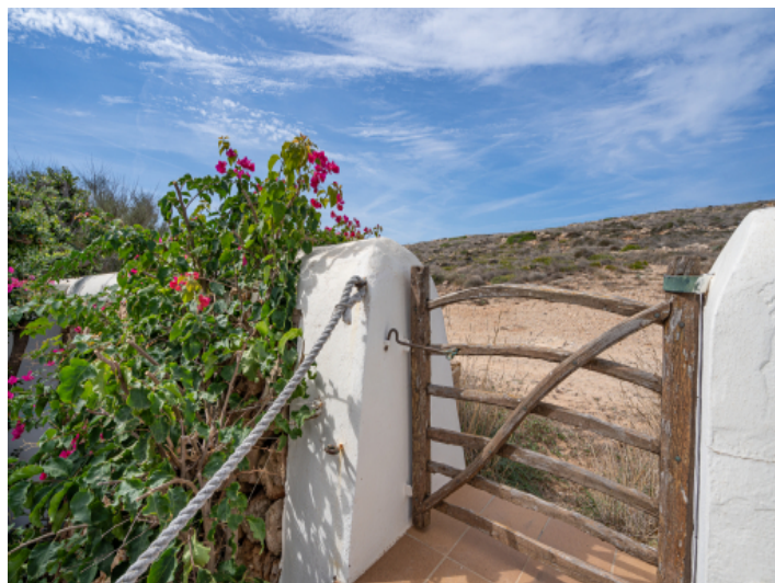
Zugang zum Cami de Cavalls