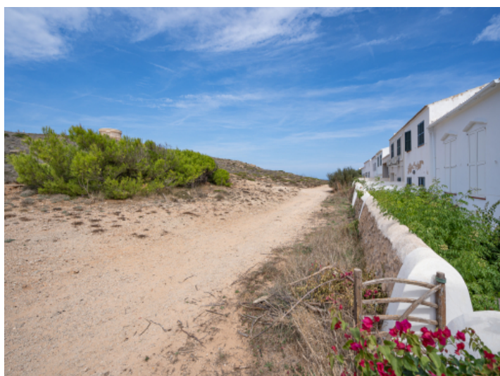
Rückseite des Hauses