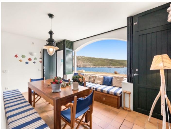
Bezaubernde Innen-Veranda mit Meerblick