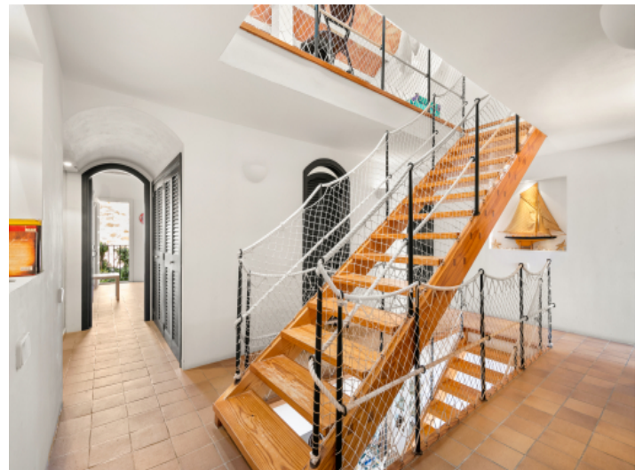
Treppe zur obersten Etage