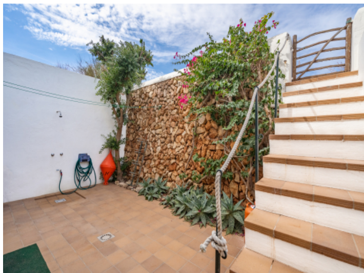
Private Terrasse auf der Rückseite