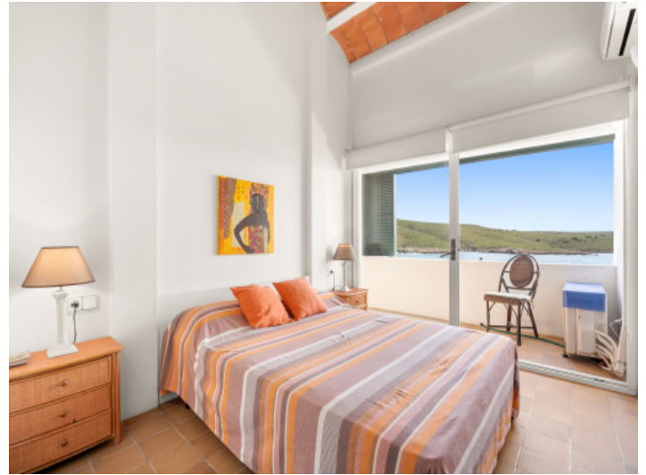
Eines von 4 Schlafzimmern