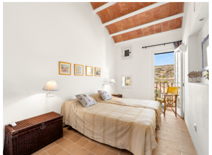
Doppelschlafzimmer mit Balkon