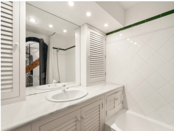
Eines von 2 Badezimmern