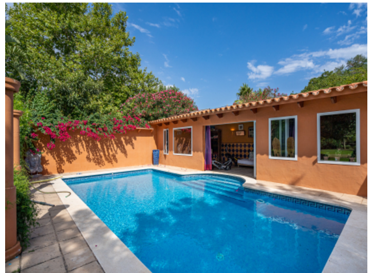
Pool in absoluter Privatsphäre