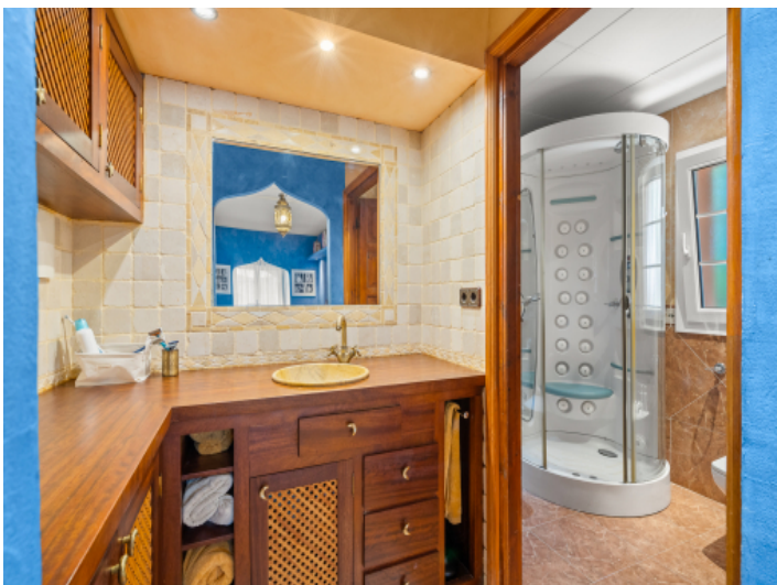
Eines von 4 Badezimmern