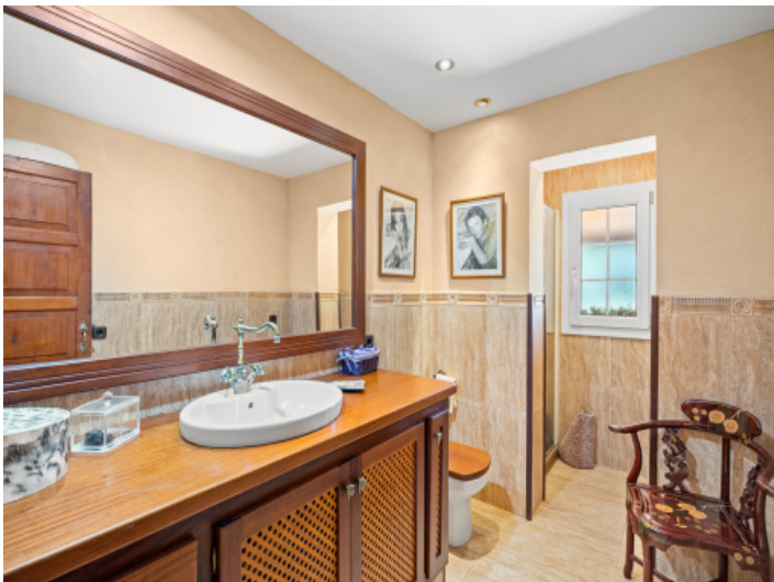
Eines von 4 Badezimmern