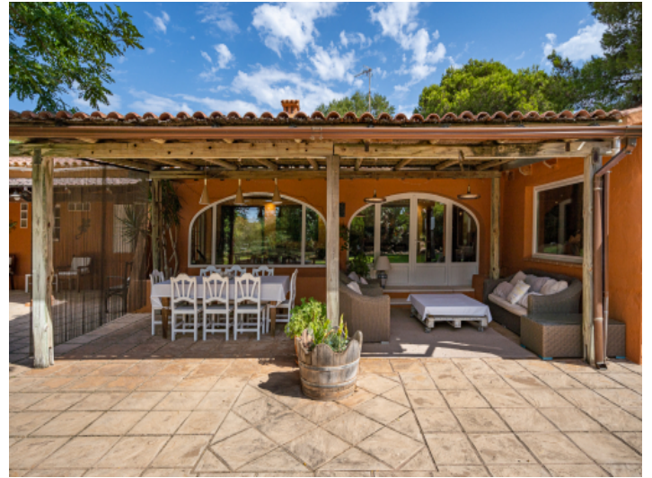
Überdachter Essbereich im Freien