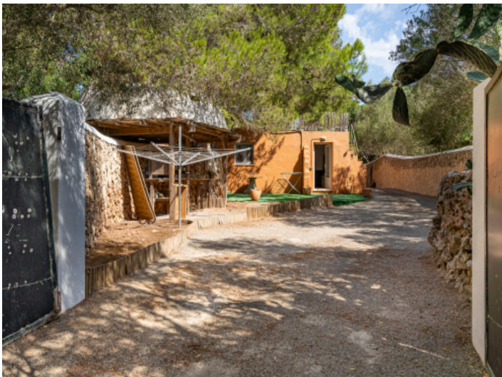
Weg zum Gästeapartment