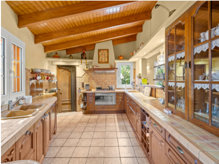
Geräumige Küche im Landhausstil