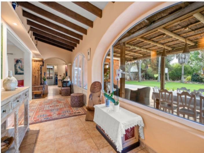
Großer Fensterfront mit Terrassenzugang