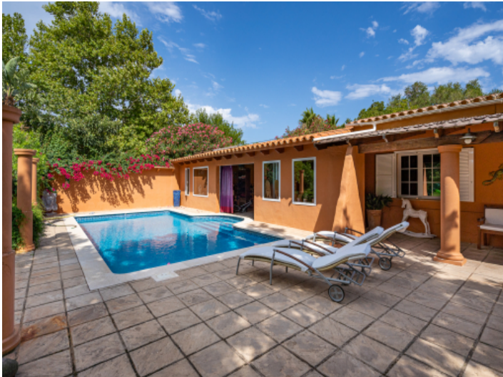
Herrlicher Pool- und Terrassenbereich