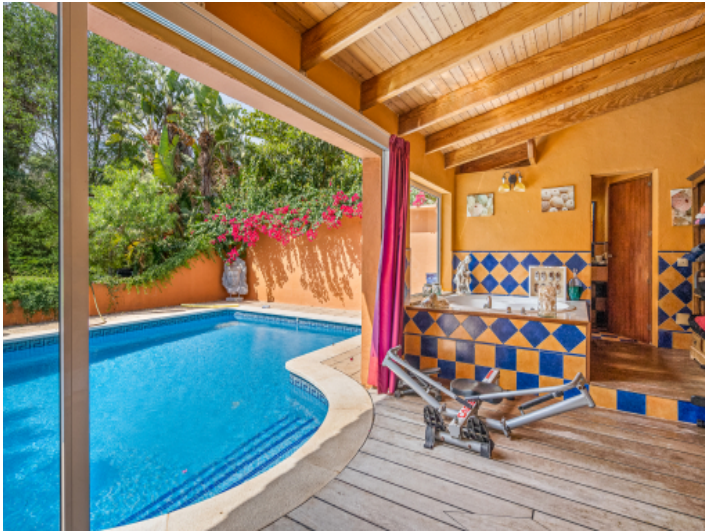
Überdachte Terrasse mit Jacuzzi