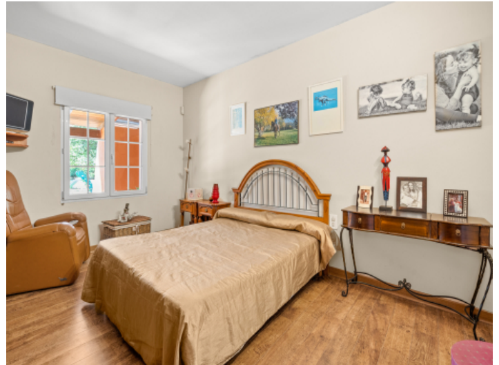
Eines von 5 Schlafzimmern