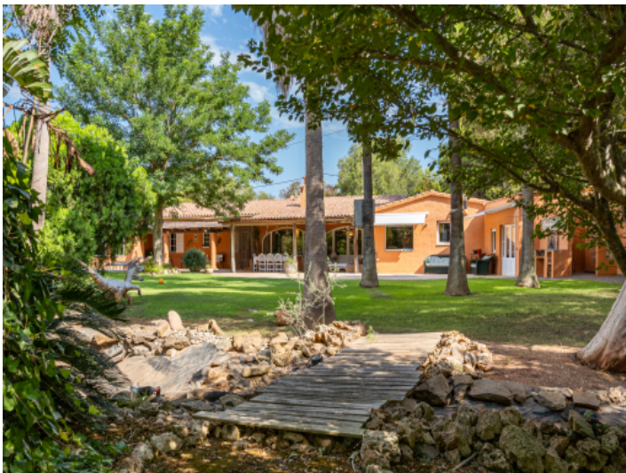
Finca mit herrlichen Garten