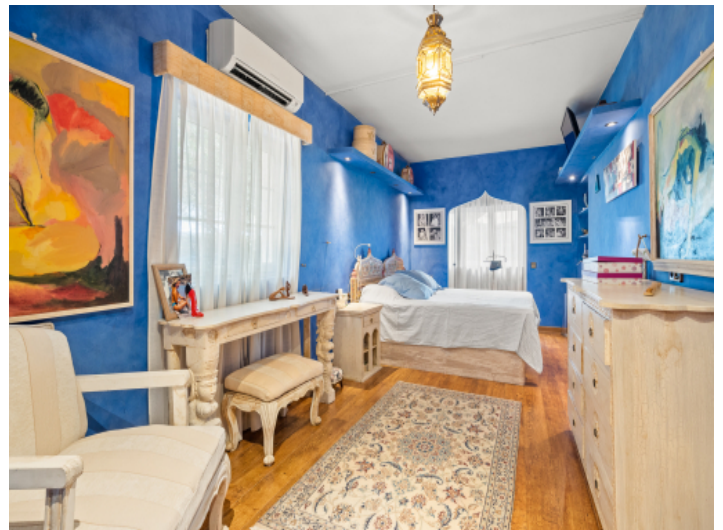
Eines von 5 Schlafzimmern