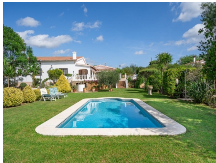
Sehr gepflegter Pool- und Gartenbereich