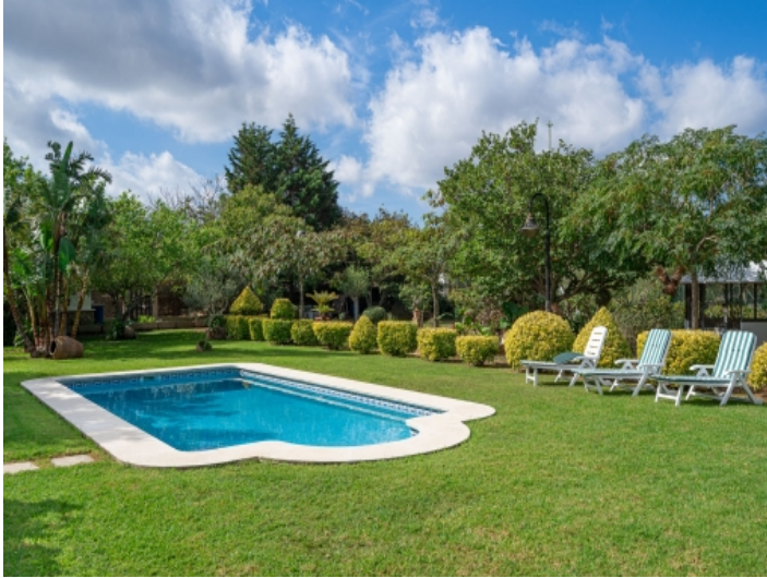
Entspannter Pool- und Gartenbereich