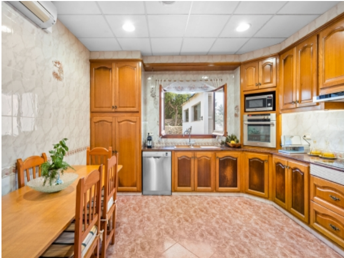
Rustikale Küche mit viel Platz