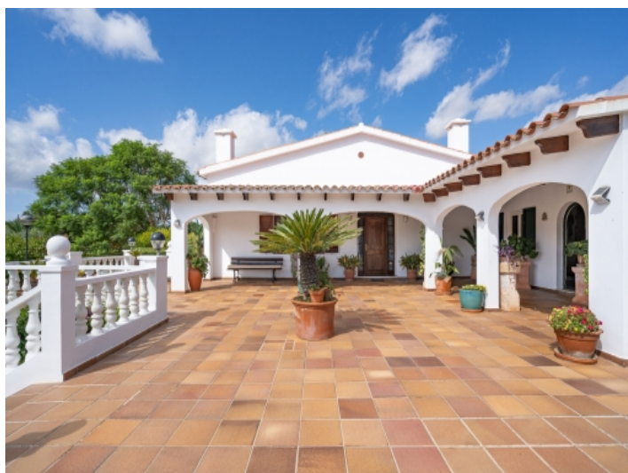
Terrasse mit teilweise überdachten Bereichen