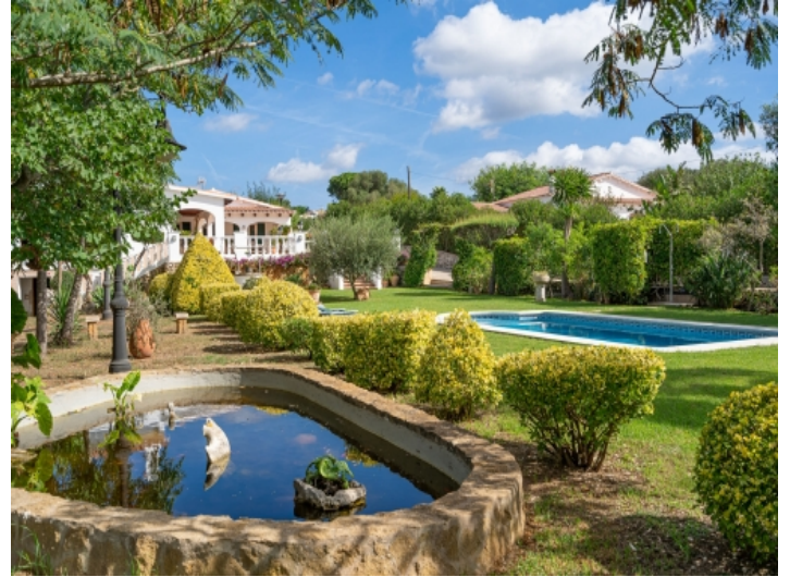
Herrlicher Garten mit Teich und Vegetation