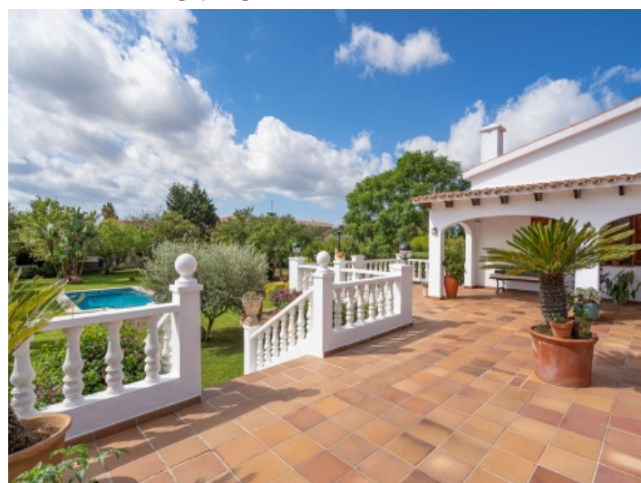
Große Terrasse mit Treppe zum Garten