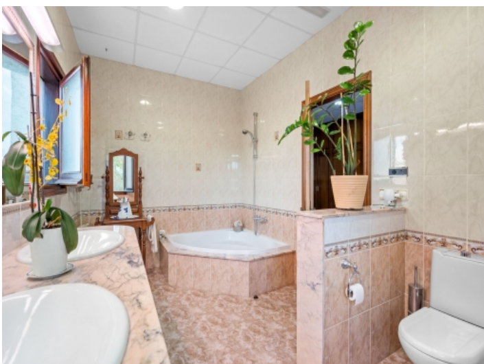
Zweites Badezimmer mit Wanne