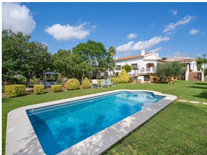
Schön angelegter Poolbereich