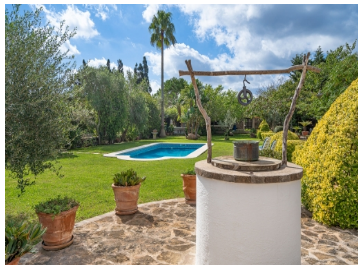
Eigener Brunnen im Garten