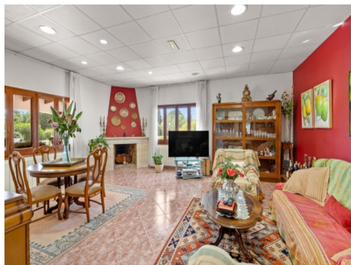
Wohn- und Essbereich mit Kamin