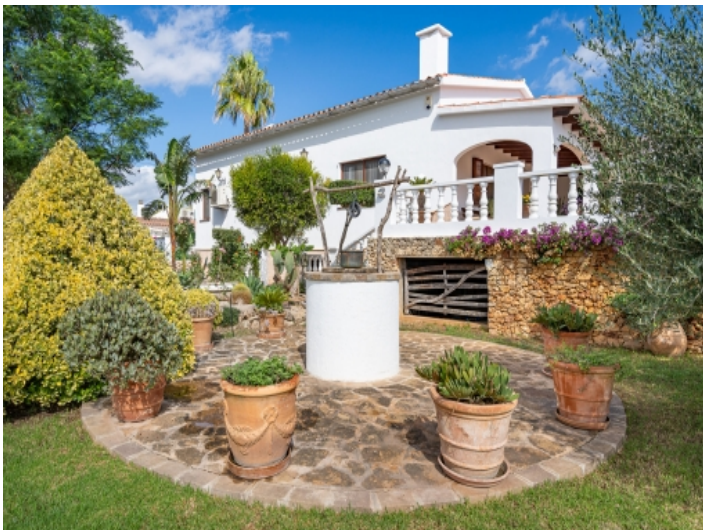
Charmantes, typisch menorquinisches Anwesen