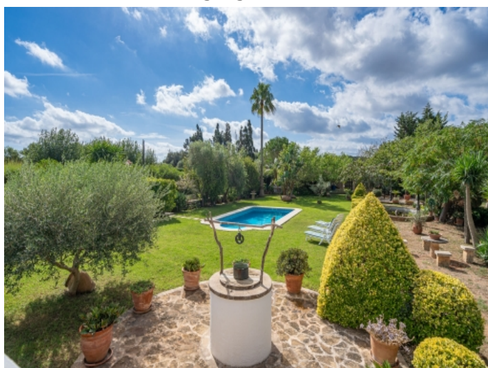
Blick über das herrliche Grundstück