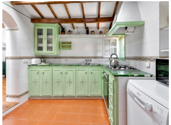
Voll ausgestattete, rustikale Küche