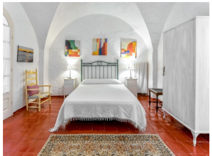
Hauptschlafzimmer in weiß