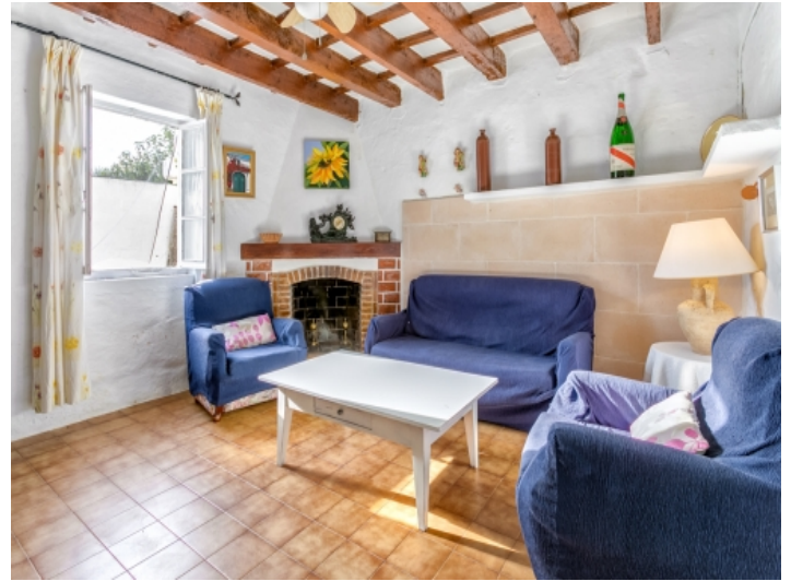
Gemütlicher Wohnbereich mit Kamin