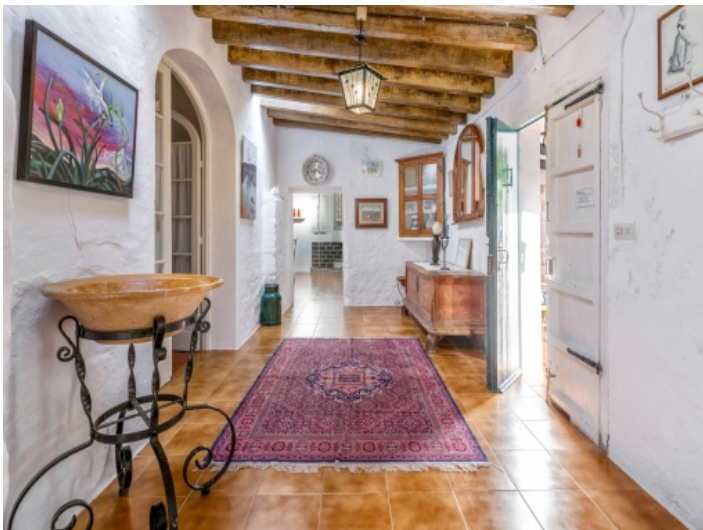
Heller Eingangsbereich der Finca