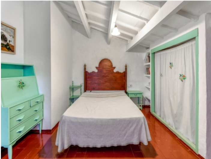
Zweites Schlafzimmer mit Einbauschränk