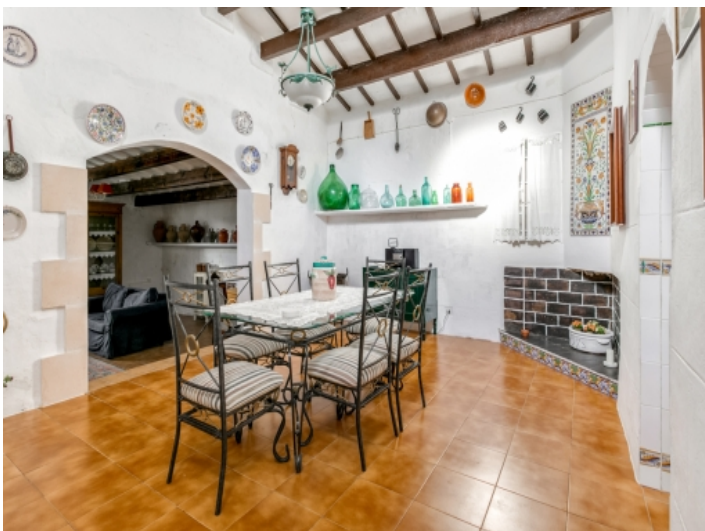
Essbereich der Finca