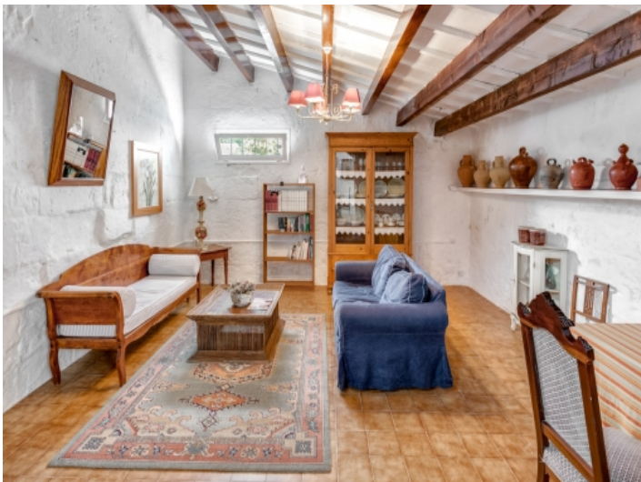
Alternative Ansicht des Wohnbereichs