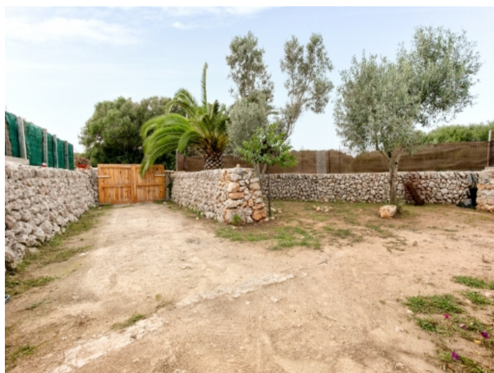
Großer Garten und Eingang der Finca