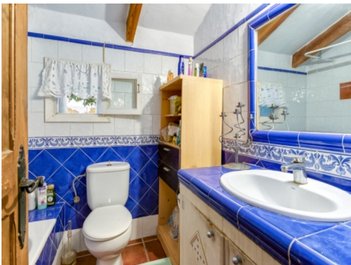
Badezimmer des Gästehauses