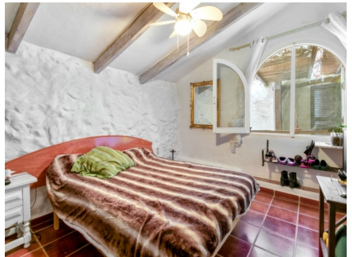
Schlafzimmer des Gästehauses