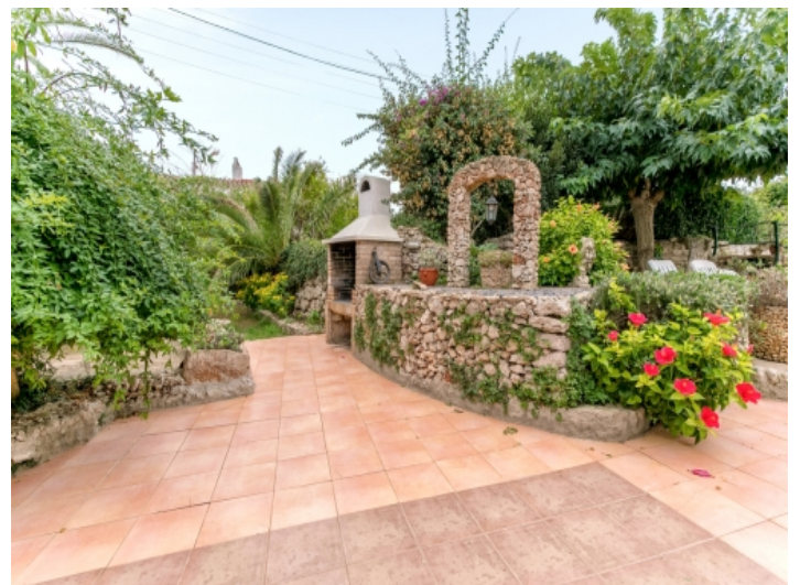
Gut gepflegter Garten