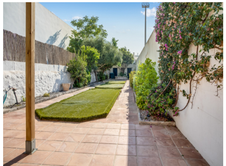
Der lange Garten bietet Privatsphäre