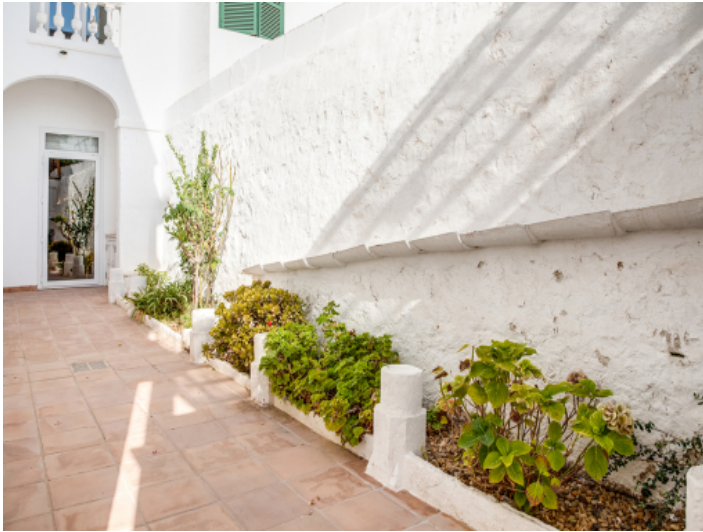
Zugang zum Stadthaus