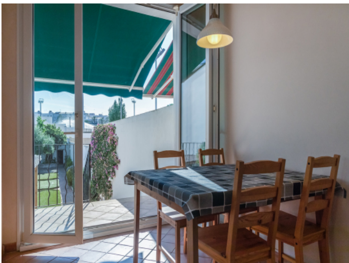
Weiterer Essbereich mit direkten Zugang zum Garten