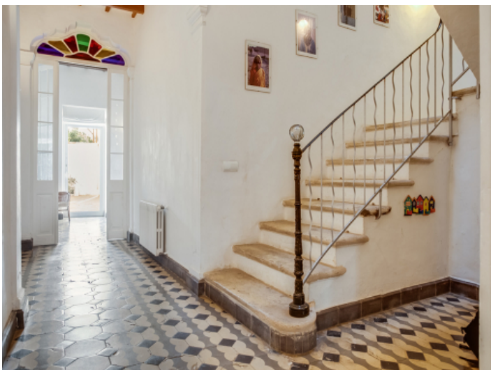
Die bunt gefliesten Böden geben dem Haus einen speziellen Charm