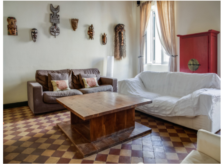
Großzügiger Wohnbereich mit Heizung