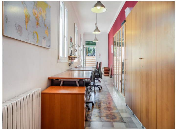
Langes Arbeitszimmer mit Terrassenzugang