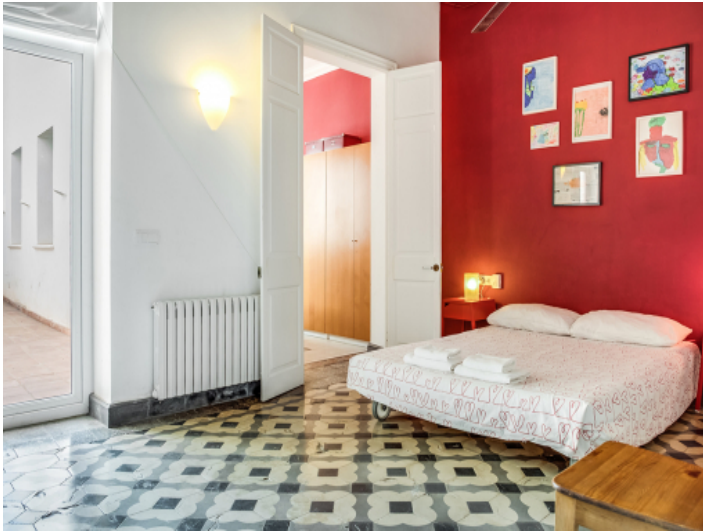
Eines von 5 charmanten Schlafzimmern