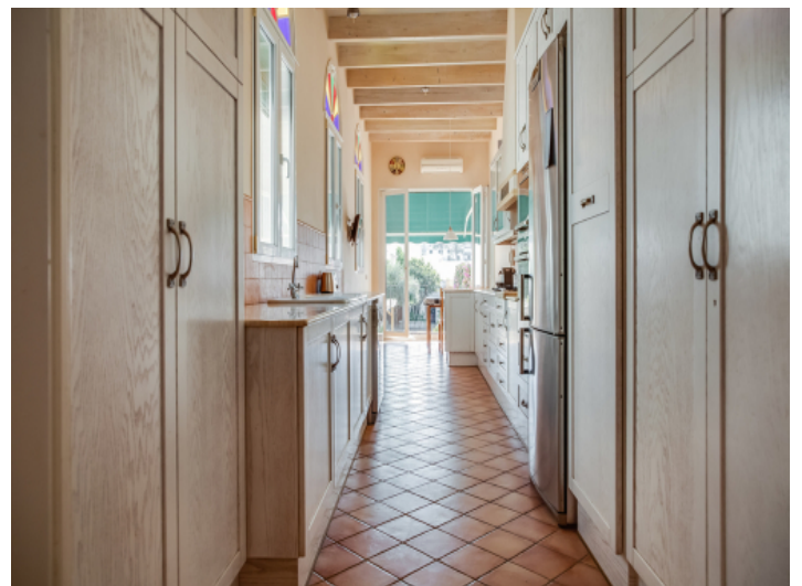
Lichtdurchflutete Küche mit Terrassenzugang