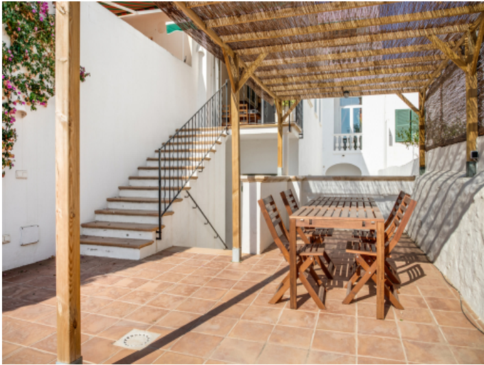
Sonnige Terrasse mit Essbereich