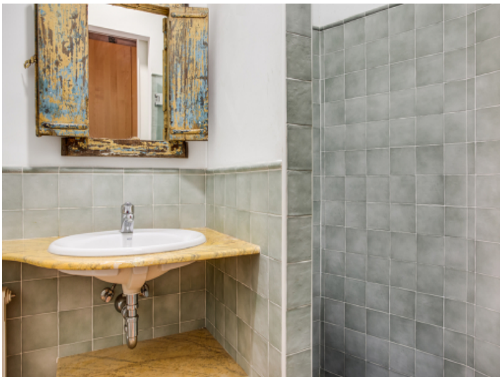
Eines von 4 einzigartigen Badezimmern