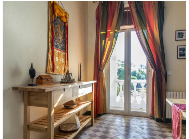
Der Essbereich bietet Zugang zum Außenbereich