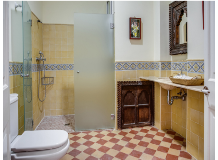
Badezimmer im authentischen Stil