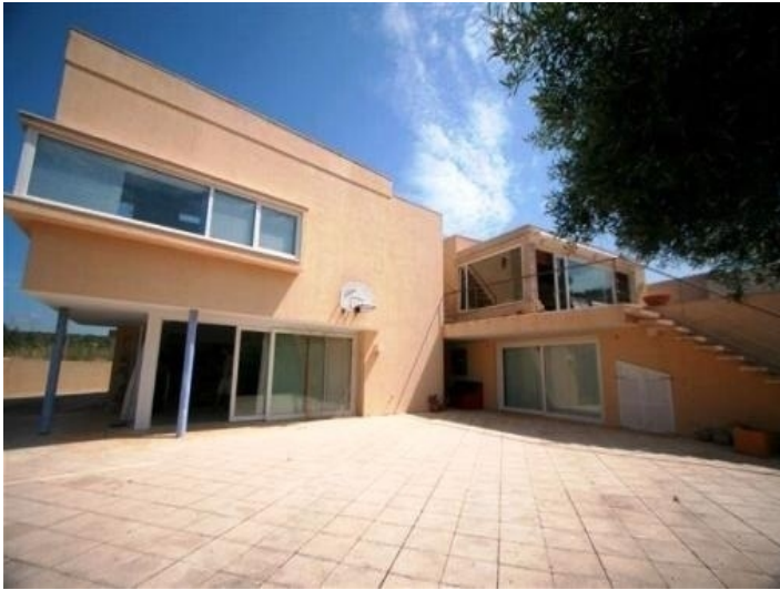
Seitenansicht vom Patio