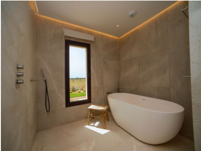
Luxuriöses Masterbad mit Naturstein und stilvoller