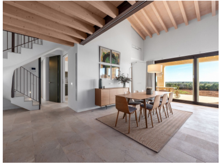
In den Wohnbereich integrierter Essbereich