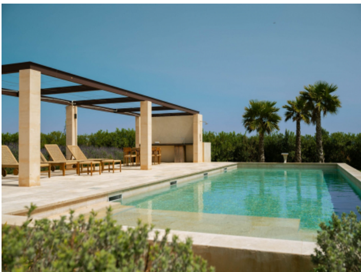
Exklusiver Salzwasserpool in stilvollem Ambiente