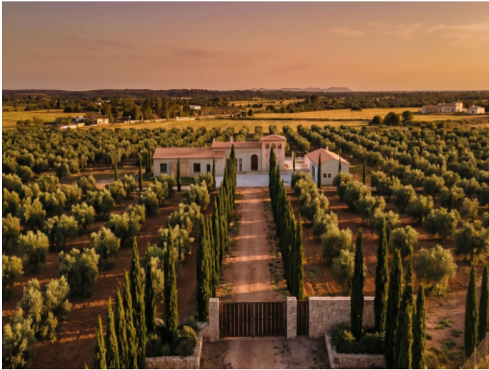
Repräsentative Zufahrt zum Anwesen