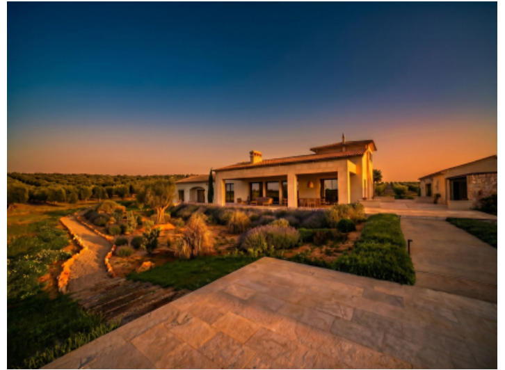
Terrasse im warmen Abendlicht