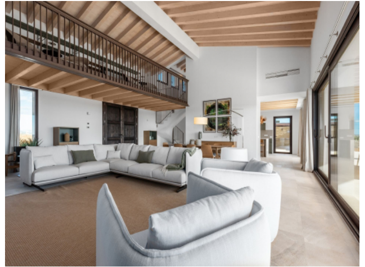
Lichtdurchfluteter Wohnbereich mit Galerie