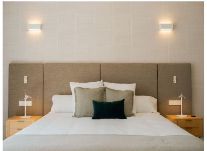
Elegante Master-Suite mit Zugang zur Terrasse