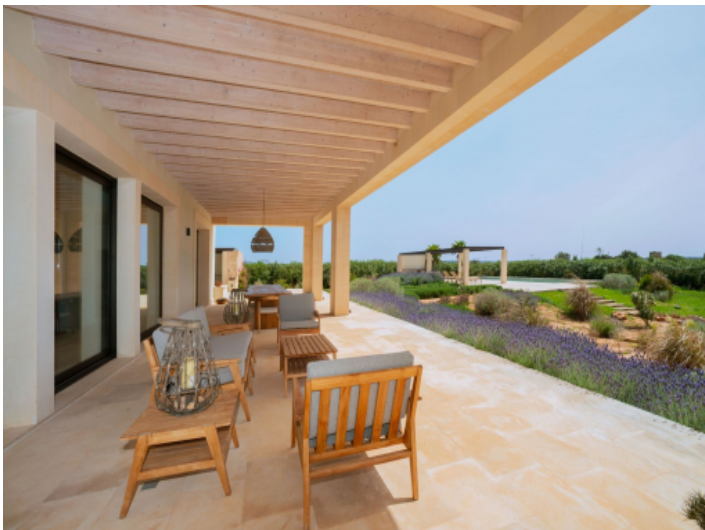
Terrasse mit Blick über den mediterranen Garten und Pool