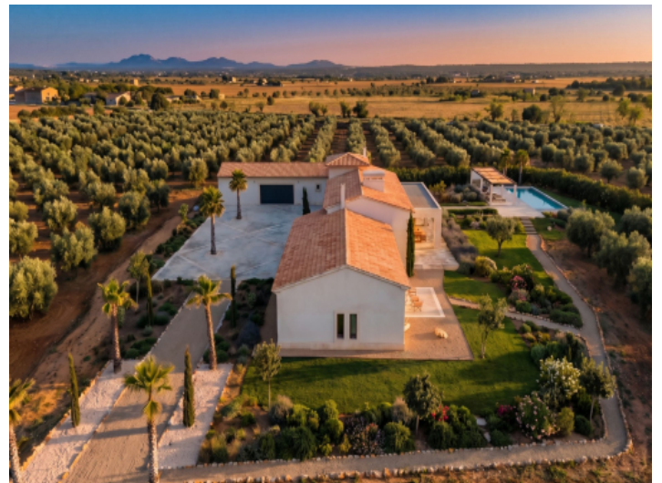
Luftaufnahme mit Blick auf Haupthaus, Pool und weitläufige