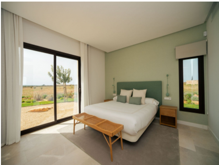
Drei komfortable Gästeschlafzimmer mit elegantem Ambiente