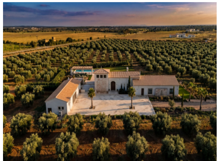
Anwesen mit mediterranem Garten aus der Vogelperspektive