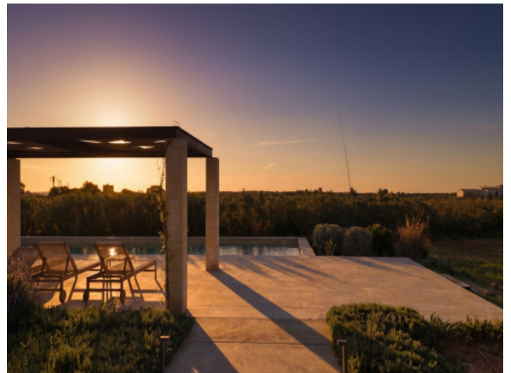
Zugang zur exklusiven, ruhig gelegenen Poolterrasse