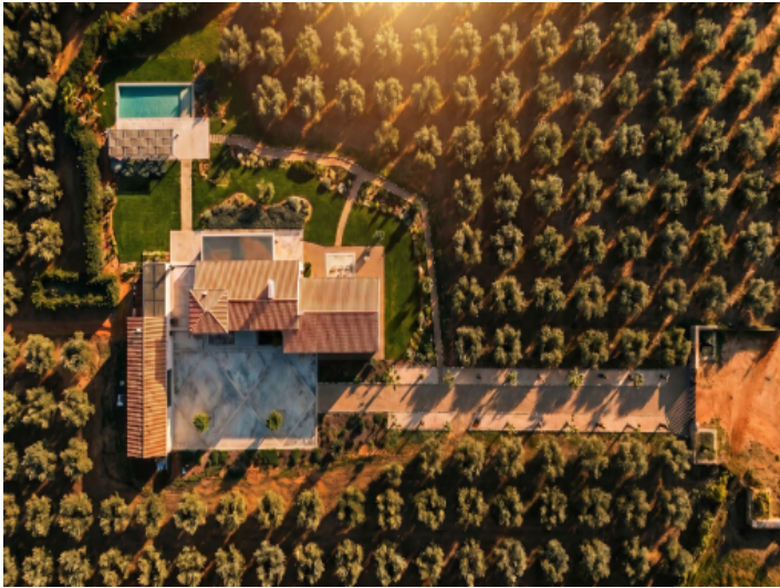
Vogelperspektive auf das das Anwesen