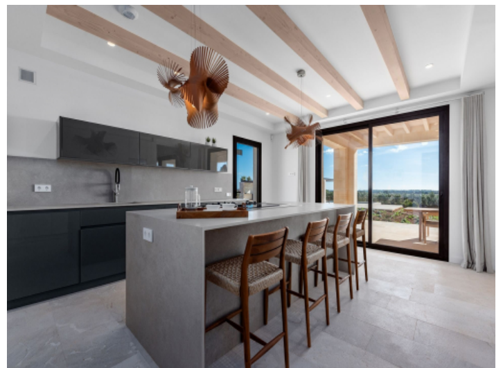
Hochwertige Designerküche mit Gaggenau-Geräten