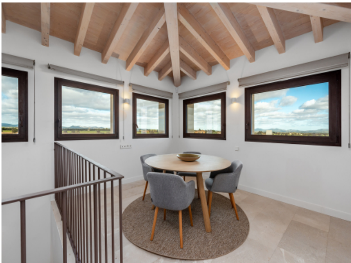
Turmzimmer mit unverbaubarem Weitblick