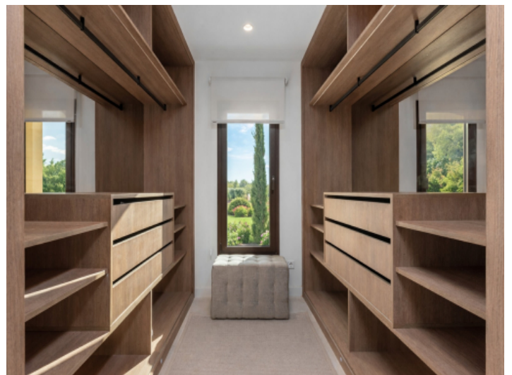
Ankleide mit großzügigem Raumkonzept