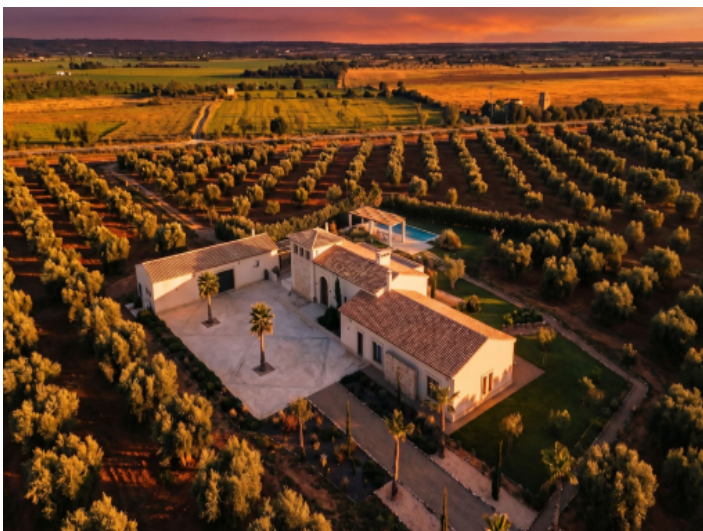
Sonnenuntergang über dem Anwesen mit Pool und Olivenhain