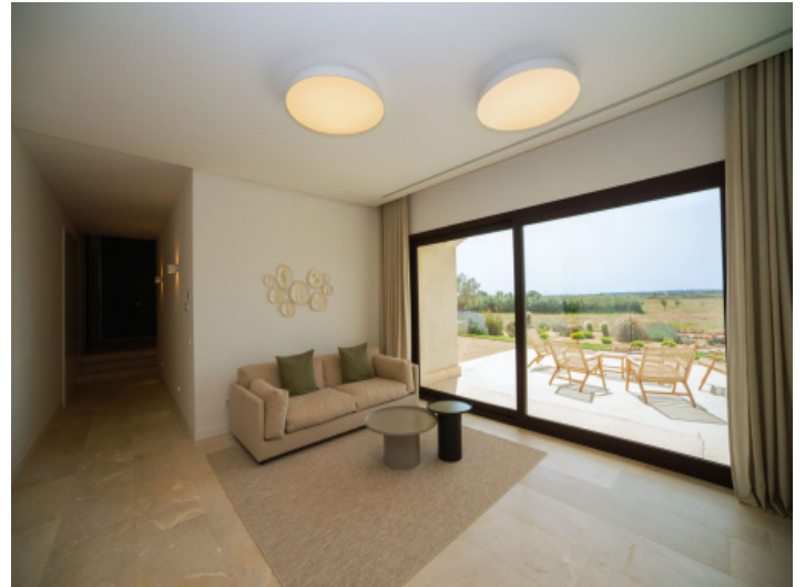
Gemütliche Lounge im Gästebereich mit Terrassenzugang