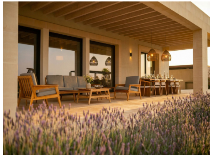
Großzügige Terrasse mit Lavendelbeet und mediterranem