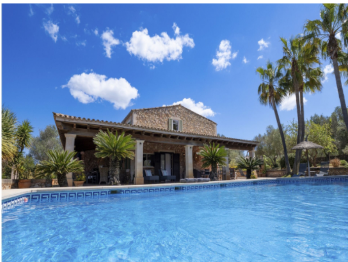
Finca mit großem Pool