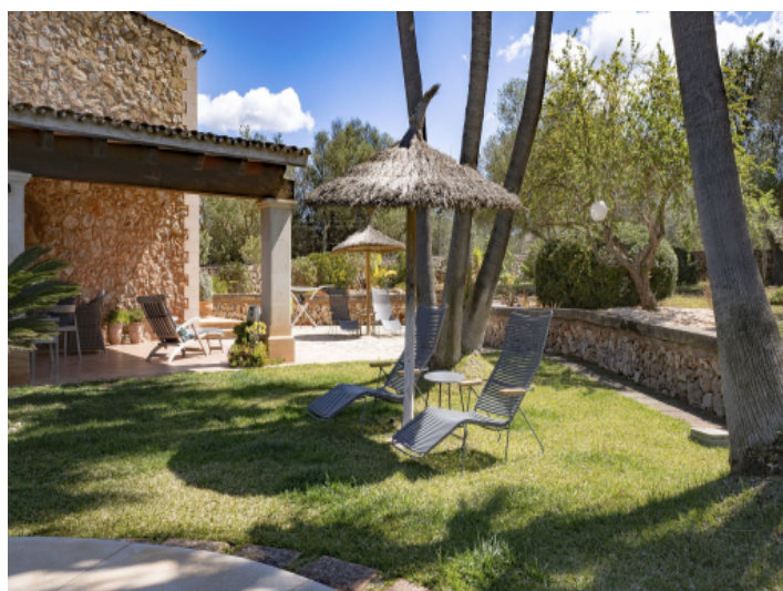
Sonnenliege am Pool