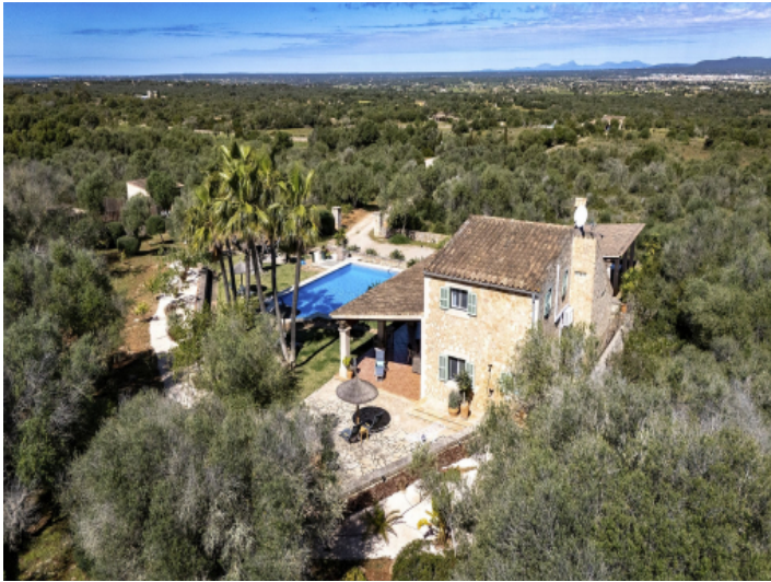
Ruhige Finca mit Weitblick