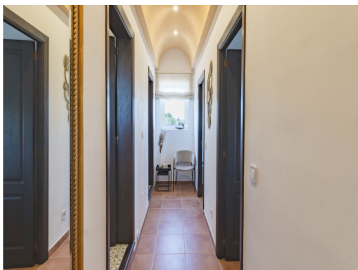
Flur zu den Schlafzimmern