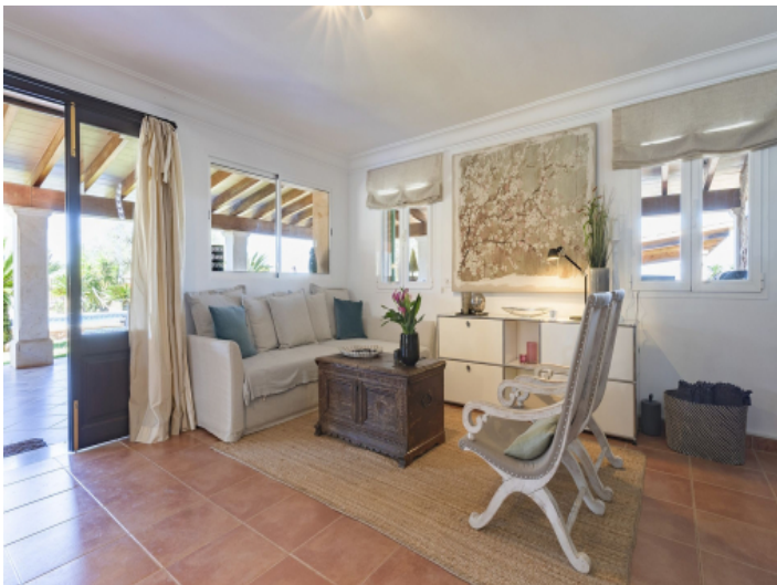
Wohnbereich mit Ausgang zur Terrasse