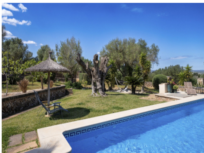
Schöner gepflegter Garten