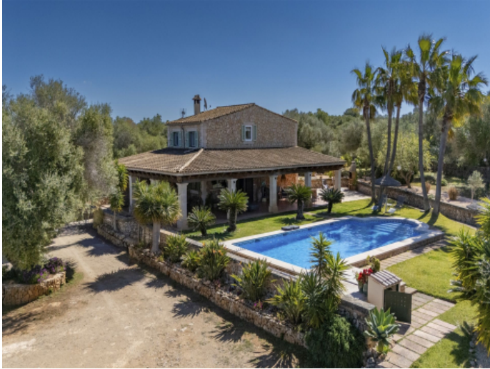
Finca in ruhiger Lage