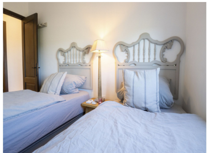
Eins von vier Schlafzimmer