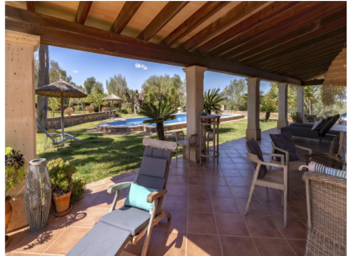
GrÖÙe Überdachung und ein sehr schöner Garten