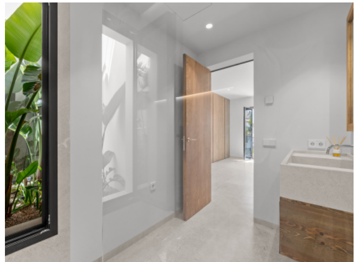
Badezimmer mit Lichtschacht