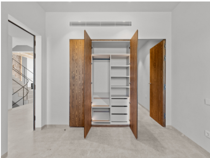
Schlafzimmer mit Einbauschränk