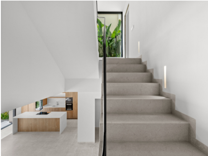
Treppe ins Obergeschoß