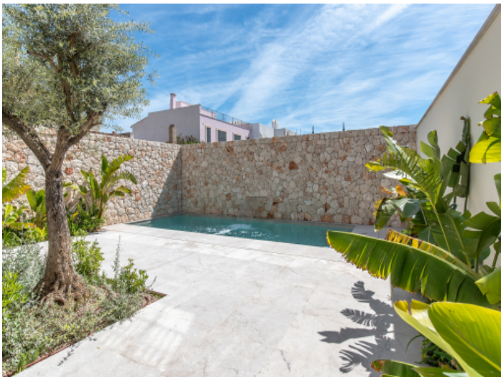
Innenhof mit Pool und Wasserfall