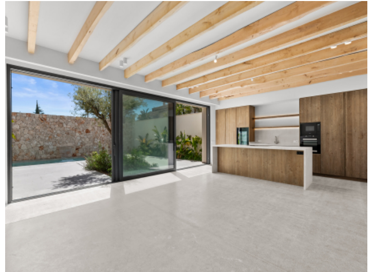
Großzügiges und offenes Wohndesign