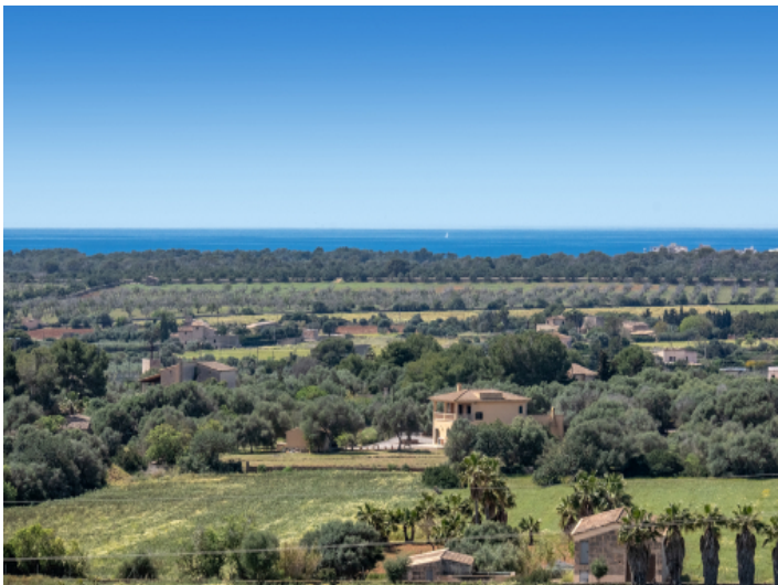
Meerblick von der Dachterrasse