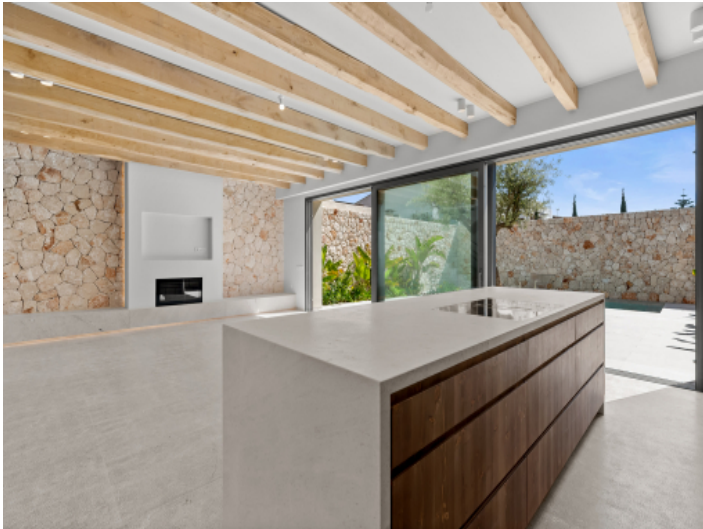
Kücheninsel im offenen Wohn und Essbereich