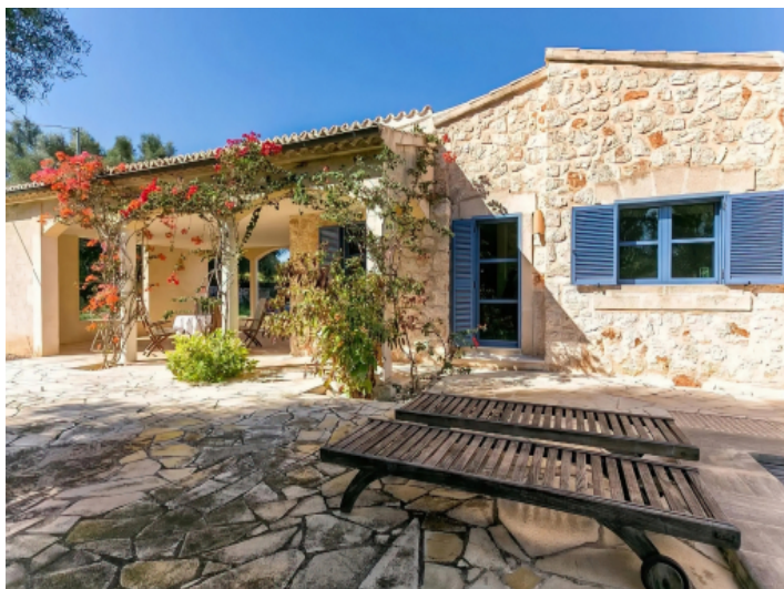
Blick vom Pooldeck auf das Haus