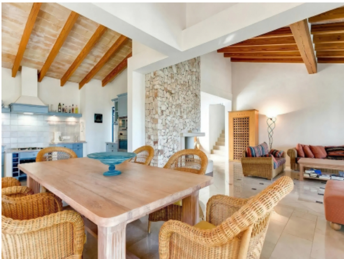
Ess- und Wohnbereich