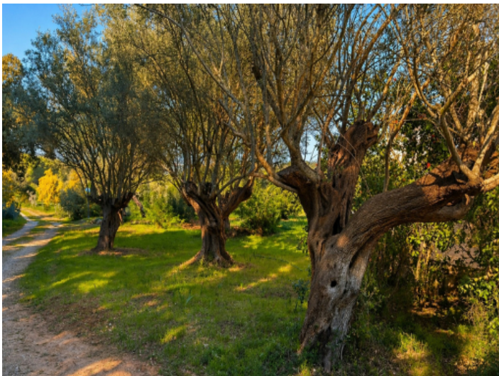
Zufahrt mit Olivenbäumen