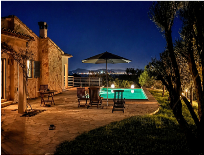
Pool bei Nacht