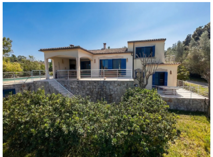
Ansicht des Hauses vom Garten