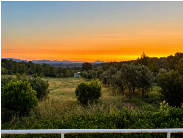
Sonnenuntergang im Westen