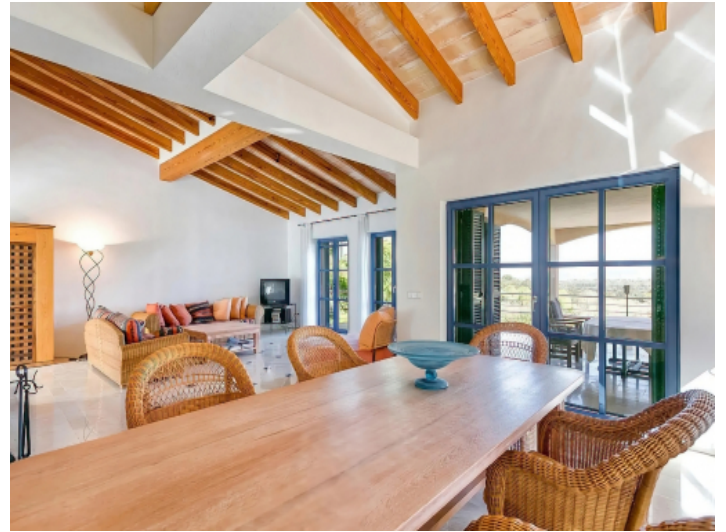
Essbereich mit Zugang auf die überdachte Terrasse