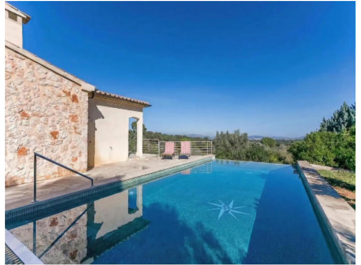
Swimmingpool mit Blick über Muro bis nach Alcúdia