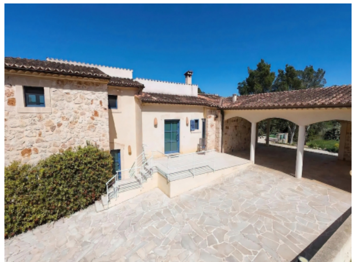
Eingangsbereich und Stellplätze