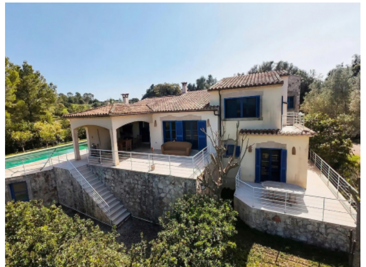
Totalansicht der Finca