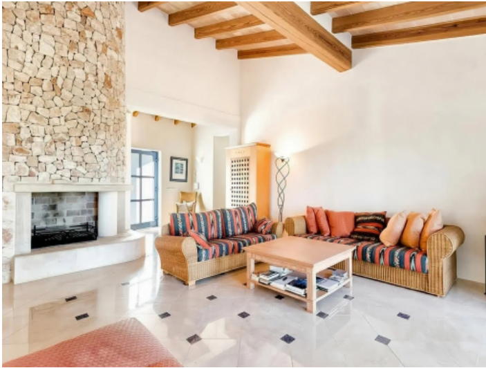
Rustikal modern ist das Wohnzimmer