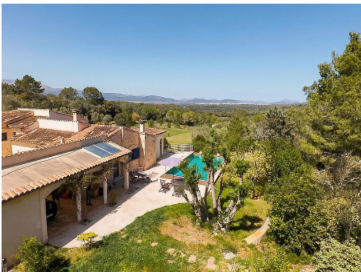
Toller Blick von der Poolebene aus