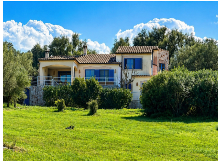
Ansicht des Hauses vom unteren Teil des Grundstücks