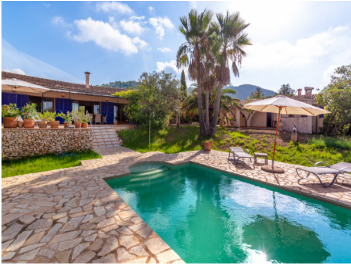
Blick zur Finca und dem Gästehaus