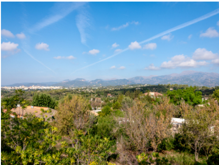
Panoramablick über die Landschaft