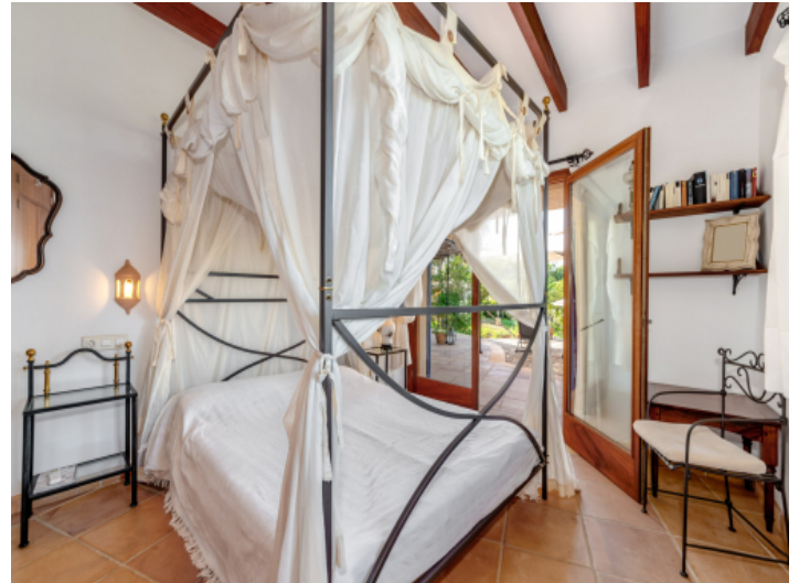
Schlafzimmer mit Terrassenzugang