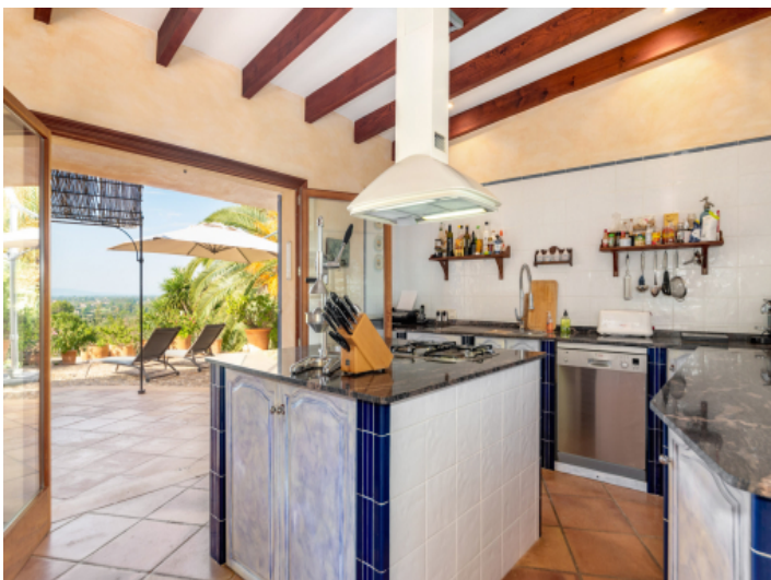
Küche mit Terrassenzugang