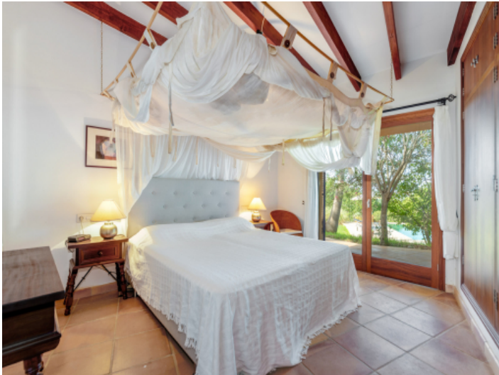
Eines von insgesamt 4 Schlafzimmern