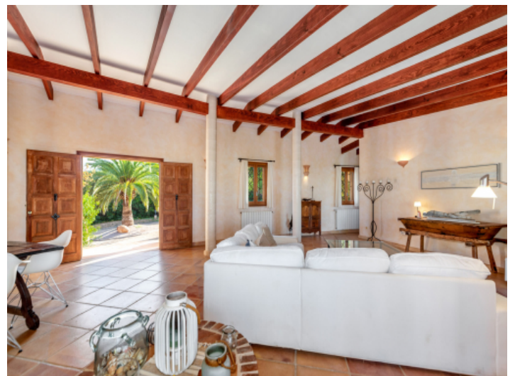
Blick zur Eingangstür