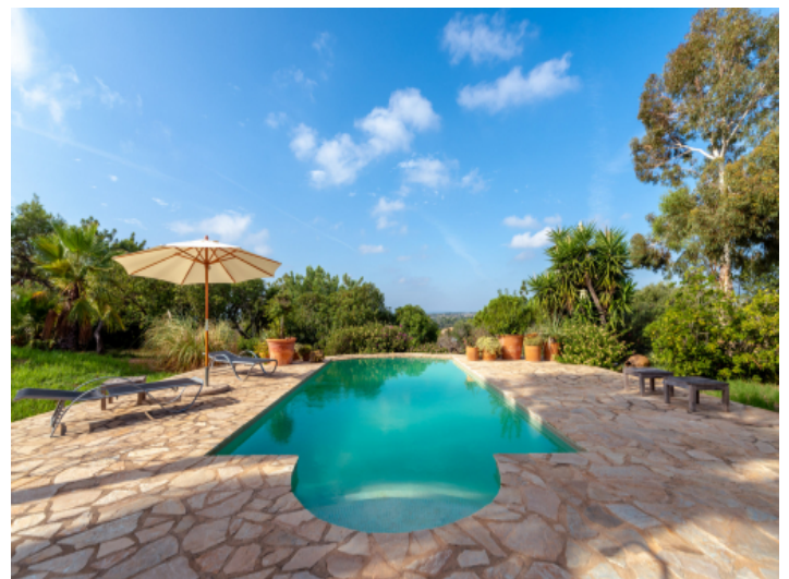
Schöner Pool mit Weitblick