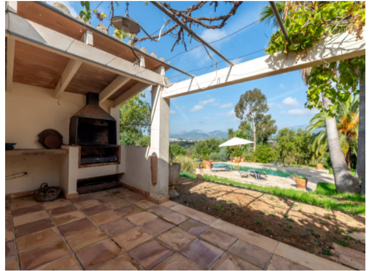
Grillterrasse neben dem Pool