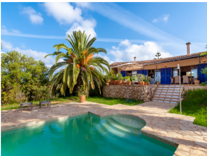
Poolbereich und Finca