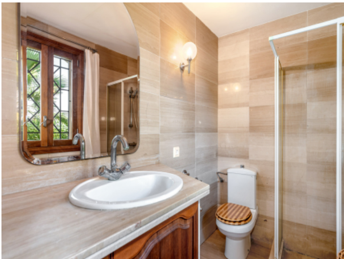
Eines von insgesamt 3 Badezimmern