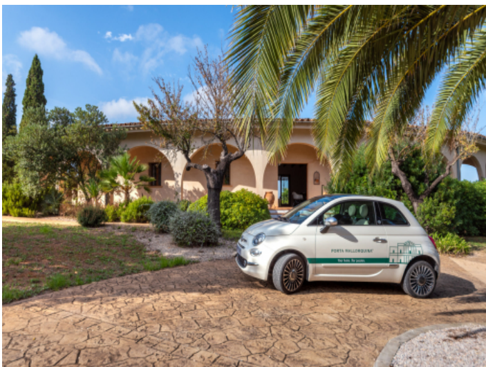
Frontansicht und Zufahrt