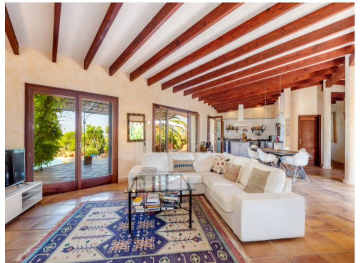
Offenes Wohnkonzept mit Holzbalkendecke