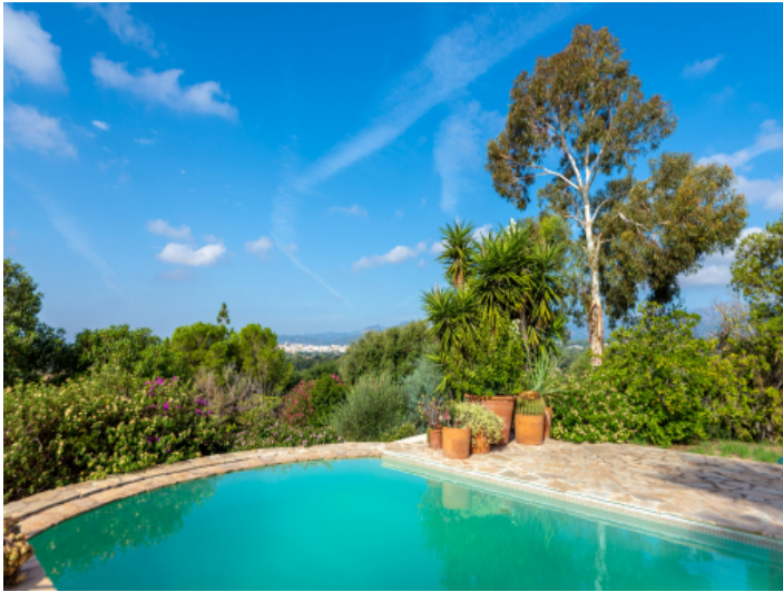
Pooloase in einem üppigen Garten