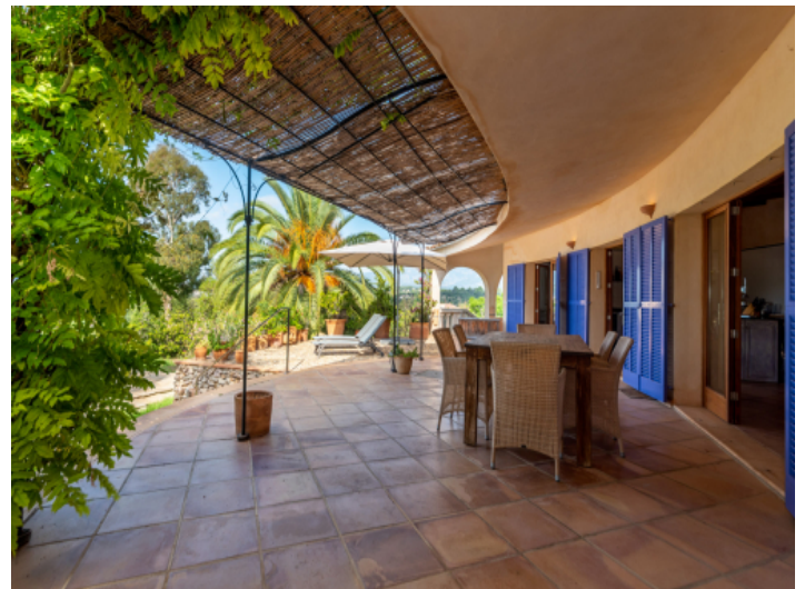
Große überdachte Terrasse