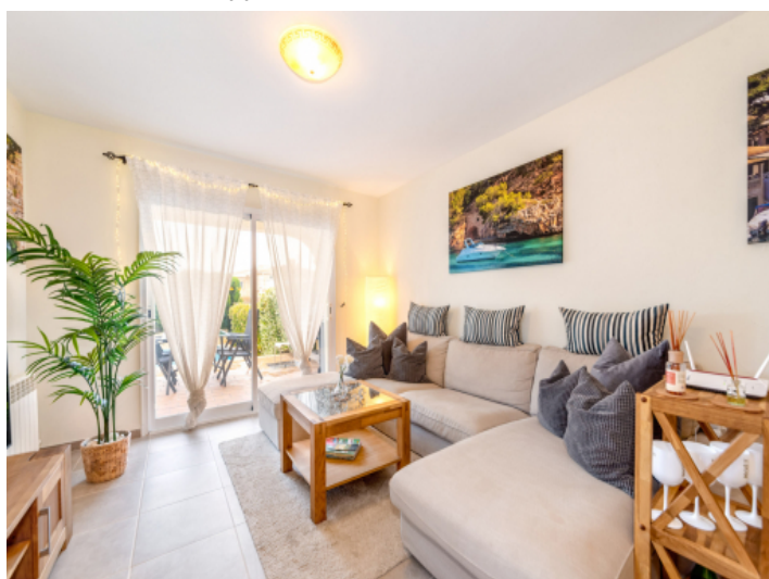
Gemütlicher Wohnbereich mit Terrassenzugang