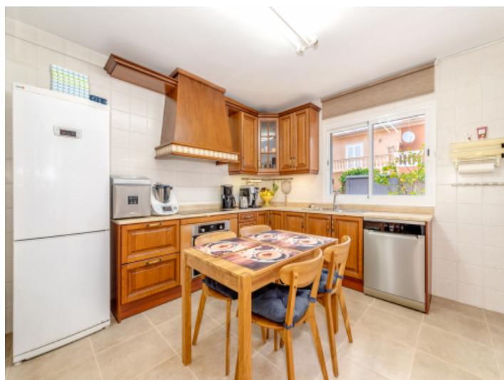
Küche im Landhausstil