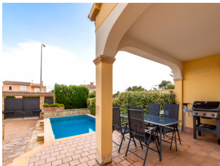
Überdachte Terrasse und Pool