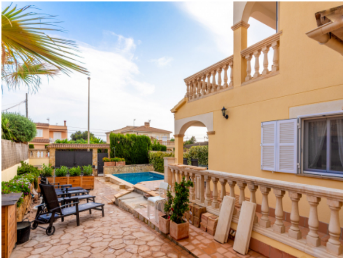
Terrace and pool area