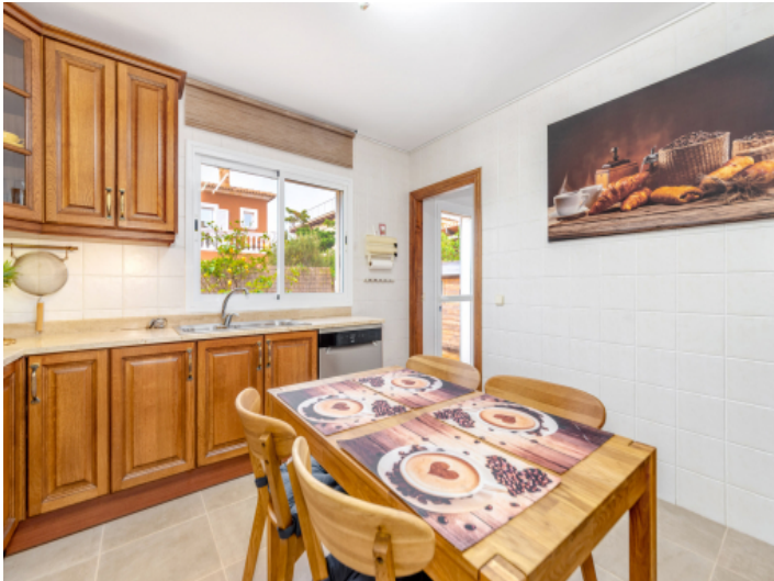
Heller Küche mit Zugang nach Außen