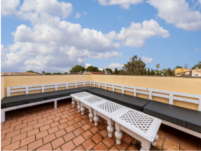
Terrasse mit Loungebereich