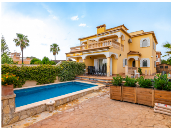
Schöne Doppelhaushälfte mit Pool in Bahia Azul