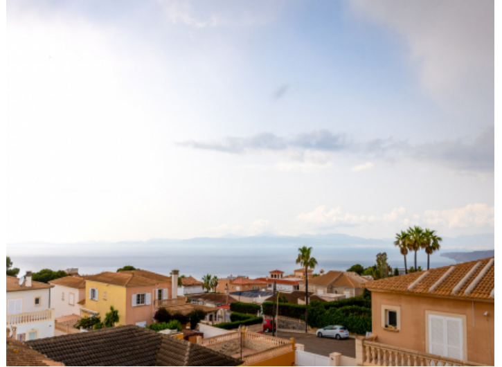
Schöner Blick aufs Meer