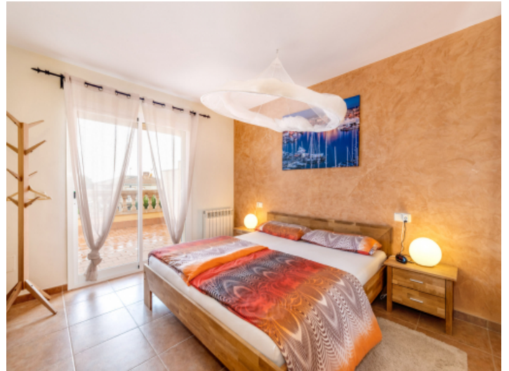
Schlafzimmer mit Terrasse