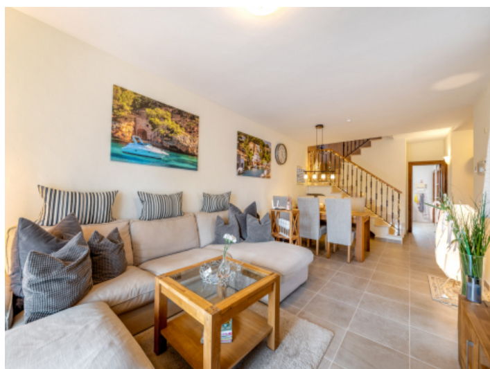
Offener Wohn-und Essbereich