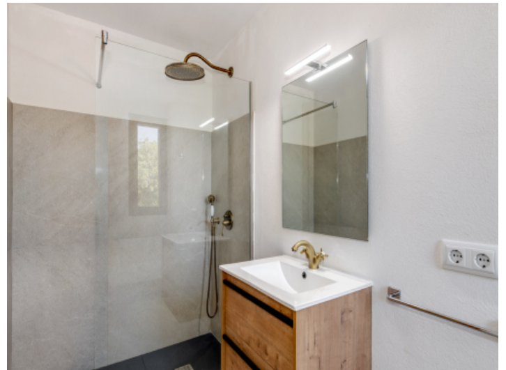
Eines der 6 modernen Badezimmer