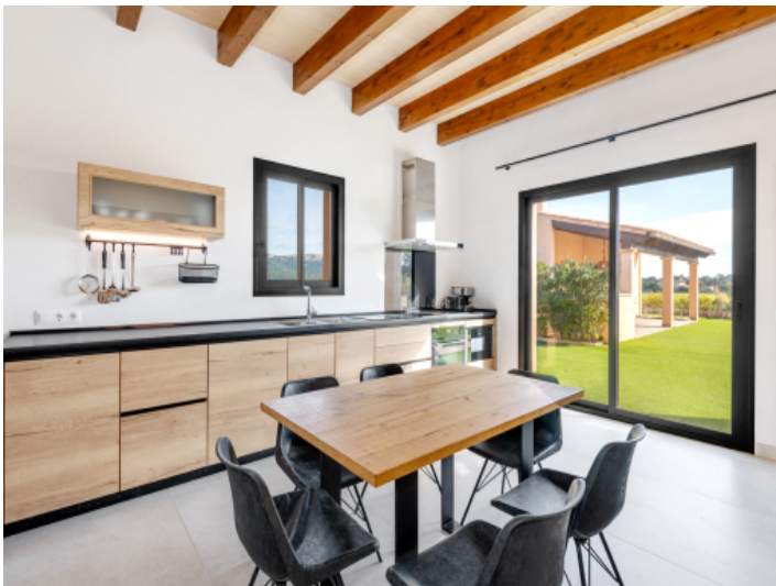
Küche mit Blick ins Grüne