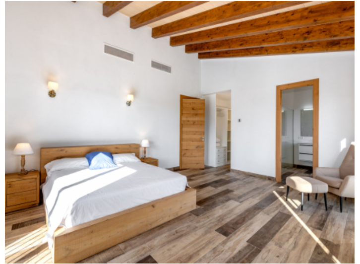
...und Badezimmer en Suite und begehbaren Kleiderschrank