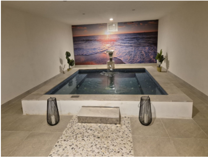
Spabereich im Untergeschoss