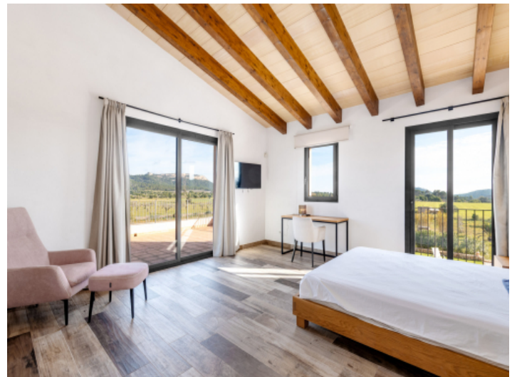
Eines der drei Schlafzimmer im Obergeschoss mit privater