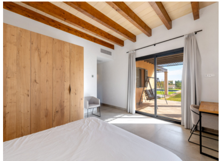
Zweites Schlafzimmer im Erdgeschoss