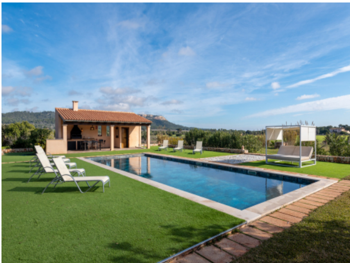
Weitblick und überdachte Barbecuebereich beim Pool