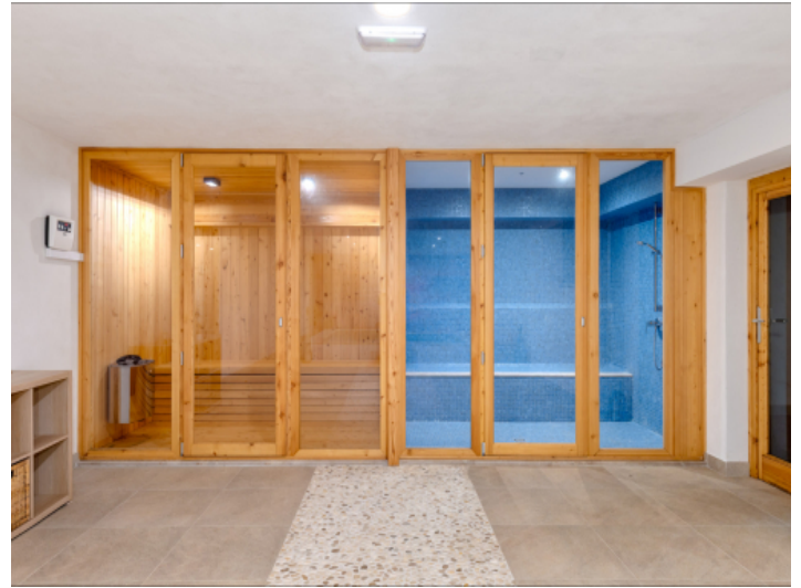
Spabereich im Untergeschoss