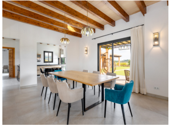
Helles offenes Wohnen