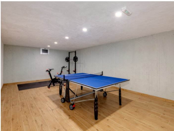
Fitnessraum und Tischtennistisch