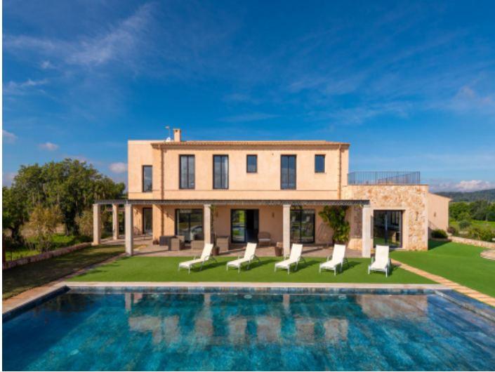
Finca in absolut ruhiger Lage