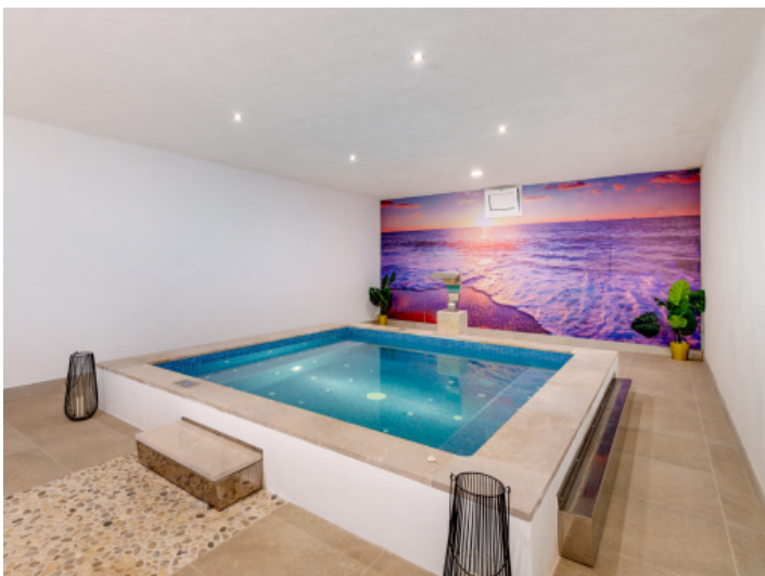
Spabereich im Untergeschoss