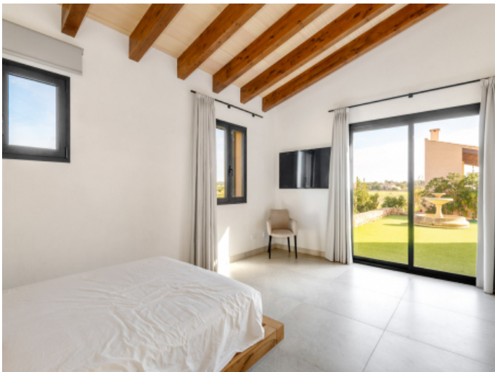
...und Zugang zur Terrasse