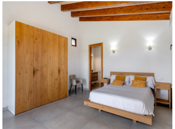
Eines der drei Schlafzimmer im Erdgeschoss mit Badezimmer