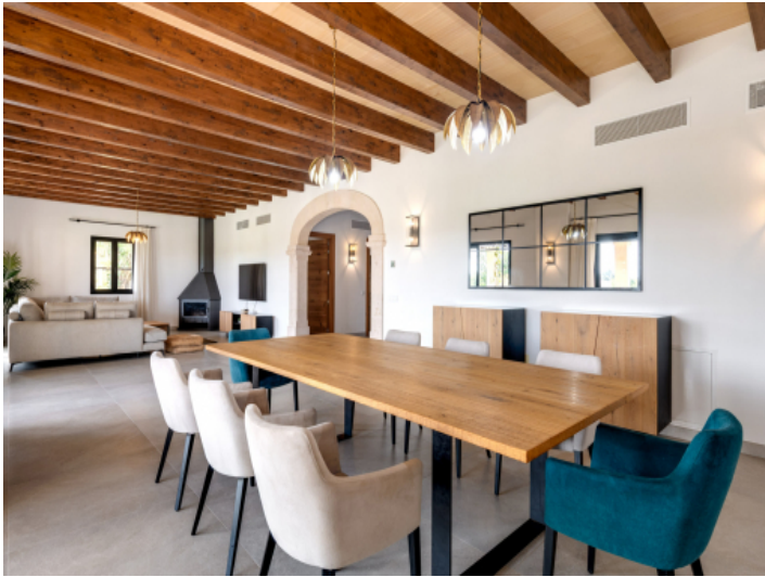
Geräumiger Wohn und Essbereich