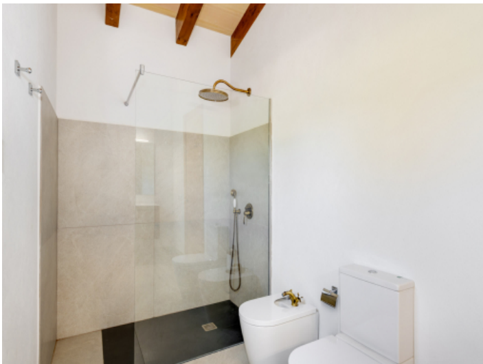
Eines der 6 modernen Badezimmer