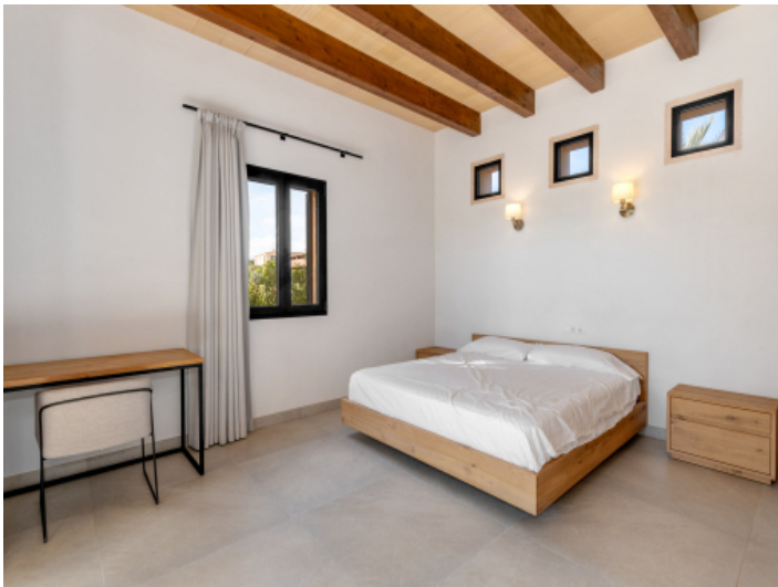
Zweites Schlafzimmer im Erdgeschoss