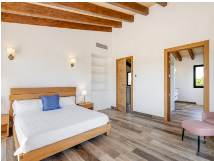
...und Badezimmer en Suite