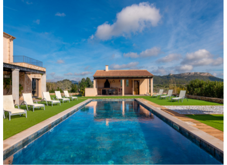
74qm grosser Pool