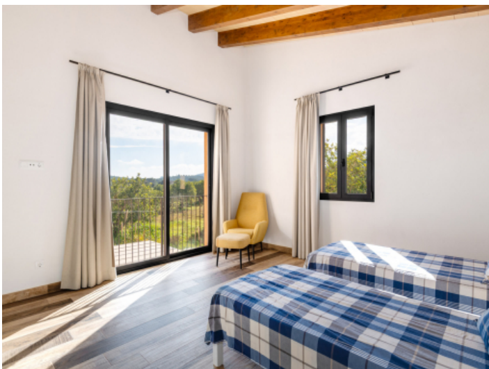
Drittes Schlafzimmer im Obergeschoss