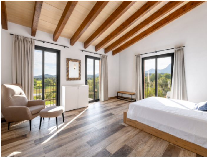
Weiteres Schlafzimmer im Obergeschoss mit Blick...