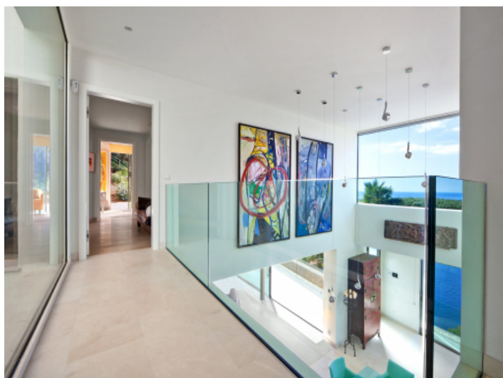
Elegante Galerie mit Panoramablick aufs Meer