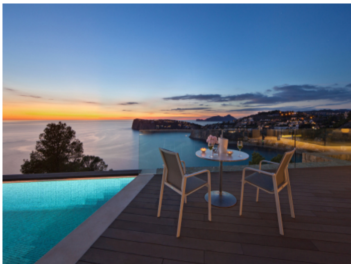
Beleuchteter Infinitypool in stimmungsvoller Abendatmosphäre