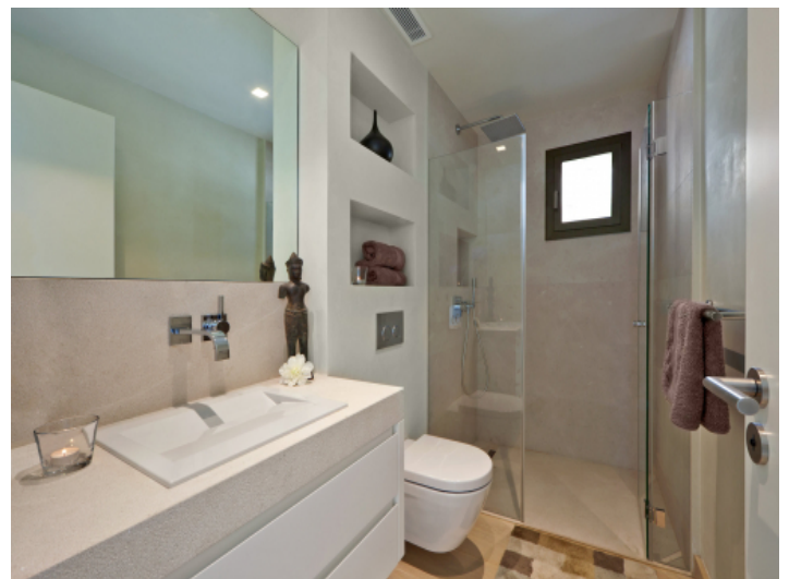
Eines der 3 Badezimmer