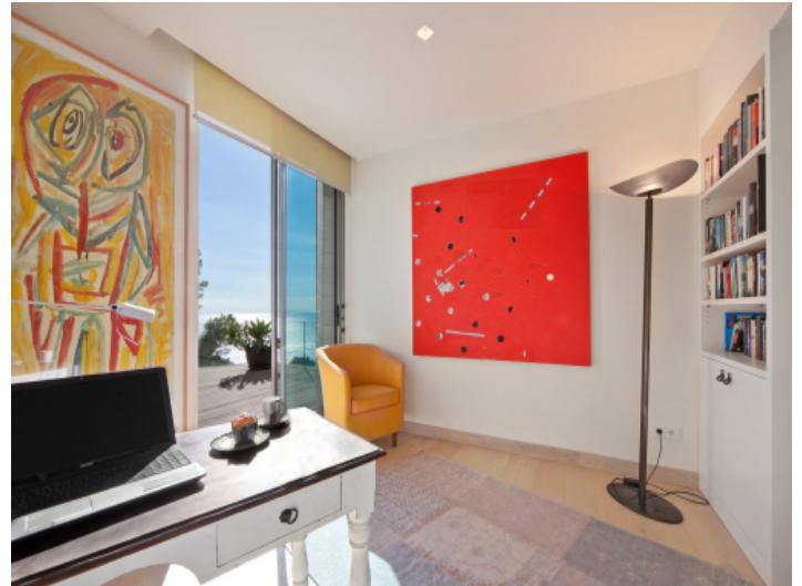
Separates Büro mit Zugang zur Meerblick-Terrasse