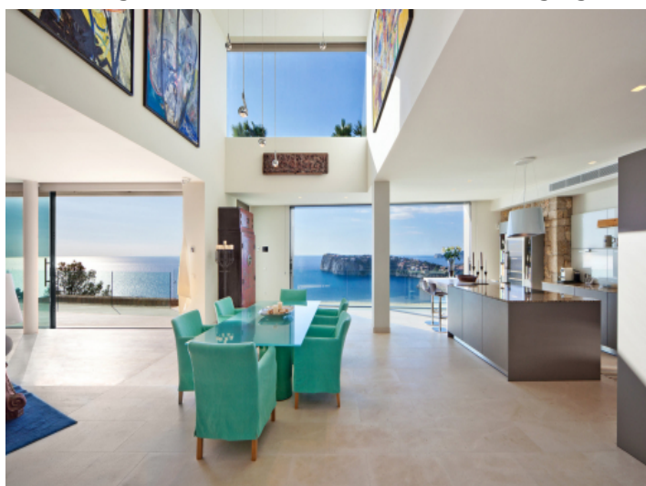
Offene Küche und Essbereich mit hohen Decken und