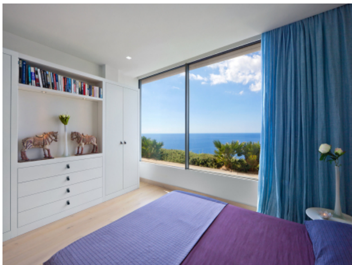
Eines der drei Schlafzimmer mit Meerblick