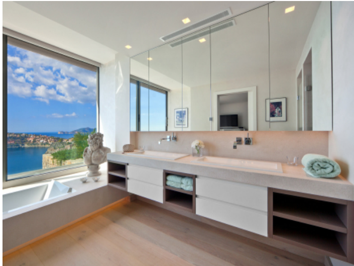
Großzügiges Badezimmer mit fantastischem Meerblick