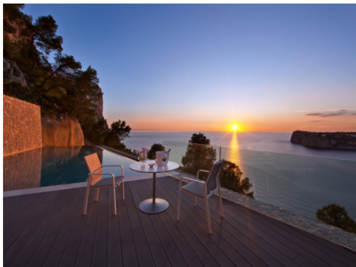
Stimmungsvolle Terrassenansicht bei Sonnenuntergang mit