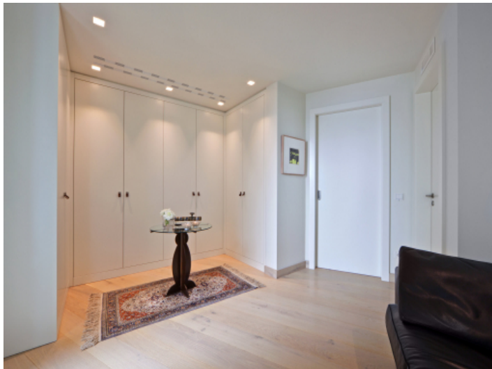
Eines der 3 Schlafzimmer mit Ankleide