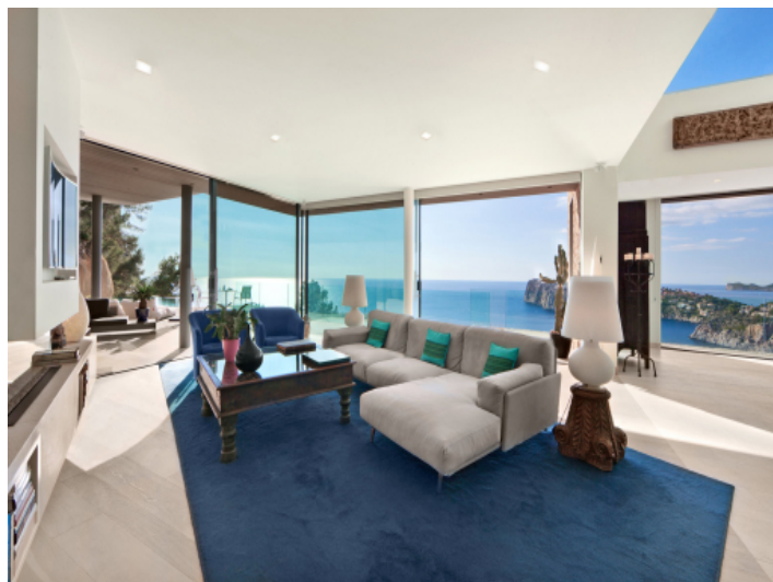
Großzügiger Wohnbereich mit Panorama-Meerblick und