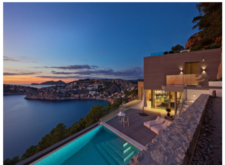
Abendliches Ambiente mit Lichtakzenten und Meerblick