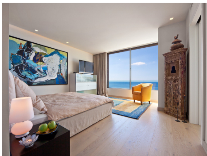
Schlafzimmer mit Bad en suite und beeindruckendem Meerblick