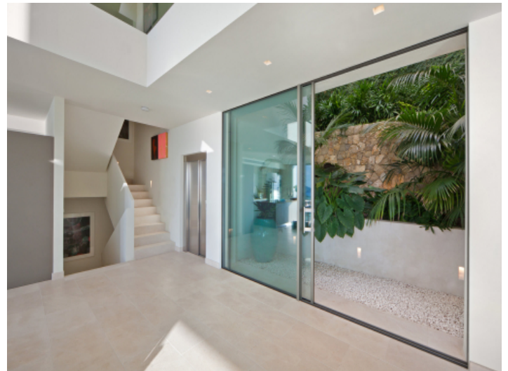
Moderner Eingangsbereich mit Aufzug und grünem Patio