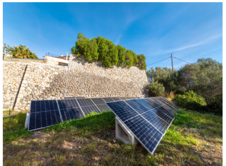
Solarenergie auf dem Grundstück