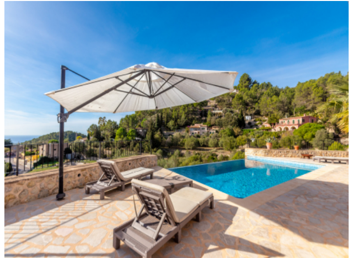
Große Naturstein Sonnenterrasse