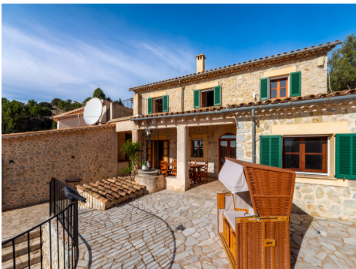
Naturstein Fassade ganz im mallorquinischem Stil