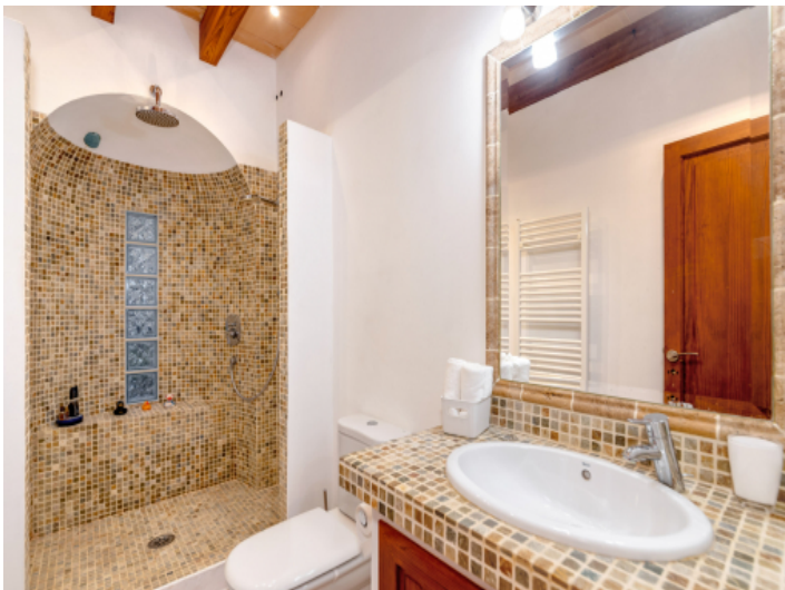
Duschbad im Landhausstil