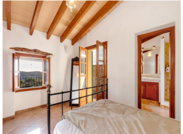
Schlafzimmer mit Holzbalkendecke