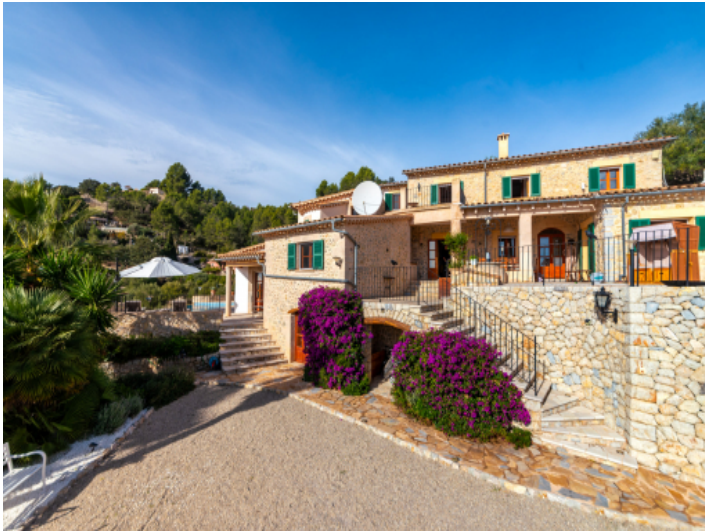
Charmantes Dorfhaus mit Pool in Galilea