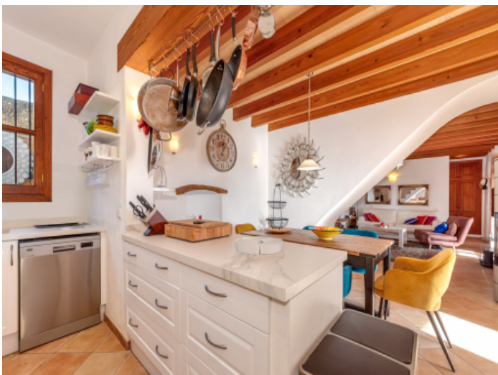
Moderne offene Küche