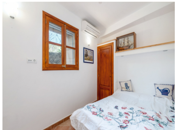
Schlafzimmer mit Klimaanlage