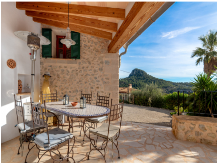
Gemütliche Essecke im Aussenbereich