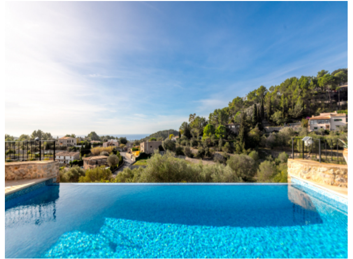
Schöner Infinity Pool