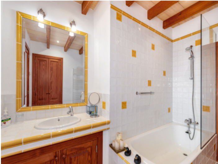
Zweites komplettes Bad