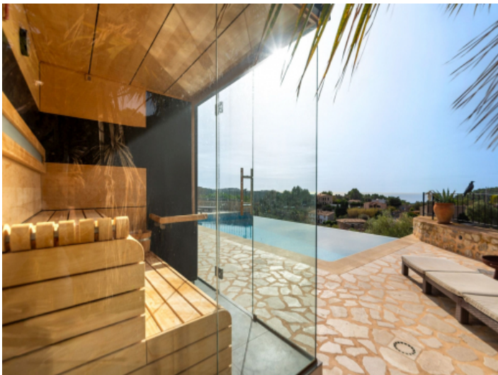
Sauna am Poolbereich