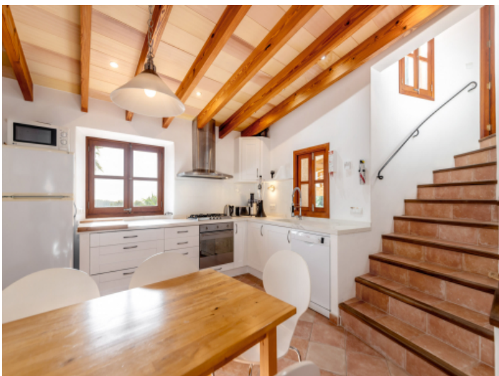
Helle und moderne 2. Küche