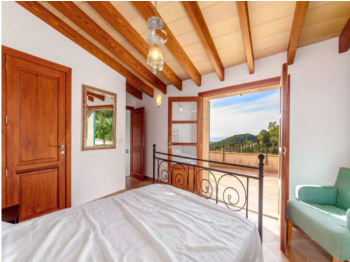
Schlafzimmer mit direktem Terrassenzugang