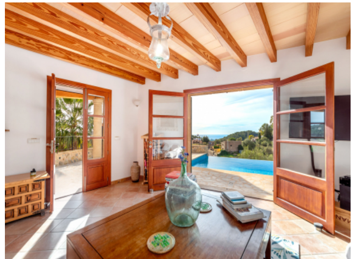
Helles Wohnzimmer mit Aussicht