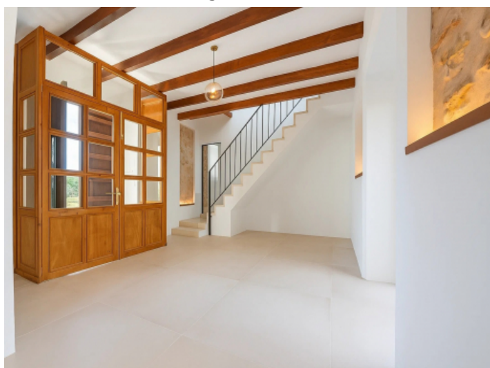
Modernes Entrée mit Treppe