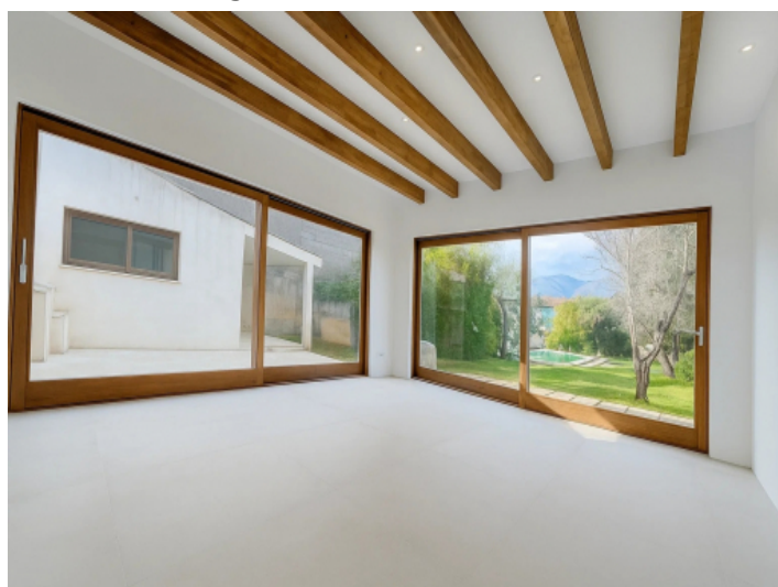
Modernes Wohn-Esszimmer mit Patiozugang