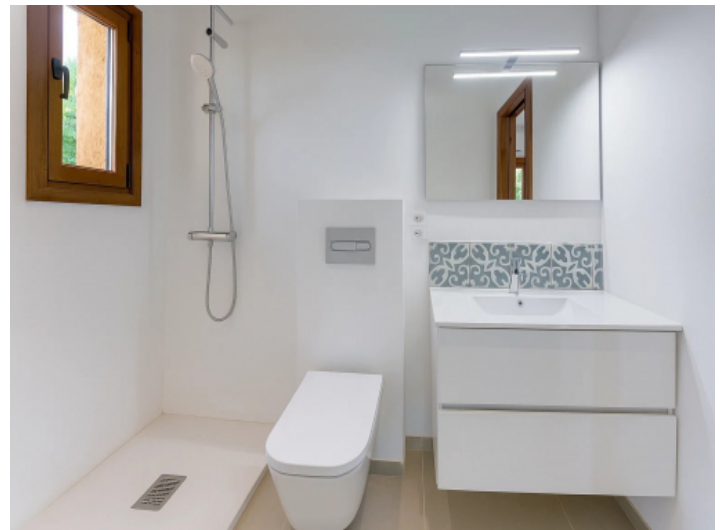
Zweites Badezimmer (en Suite) im Obergeschoss