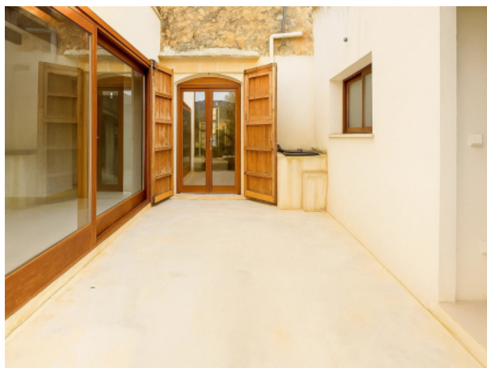
Ruhiger Innenhofbereich des Hauses