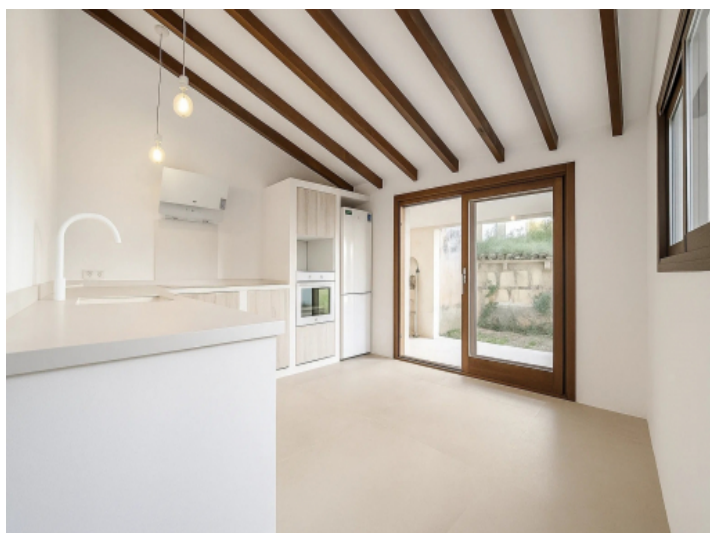
Moderne Küche mit Terrassenzugang