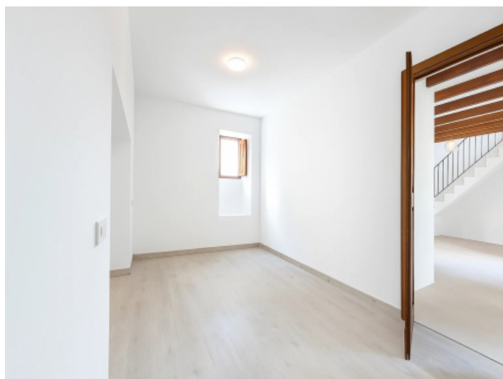
Erstes Schlafzimmer mit Holzdetails