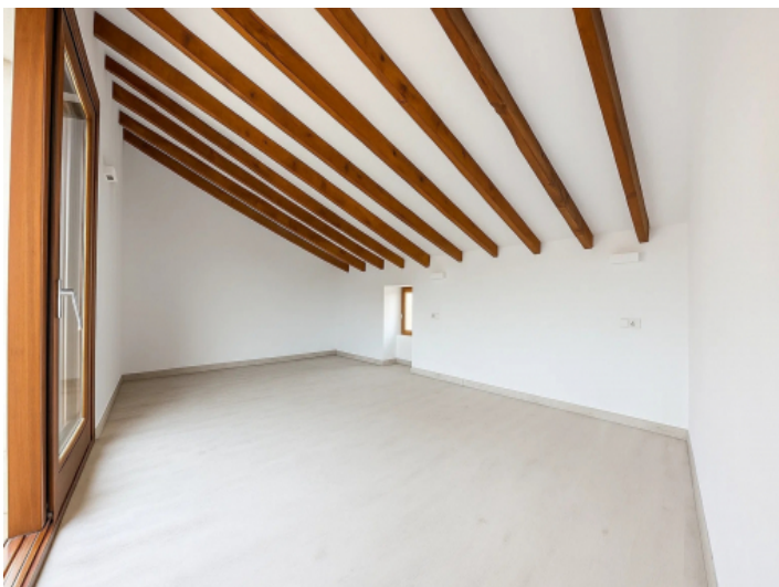
Das vierte Schlafzimmer (Mastersuite)