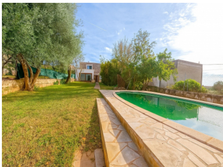
Weitläufiger Garten mit Pool