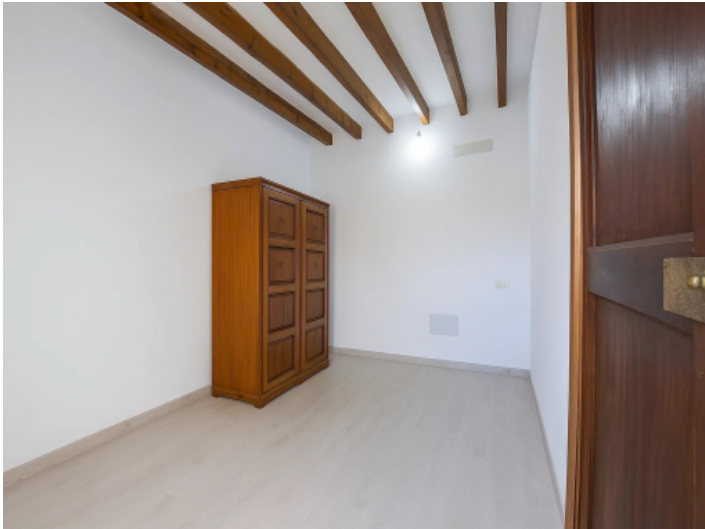
Zweites Schlafzimmer mit Holzbalken