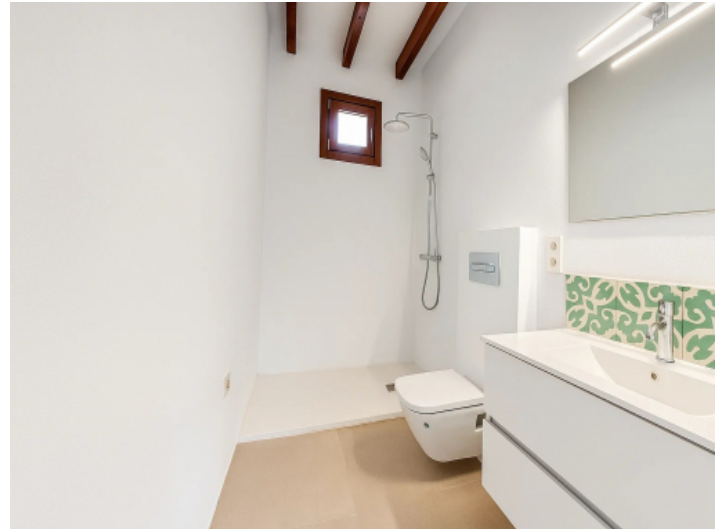
Modernes Erdgeschoss-Bad mit Dusche