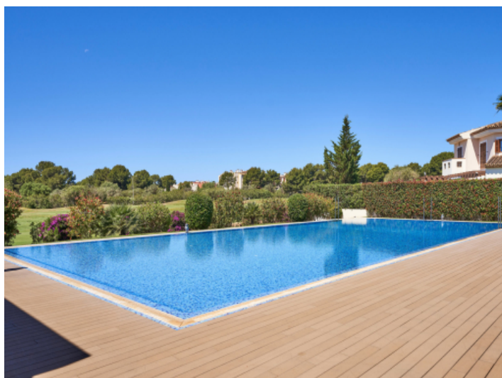
Gemeinschaftspool zum entspannen