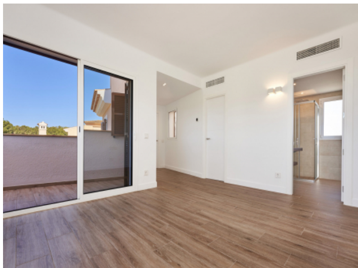
Eines der drei Schlafzimmer