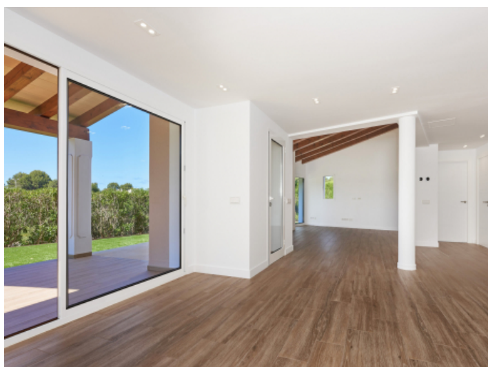
Heller Wohn/Essbereich mit Zugang zum Garten