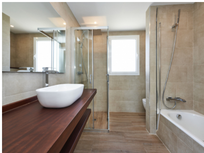
Großzügiges Badezimmer en suite