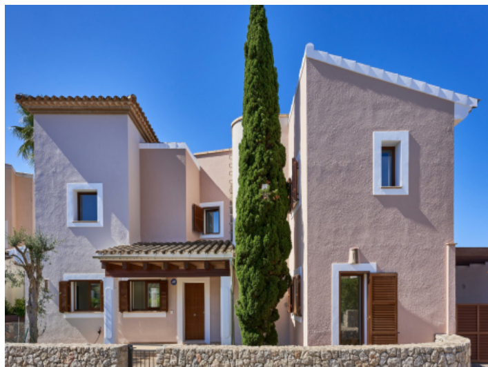
Exklusives Wohnen direkt am Golfplatz von Santa Ponsa