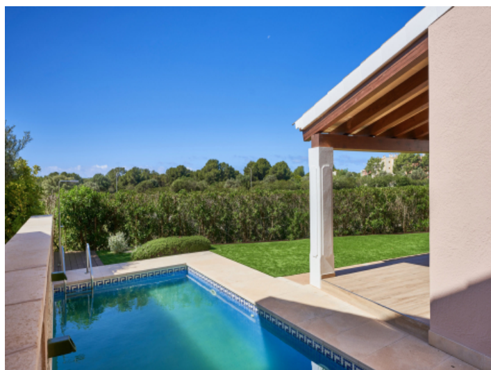
Privater Garten mit privatem Pool