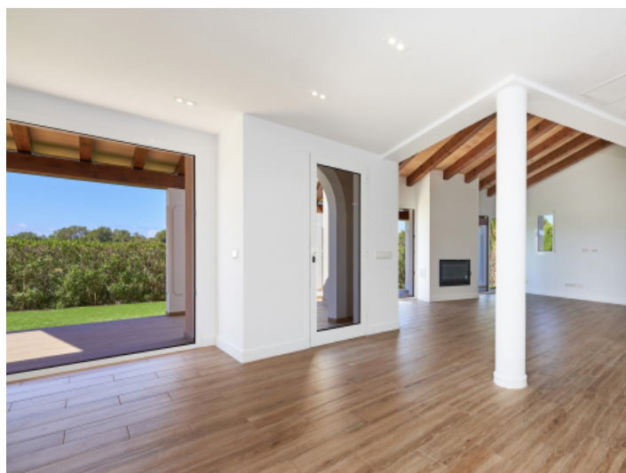
Wohnbereich mit schönen Holzbalken und Zugang zum Garten