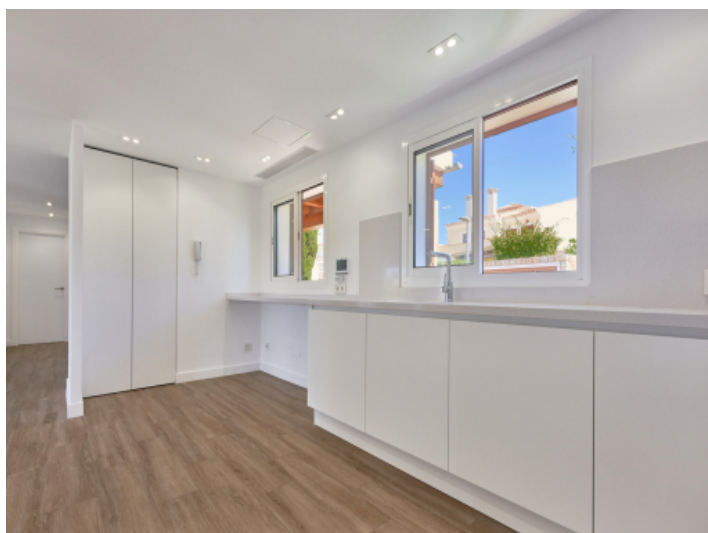
Moderne halb offene Küche