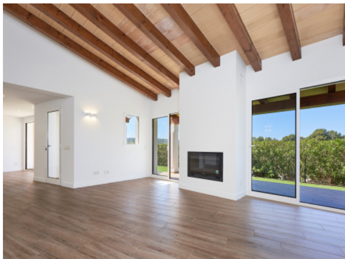
Heller Wohnbereich mit hohen Decken