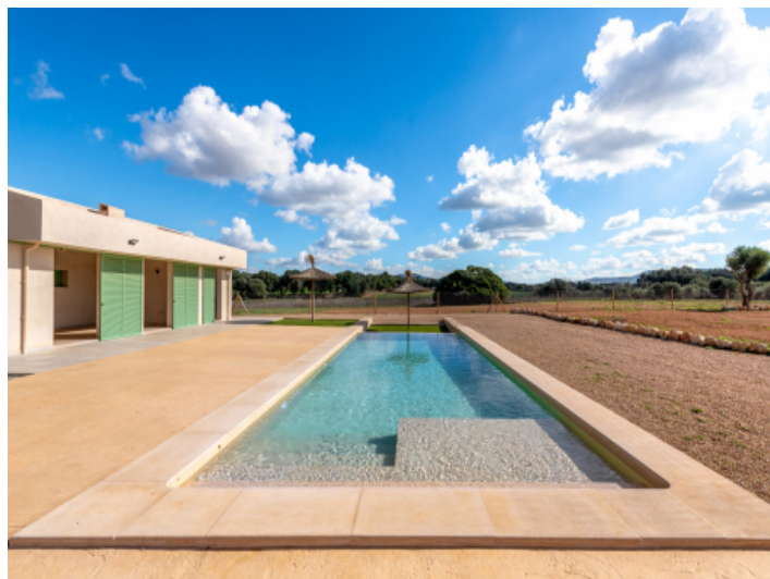
Pool mit Blick zum San Salvador