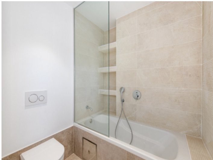
Bad en suite