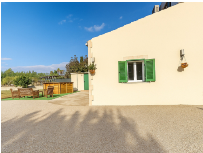
Die Seitenansicht und der Pool