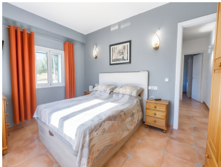
Erstes Schlafzimmer im Erdgeschoss