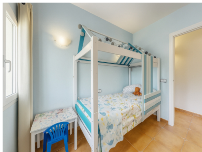
Drittes Schlafzimmer im Erdgeschoss