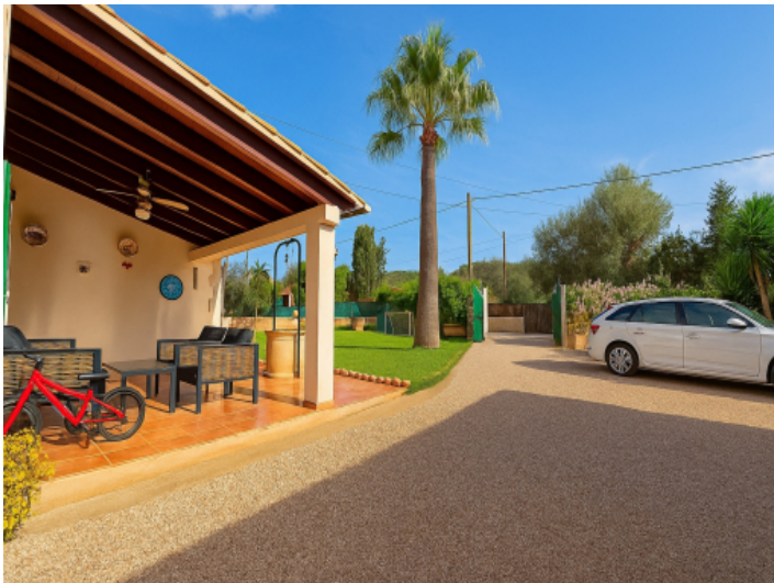
Die überdachte Terrasse und die Zufahrt