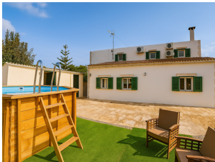
Ansicht der Rückseite