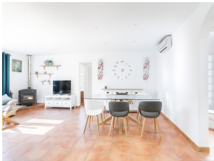
Essbereich und offener Wohnbereich