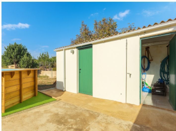
Der Swimmingpool und das Nebengebäude