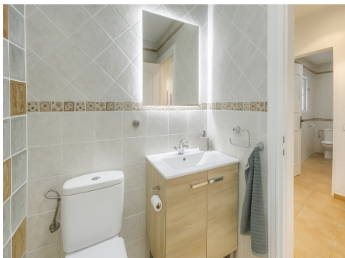
Eins von zwei Badezimmern im Erdgeschoss