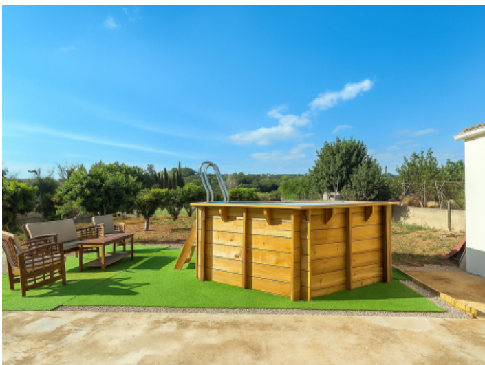
Der Pool und Liegebereich