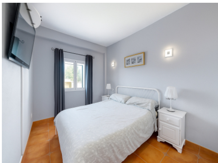
Zweites Schlafzimmer im Erdgeschoss