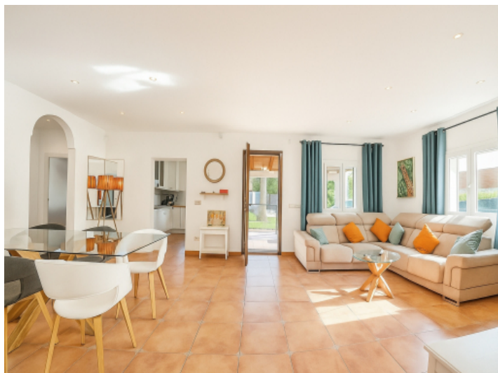
Wohn-, Essbereich und Zugang