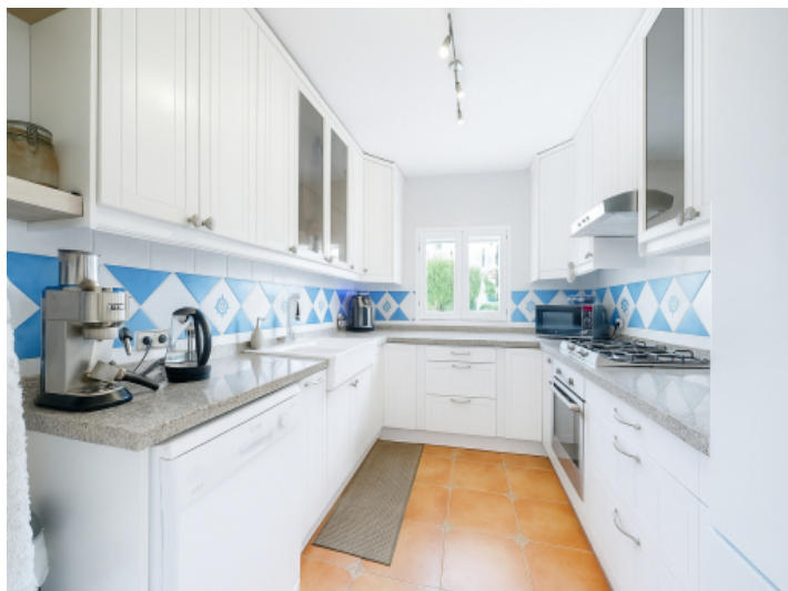
Komplett ausgestattete Küche