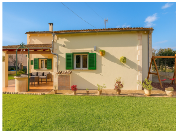
Die Frontansicht mit Zugangsbereich