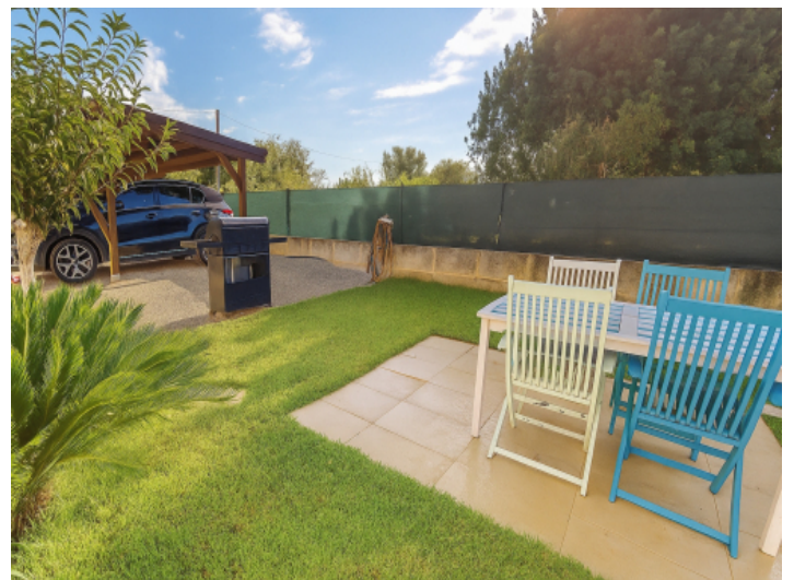
Der Grillbereich und die überdachten Pkw-Stellplätze