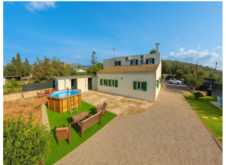
Ansicht der Rückseite der Finka mit Pool