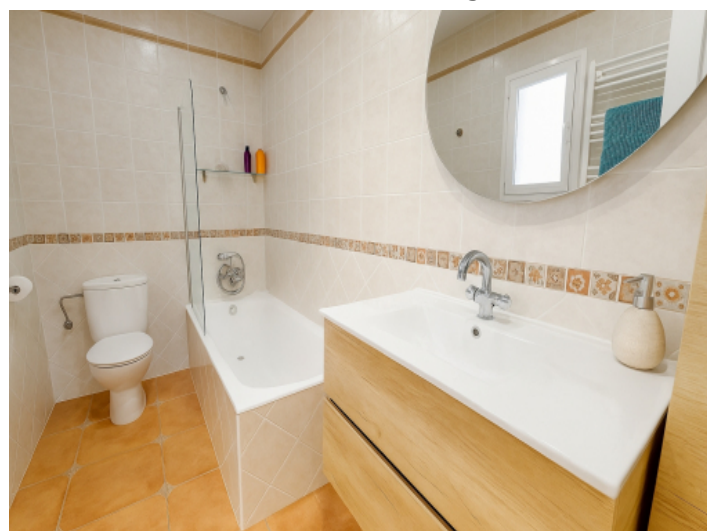
Badezimmer im Obergeschoss