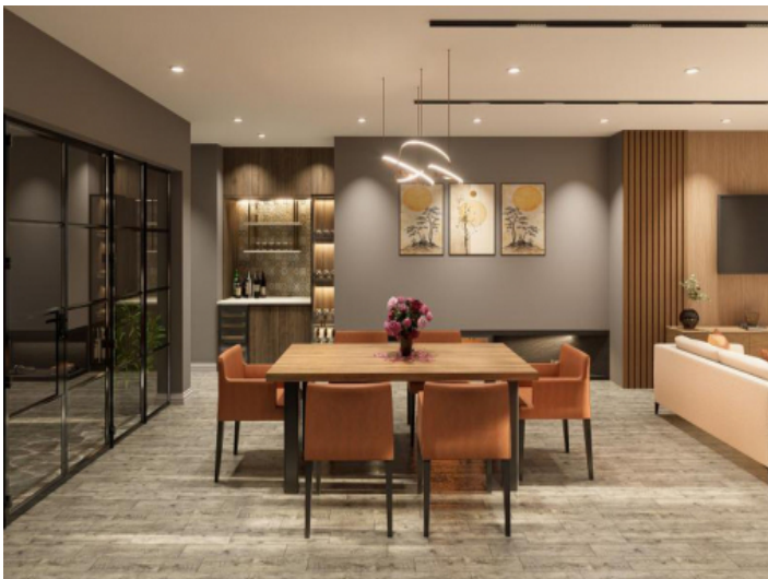
Offener Essbereich mit moderner Beleuchtung und