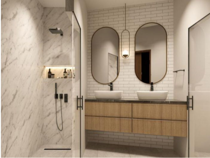
Luxuriöses Badezimmer mit Doppelwaschbecken und