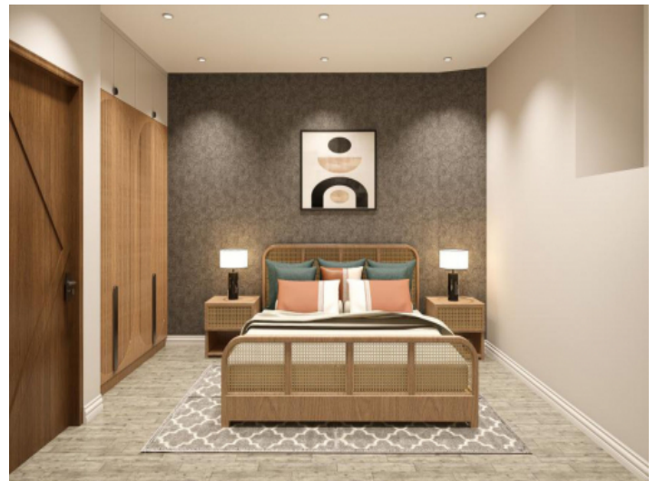
Schlafzimmer mit dekorativer Akzentwand und harmonischen