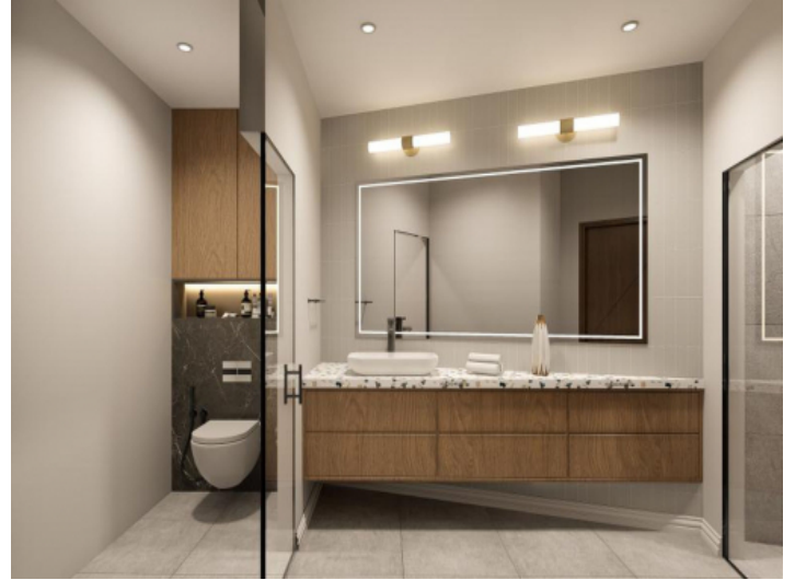
Modernes Badezimmer mit großem Spiegel und Holzdetails