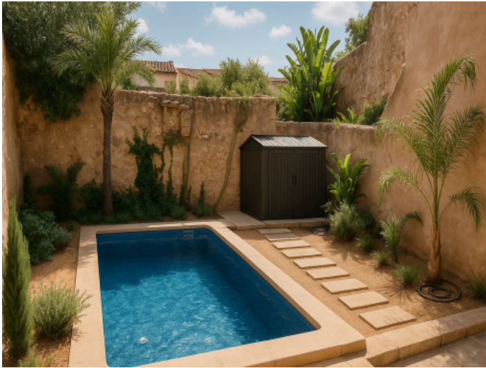
Pflegeleicht gestalteter mediterraner Außenbereich mit