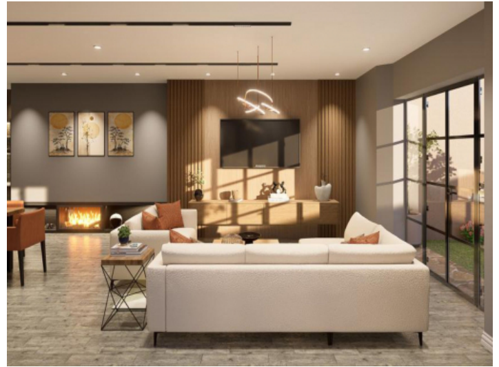
Wohnbereich mit Kamin und gemütlicher Sofalandschaft