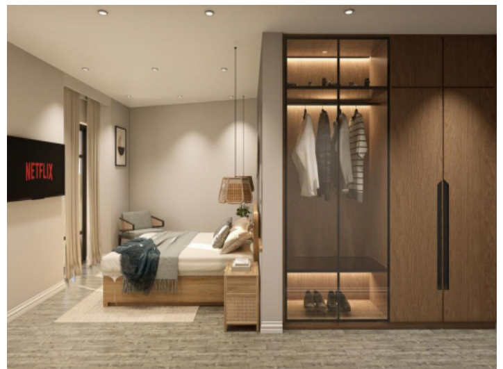
Eines der drei gemütlichen Doppelschlafzimmern