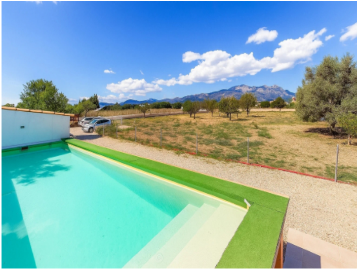
Swimmingpool mit Blick in die Landschaft