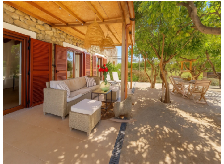
Überdachte Terrasse mit Sitzbereichen