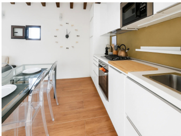
Küche und Essbereich