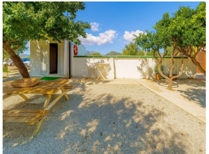
Poolhaus und Pool