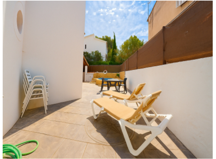
Weg zum Pool