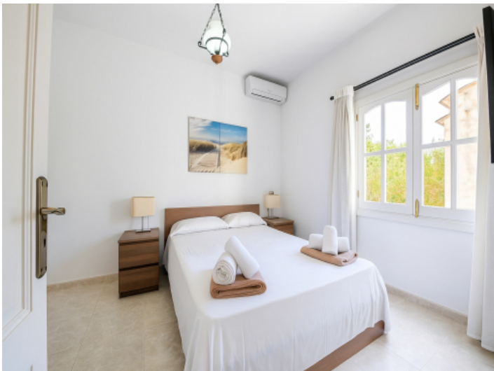
Zweites Schlafzimmer im Obergeschoss