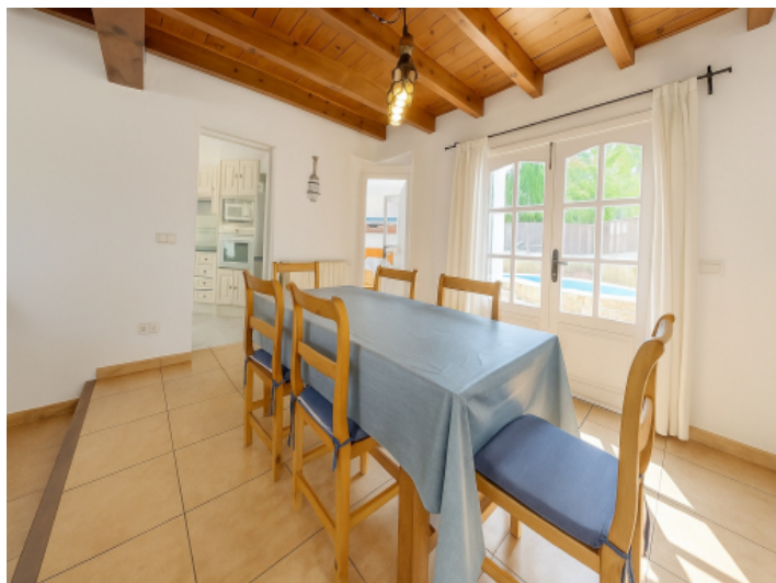
Essbereich mit Terrassenzugang