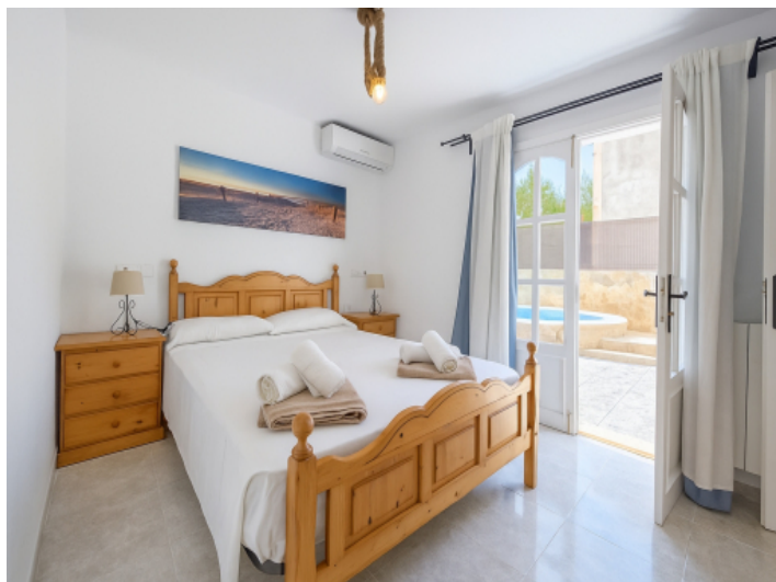
Suite im Erdgeschoss