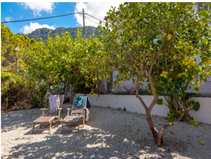
Terrasse mit alten Zitronenbäumen