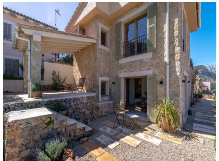
Seitenansicht der Natursteinfassade und Veranda 2