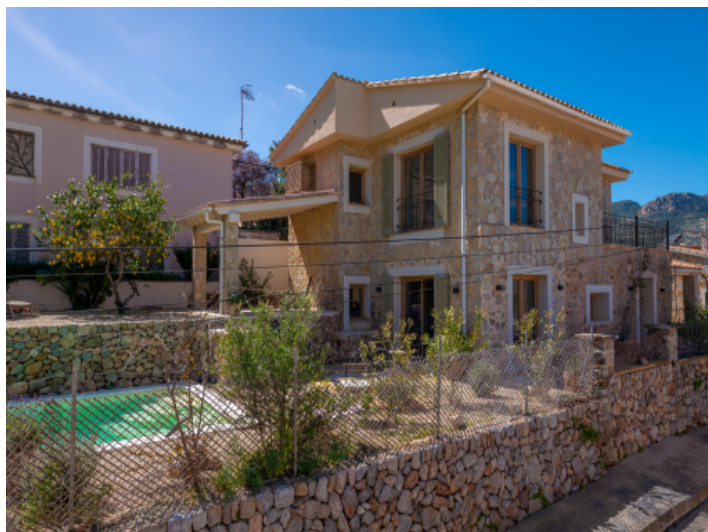
Ansicht von der Straße