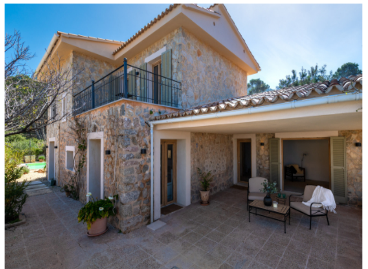
Seitenansicht der Natursteinfassade und der Eingangsveranda