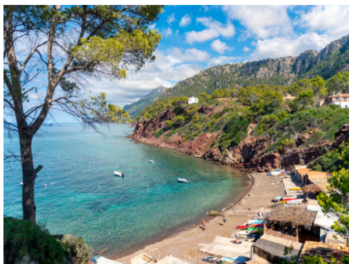
Strand Port des Canonge