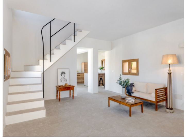
Offener Wohnbereich mit der Küche im Hintergrund