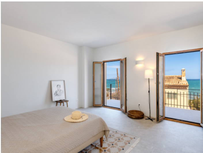
Hauptschlafzimmer mit Meerblick