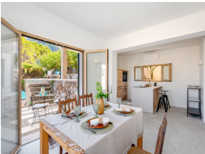
Esszimmer und Küche