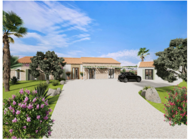
Ansicht auf Bauprojekt