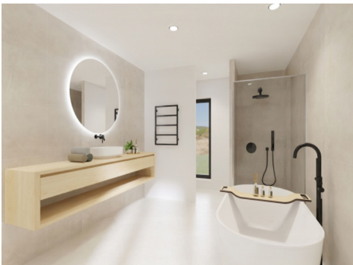
Drei moderne Badezimmer