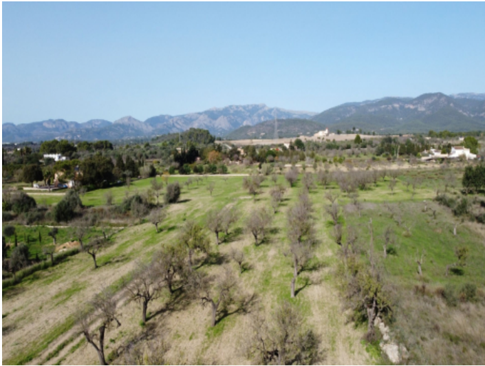
Grundstück mit Sicht auf das Tramuntana Gebirge