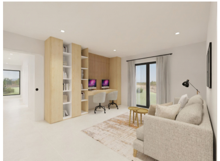
Ein weiteres Schlafzimmer