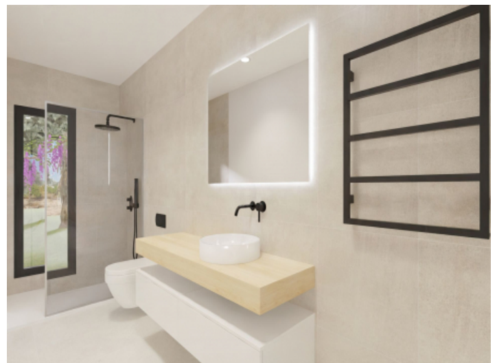
Badezimmer mit bodentiefer Dusche