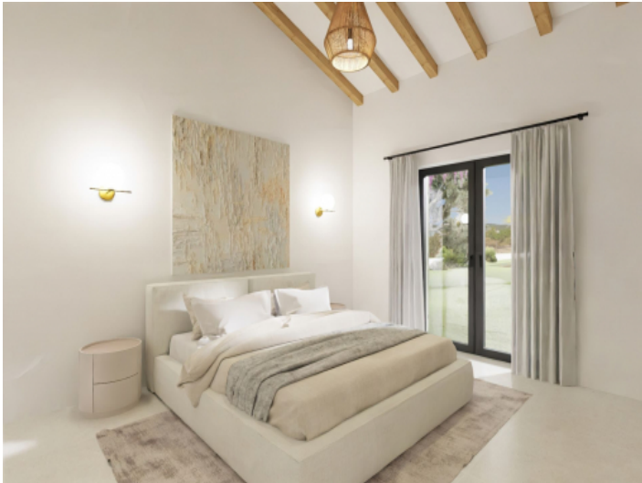
Eines von 4 geplanten Schlafzimmern