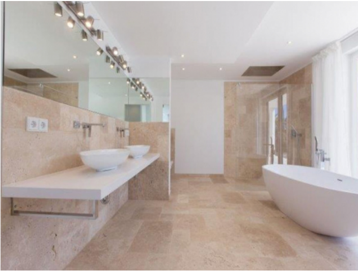
Nobles Badezimmer mit Badewanne