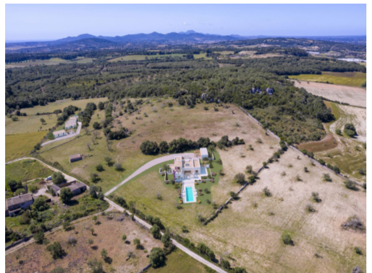
Ansicht auf das Projekt