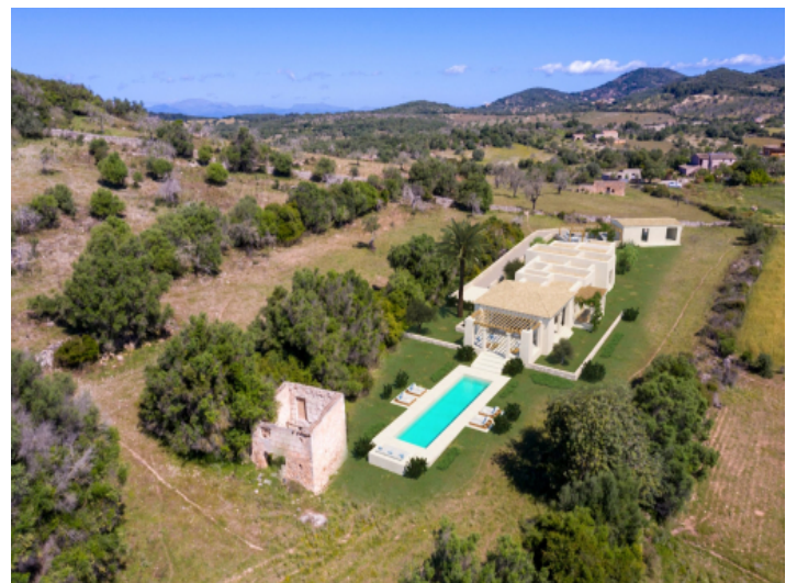
Ansicht auf das Projekt