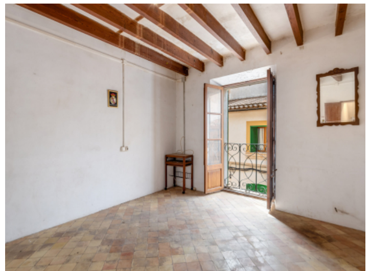
Zimmer auf der 1. Etage