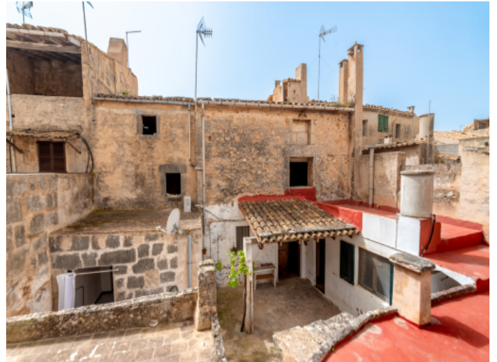
Blick auf den Innenhof