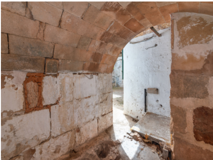
Alte Stallungen mit Zugang in den Innenhof