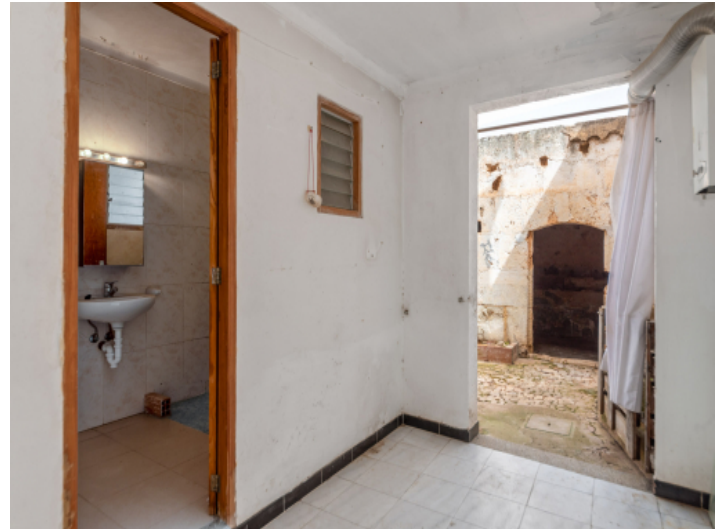
Badezimmer im Erdgeschoss