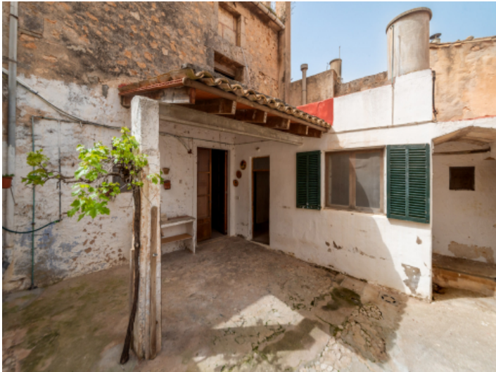
Innenhof mit vielen Möglichkeiten