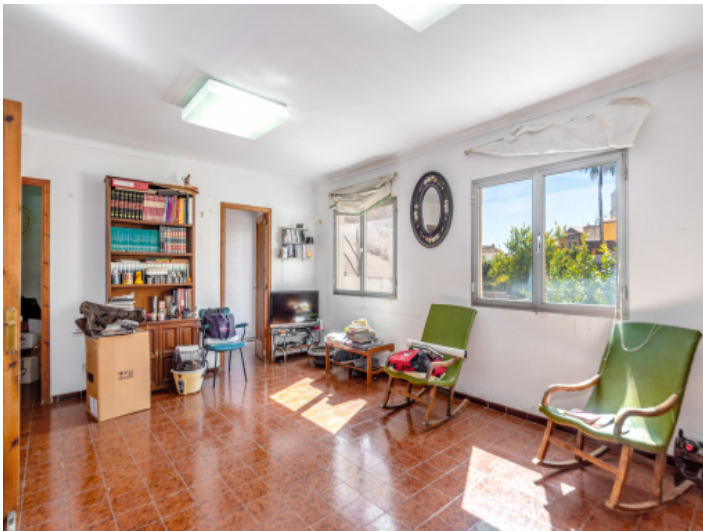
Zimmer im Obergeschoss