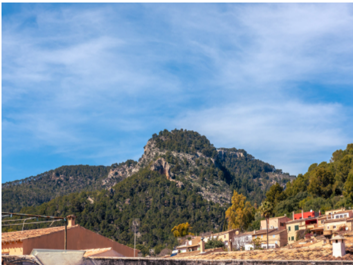
Aussicht von der Dachterrasse