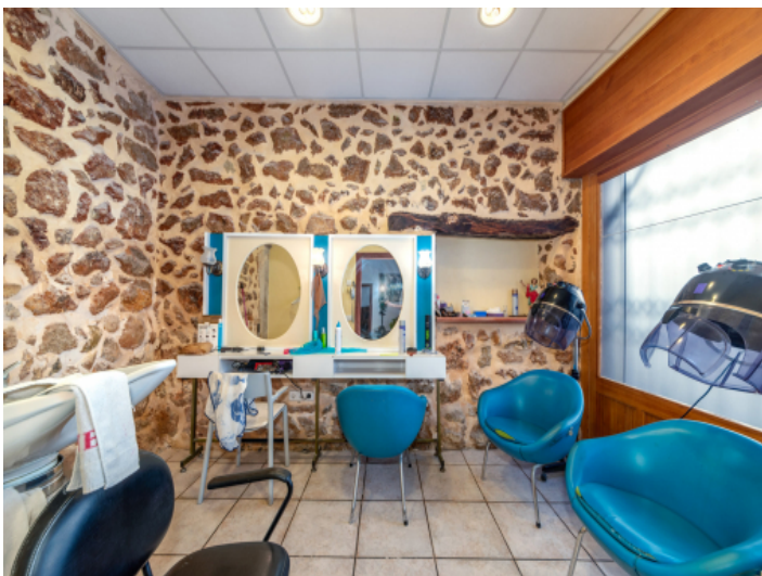
Zimmer am Eingangsbereich