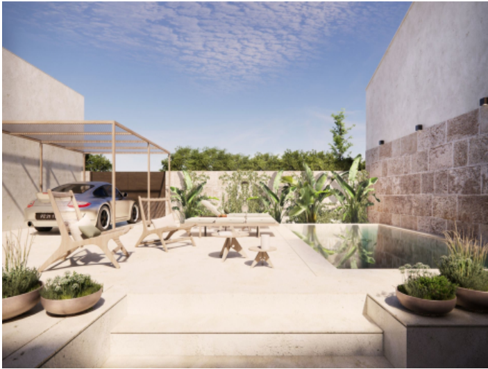
Poolbereich mit Sonnenterrasse