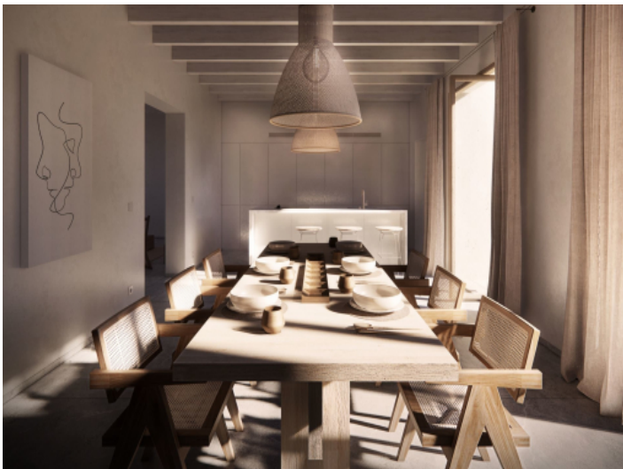
Essbereich und Küche