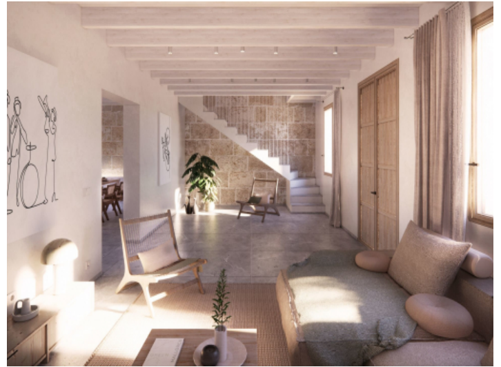
Eingangs- und Wohnbereich