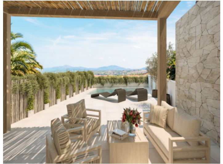
Terrasse und Poolbereich