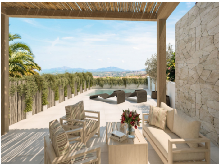
Terrasse und Poolbereich