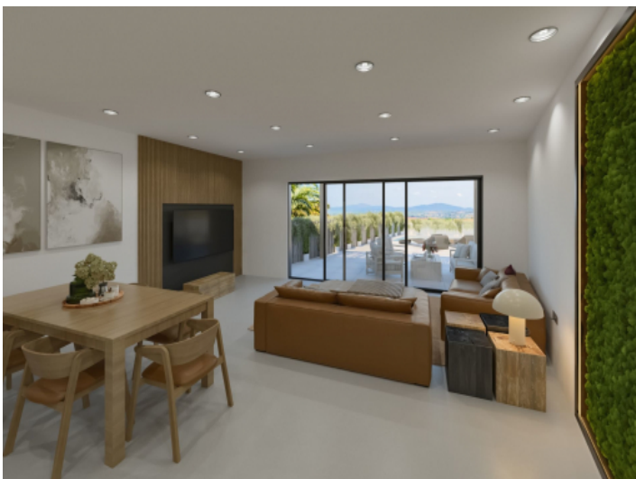
Wohnbereich mit Terrassenzugang