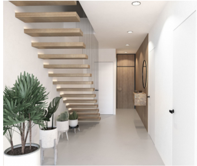
Flur und Treppenaufgang