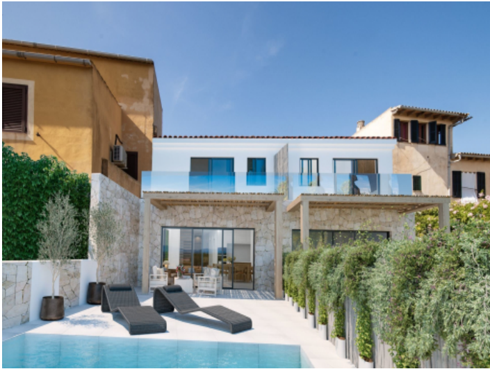
Haus, Maria de la Salut