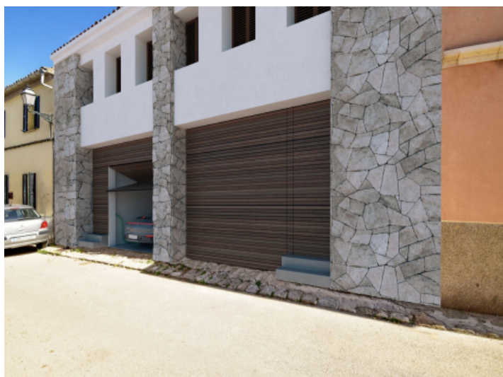
Frontansicht und Garage