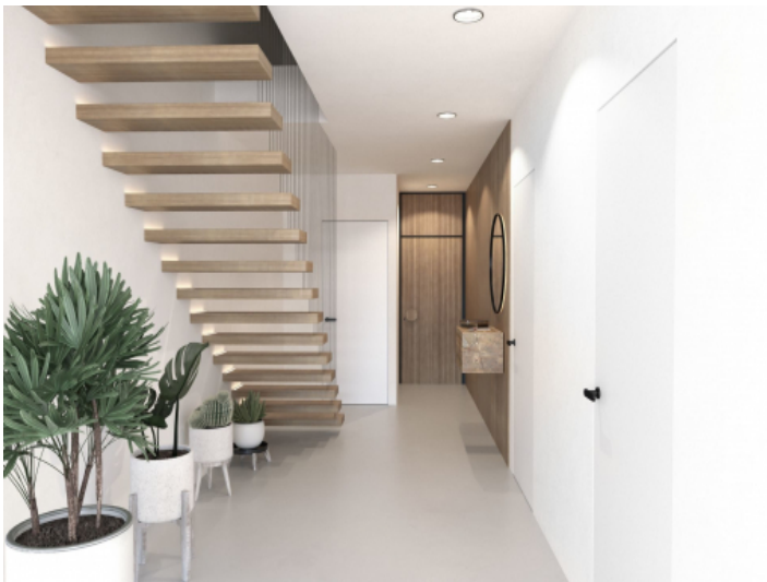
Flur und Treppenaufgang