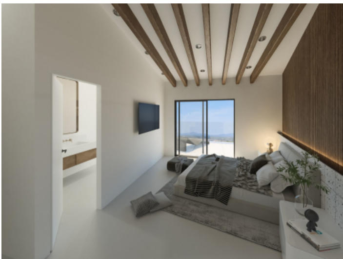
Schlafzimmer mit Terrasse