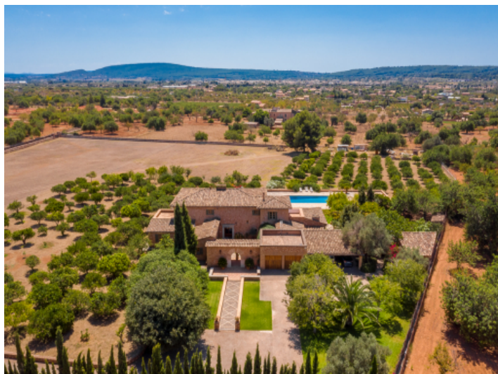
Ansicht aus der Vogelperspektive