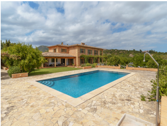
Großer, privater Poolbereich