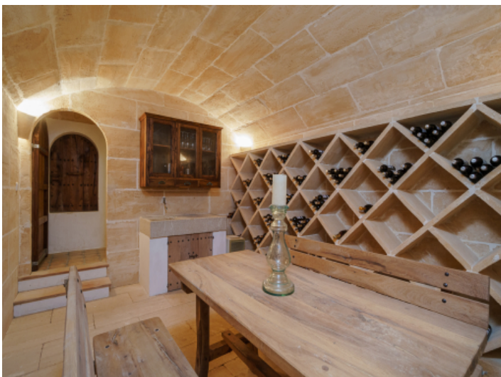
Weinkeller mit Gewölbedecke