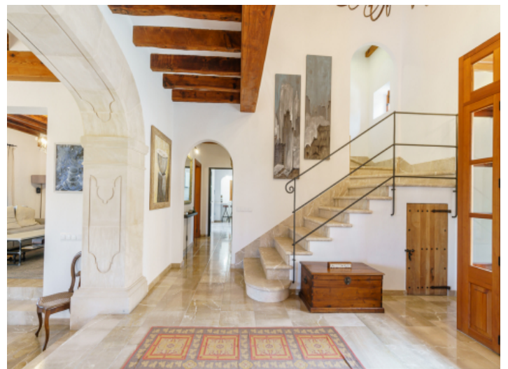
Eingangsbereich der Finca