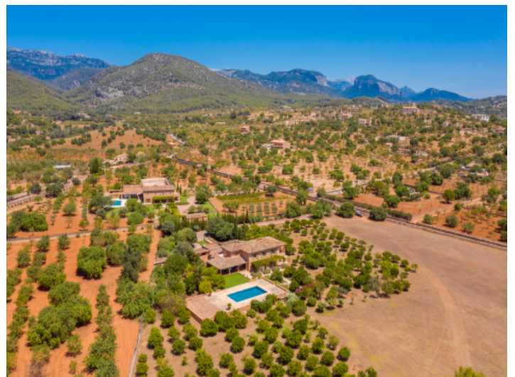
Ansicht aus der Vogelperspektive