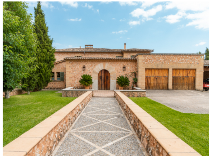
Außenansicht der Finca