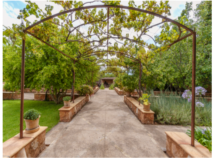
Ansicht des Gartens