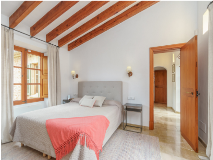
Hauptschlafzimmer mit Badezimmer en Suite