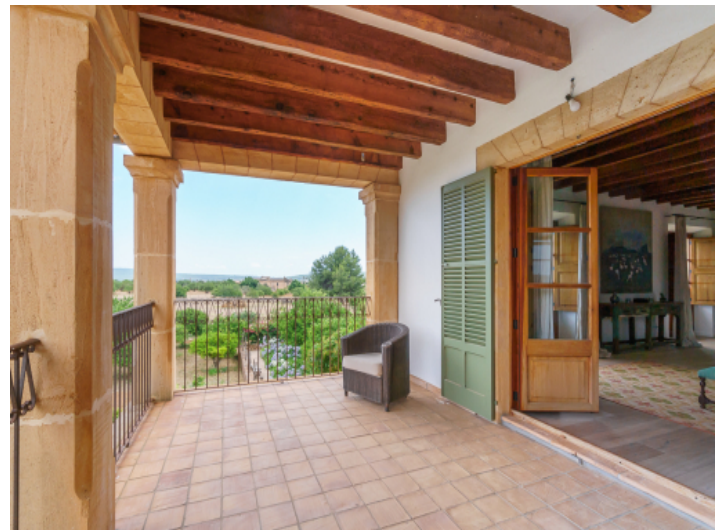
Balkon des Schlafzimmers