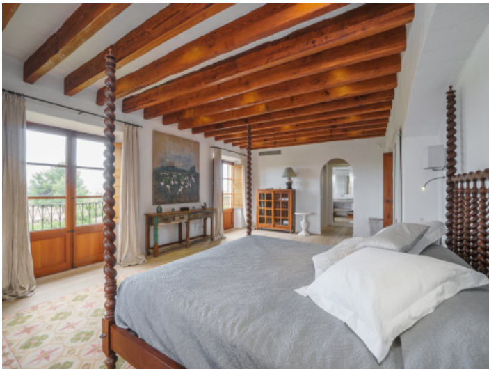
Zweites Schlafzimmer mit Badezimmer en Suite