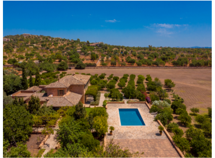
Ansicht aus der Vogelperspektive