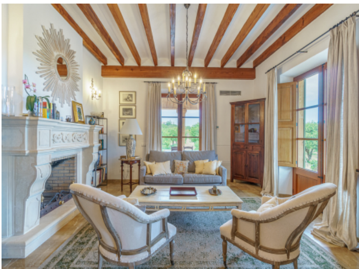
Gemütlicher Wohnbereich mit Kamin