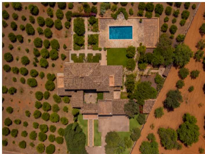
Ansicht aus der Vogelperspektive