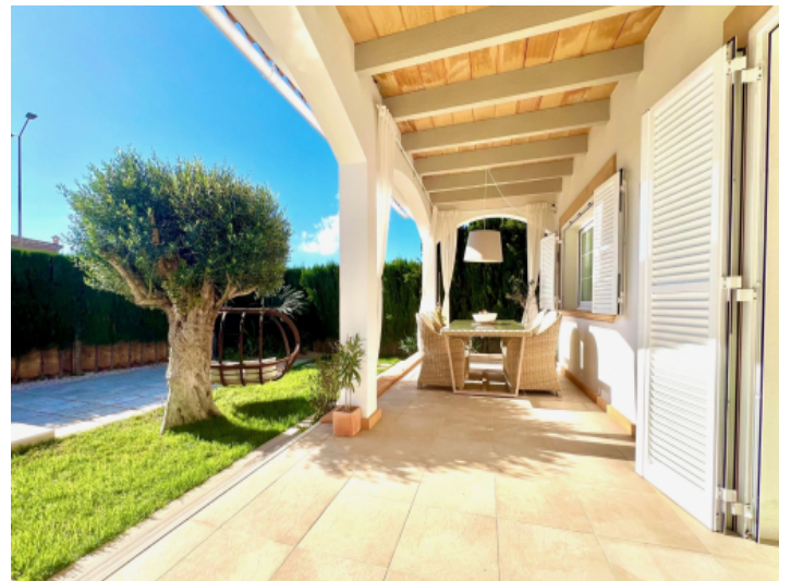
Überdachte Terrasse mit Gartenblick