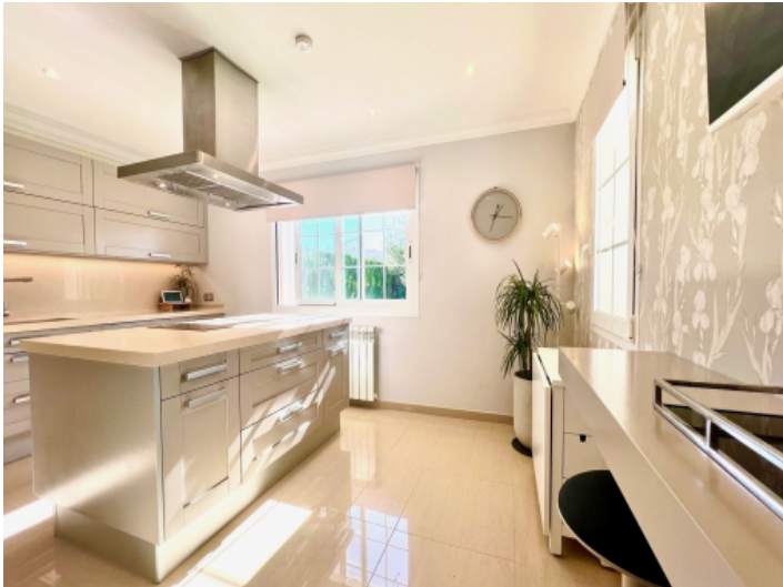
Moderne Küche mit Kochinsel