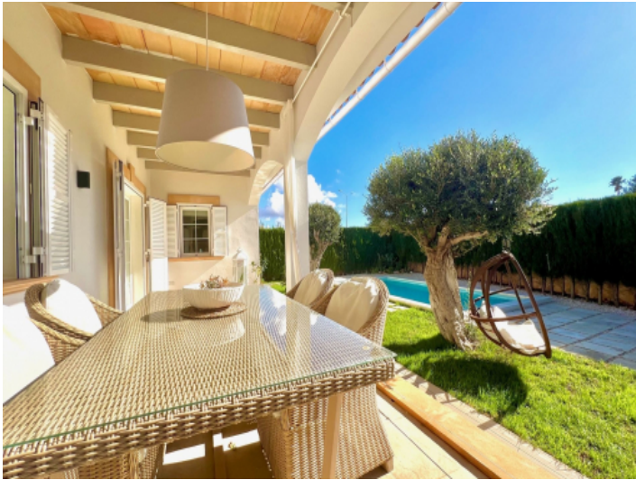
Überdachte Terrasse mit Essbereich