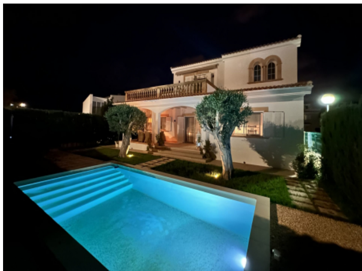
Außenansicht bei Nacht