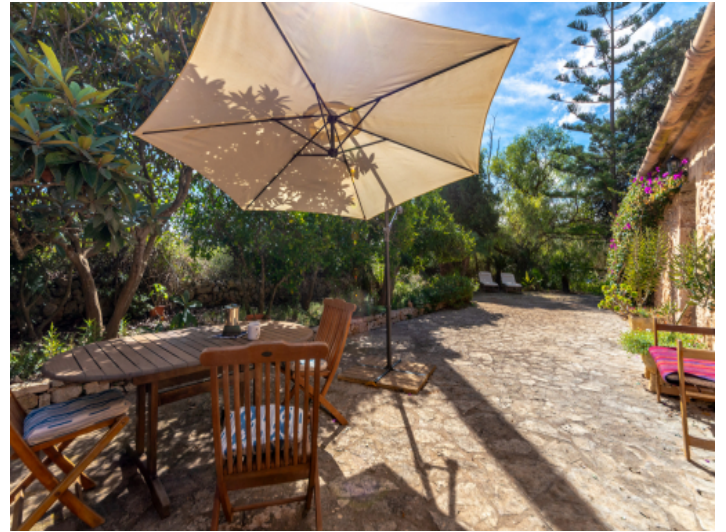
Herrliche Terrasse umgeben von Natur