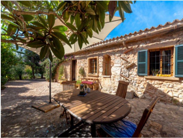
Idyllische Fronterrasse und Eingang zur Finca