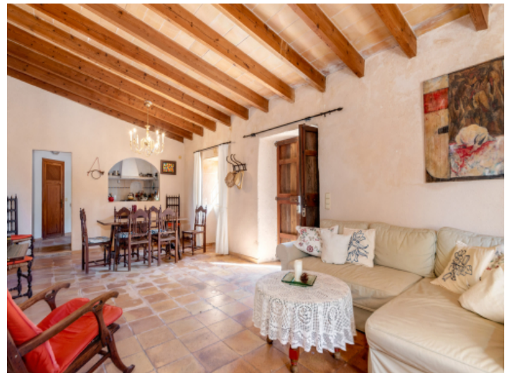
Offener Wohn-und Essbereich