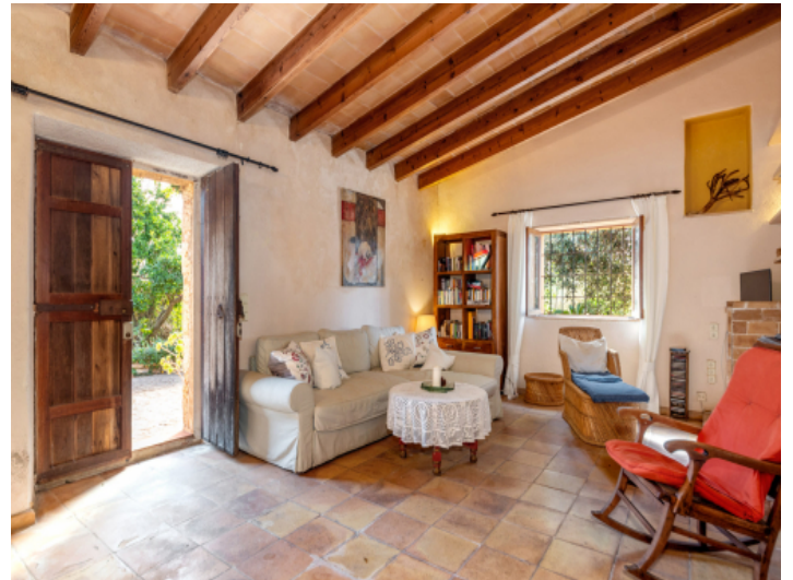
Haupteingang und Wohnbereich