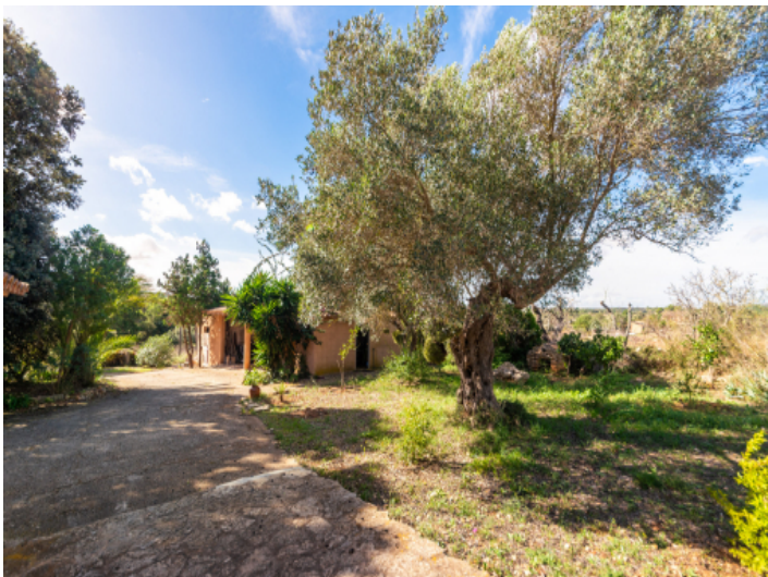
Großes Grundstück mit Olivenbäumen