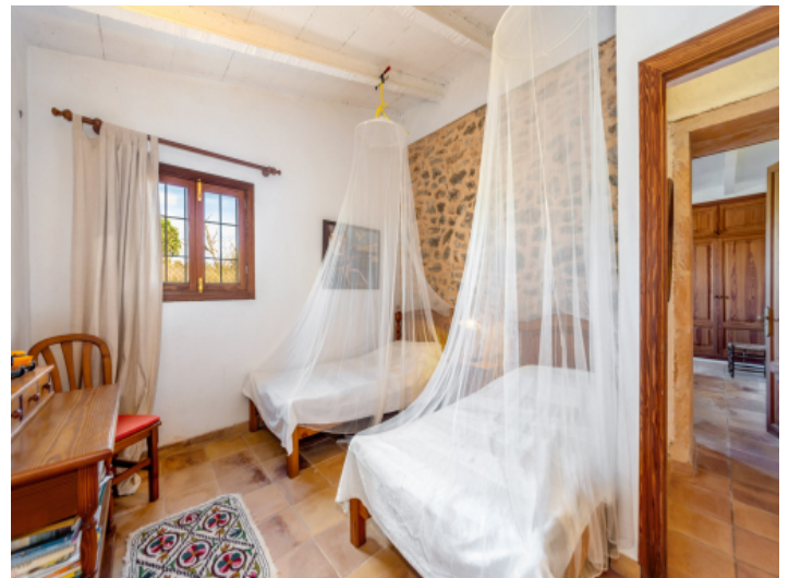
Schlafzimmer mit Natursteinwand